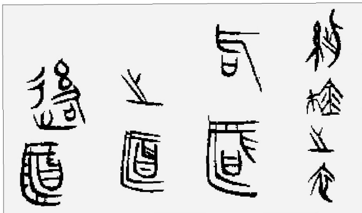
（图七）漆箱上的锥刻文字 湖北省随县城关镇擂鼓墩曾侯乙墓出土 战国早期