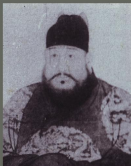
宣德皇帝朱瞻基像

明宣宗朱瞻基是明代第5个皇帝，素有“风流天子”的称号。他在完成“仁宣之治”的同时，也开创了明代帝王腐败放纵生活的先例。在家庭生活中，朱瞻基导演了一场换皇后的闹剧。