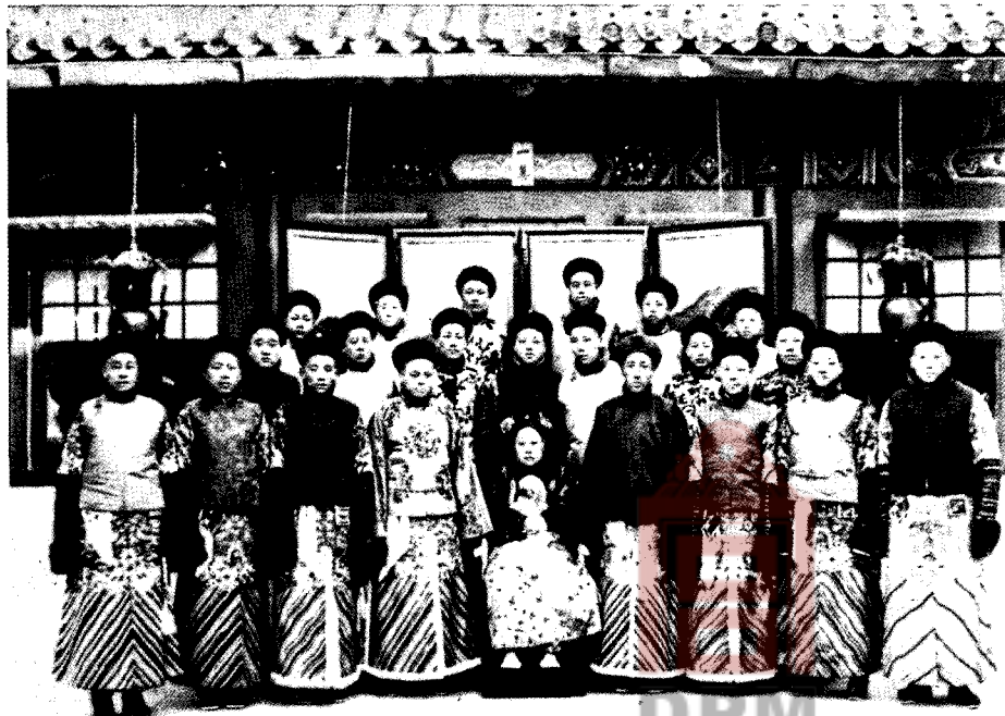
瑾妃和太監們 Imperial Concubine Jin with eunuchs