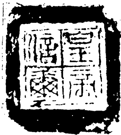
漢“皇帝信璽”封泥拓本 Impression of the Han emperor's seal. It reads "Huangdi Xinxi".

皇帝的印章有公章和私章之分。代表國家發佈詔書或其他文告時鈐用的可稱為公章，是皇權的象徵，古人稱之為寶璽、御璽、御寶或國寶。寶璽伴隨着我國第一個皇帝的出現而行世。《史記·秦始皇本紀》記載秦始皇殞留之際，“乃為璽書賜公子扶蘇”，又記劉邦軍迫咸陽，秦王“子嬰即繫頸以組，白馬素車，奉天子璽符，降軹道旁”。關於始皇璽的形制，史書均說它是用藍田玉鑄製，螭虎鈕，印文為丞相李斯所書，然內容則其說不一，有曰“受命於天，既壽永昌”；有曰“受天之命，皇帝壽昌”，未知孰是。始皇璽歸漢後，即被漢高祖定為