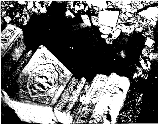
前套五供中的石“燭臺” Stone candlestick of the Five Stone Sacrificial Vessels