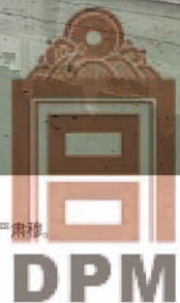
4 辟雍架在圆池中之方岛上，四边以石桥联外，气氛庄严肃穆。