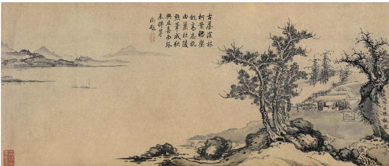
〔图十四〕明佚名《寿朴堂图》卷 四川博物院藏