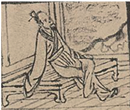
〔图四:1〕元张渥《竹西草堂图》中主人形象