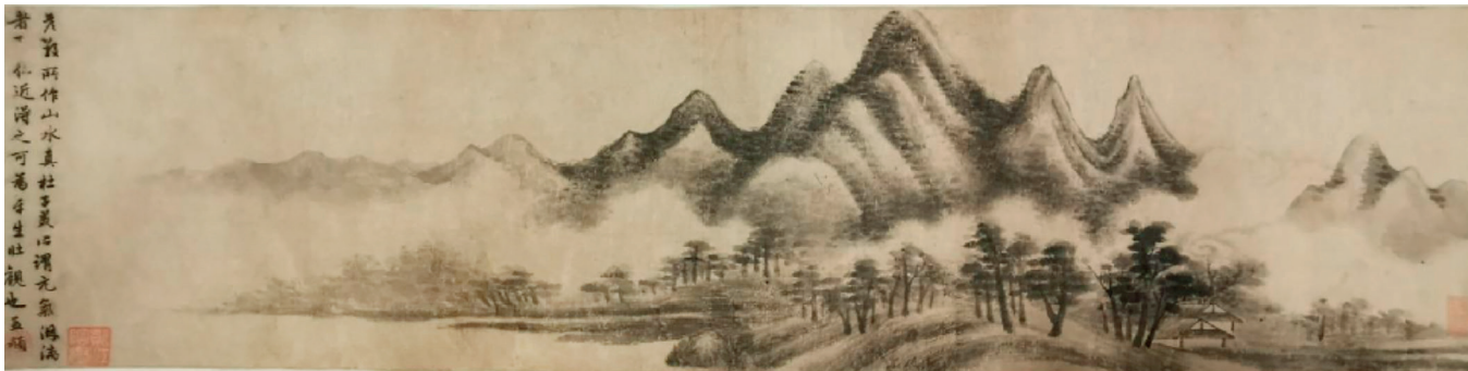
〔图二〕元高克恭(传)《山村图》卷 上海博物馆藏