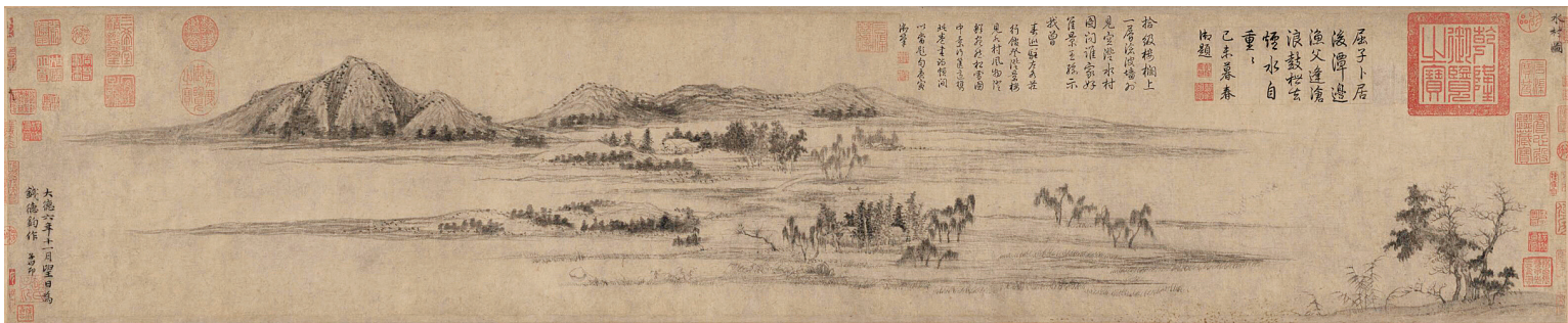
【图一】元赵孟頫《水村图》卷 故宫博物院藏

万柳堂、清露堂、遗音堂等建筑，是主人与名士宴饮之所，赵孟頫曾参与延祐初的万柳堂雅集 ① 。台北故宫博物院今藏一件传为赵孟頫所作《万柳堂图》，然是后世伪作。廉氏家族成员多次参与斋室、别号图绘制，显示出斋室别号图制作的另一个维度，即“华化”的过程。