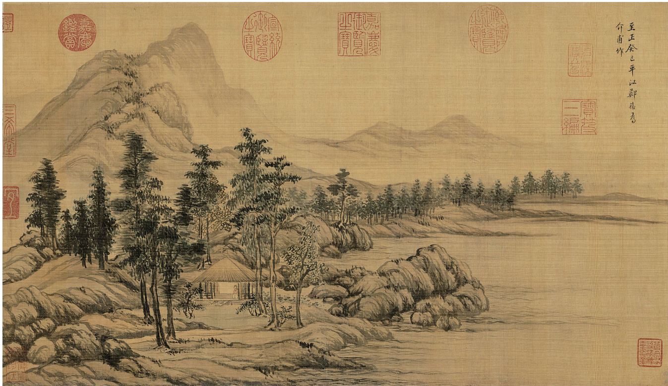
〔图六〕元朱德润《秀野轩图》卷