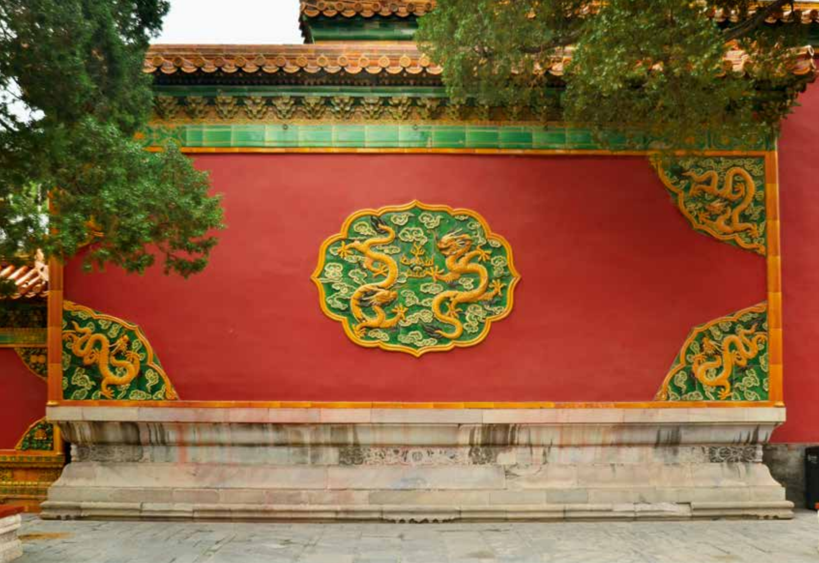
太极殿正殿前的琉璃座山影壁（北向南）