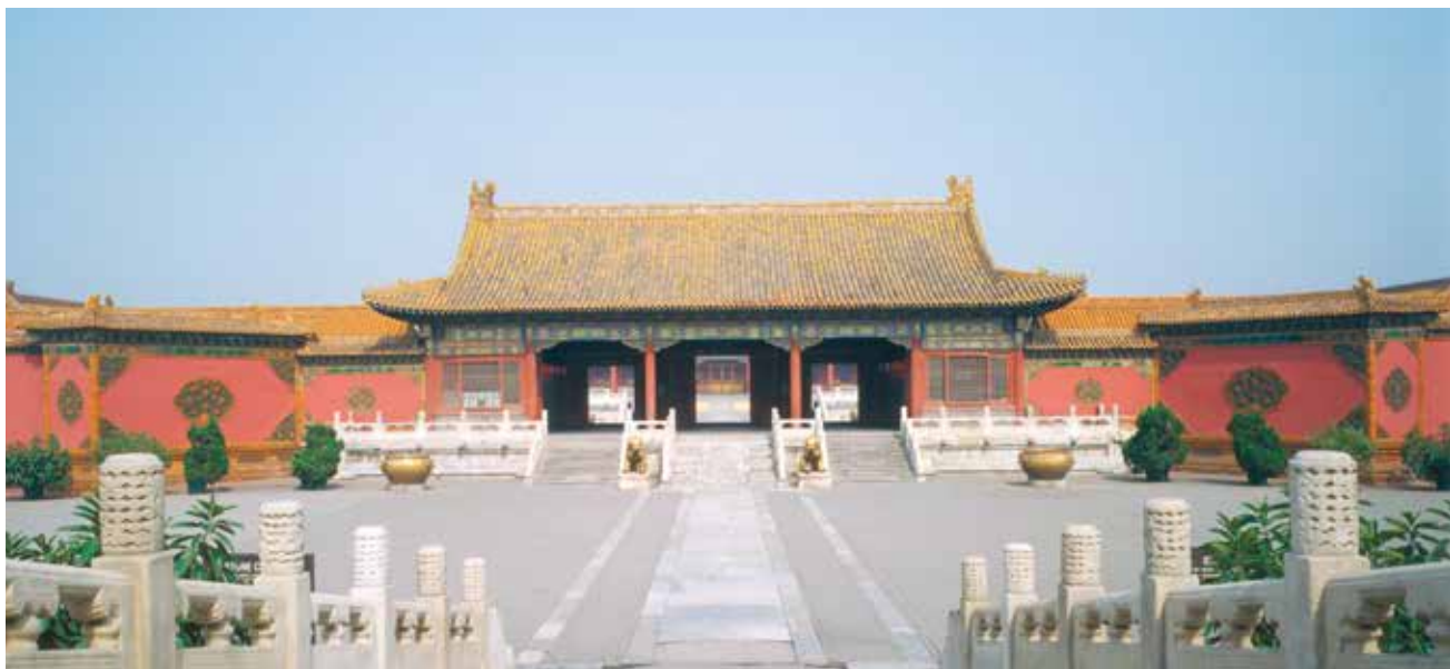
乾清门一封书撇山琉璃影壁

笔者通过对紫禁城现存影壁的考察调研，发现其建造严格遵循皇家影壁等级规格，形制多样，在建筑材质和造型设计上都非常讲究，既彰显皇家的尊贵气质，又增添建筑空间的流动和美观，既能表达宫廷主人的美好愿景，又保证了皇宫院落空间的秩序感和领域感。紫禁城现存影壁根据其位置和平面形式可分为座山影壁、一字影壁、八字影壁和撇山琉璃影壁四类。（刘大可《中国古建筑瓦石营法》，中国建筑工业出版社，二〇〇四年六月） 根据建造材料又可分为木质影壁、琉璃影壁、石影壁三类，其中御窑琉璃影壁规格最高，如太极殿（原名未央宫，嘉靖十四年更名启祥宫，清代晚期改称太极殿）正殿前的琉璃座山影壁，宁寿宫皇极门外黄琉璃瓦庑殿顶式九龙壁，乾清门一封书撇山琉璃影壁（又称雁翅琉璃影壁，「一封书」是指其样式像中式木版书），天一门琉璃影壁。木质影壁在独立影壁中数量最多，如寿安宫和寿康宫门内端庄厚重的木影壁，