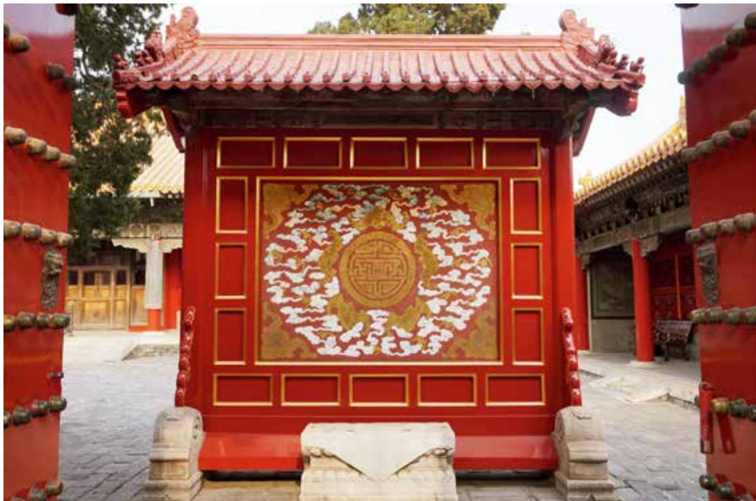
太极殿南大门内木影壁（南向北）