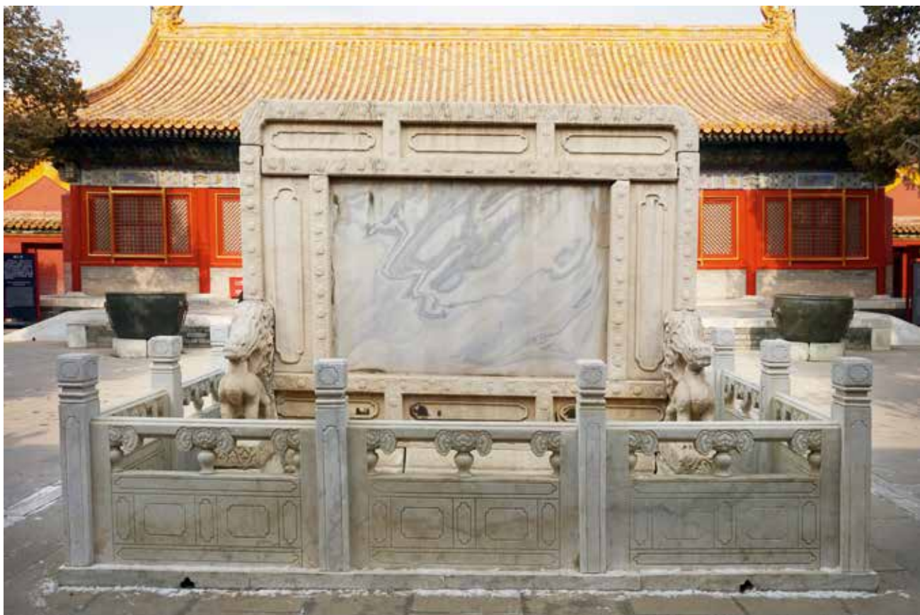
景仁宫门内插屏式石影壁（南向北）