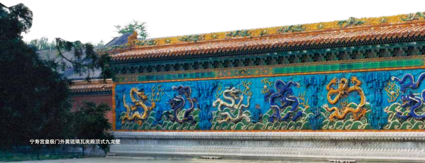
宁寿宫皇极门外黄琉璃瓦庑殿顶式九龙壁