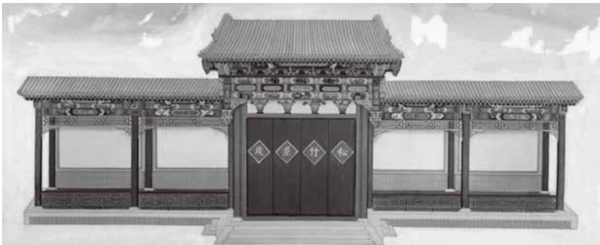
清 钟粹宫内垂花门影壁画样 故宫博物院藏

二是装饰图案影壁，是根据图案物体的特性，以象征、会意、谐音的表现手法，表达吉祥的含义。太极殿琉璃影壁的主题是琉璃制祥云蟠龙图案，中心