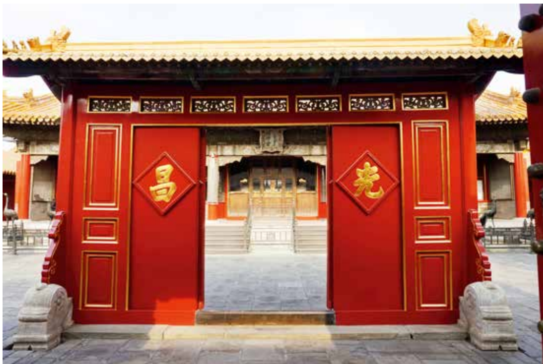
翊坤宫门内屏门式木影壁（南向北）