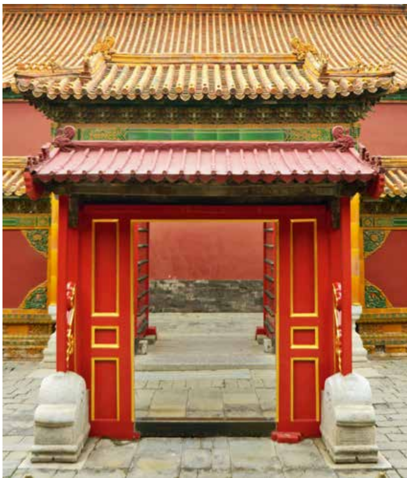
永和宫门内屏门式木影壁（北向南）