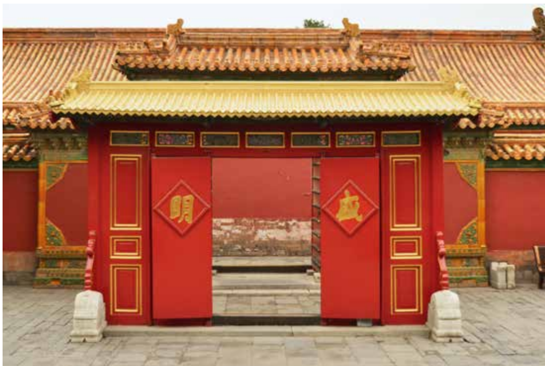
翊坤宫门内屏门式木影壁（北向南）