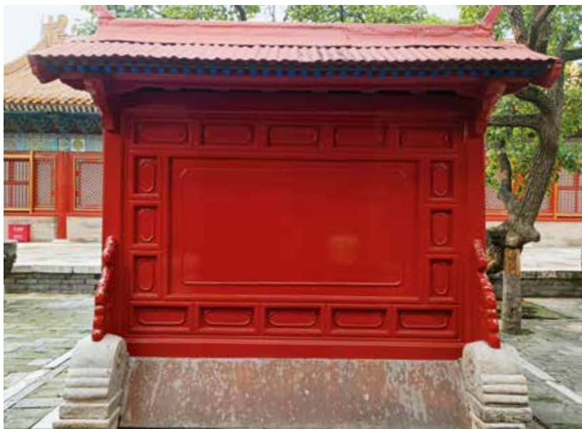
承乾宫门内屏风式木影壁（南向北）