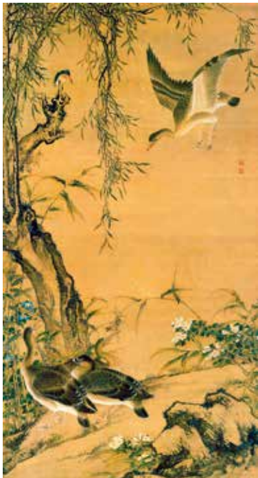
图7 清 沈铨 柳树芦雁图轴 绢本