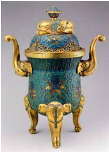
图8 清 锤胎七宝象耳三足香炉