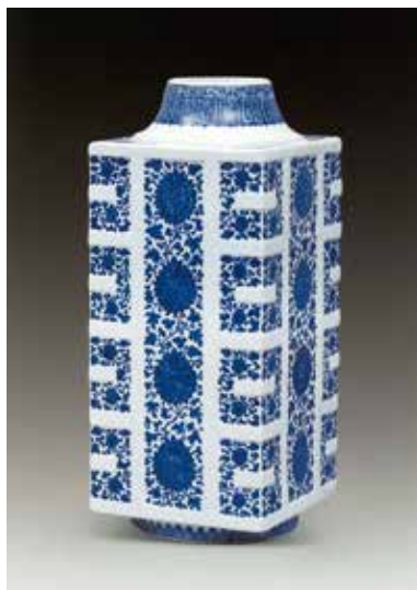
图4 清乾隆 青花串枝莲纹琮式瓶