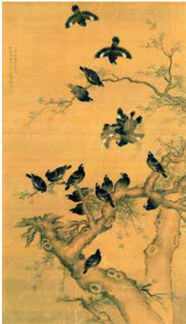
图6 清 戴恒 春柳八哥图轴 绢本

首先要防止有害气体、潮气、阳光辐射的侵害。可用桃胶黏合的无酸纸袋分装底片，用专业做幻灯片的幻灯框将反转片做成幻灯片等方法保管。有条件的可用低温、低湿、密封、冷冻的方法将底片、反转片保存。对刚冲洗处理好的照片、底片、反转片要及时分类收好，不可长期挂放或散放，防止尘埃对照片档案造成伤