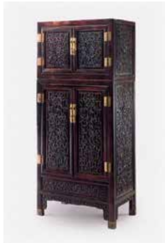
图10 清 紫檀方角小四件炕柜

害;对于已经沾染上的沙粒和尘埃,可用专用软毛刷轻轻掸掉,绝不可用手帕或直接用手去擦。严禁将照片、底片同放在一个袋内保存。因为在受热或受潮条件下,照片和底片容易黏结在一起,造成药膜面损坏等无法弥补的损失。刚冲洗好的照片、底片、反转片要及时分类保存。成卷的、多张的底片和反转片不可紧卷,应几张一组剪开,平放在影集和底片夹、底片本或幻灯片框内。照片装入装具(或影集)内,减少光照,防止变色。底片、反转片应避免卷曲,因为卷曲的底片、反转片不仅易磨损,而且在提供利用时容易被折断、划伤。