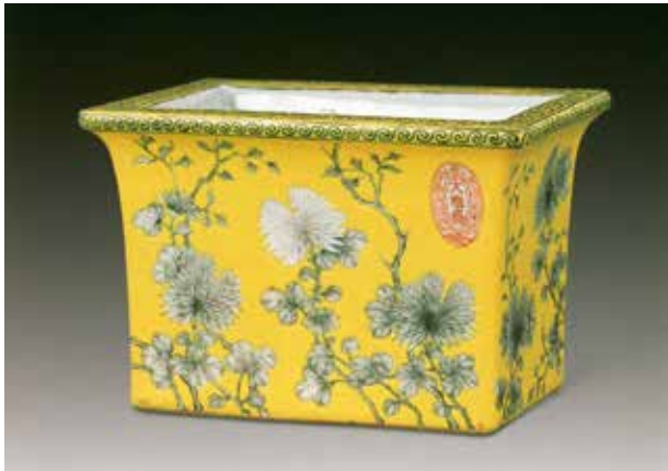
图5 清 黄地墨彩菊花纹长方花盆

同的光线投射方向对塑造文物有不同的作用。一般来说，顺光平而无明暗，多作总体照明和辅助光用；侧光长于描绘器物各侧面的明暗反差，并可隔离器物与背景，增强画面的纵深感；逆光用于勾勒器物的轮廓线，有突出立体感的特殊作用；顶光作用于器物顶部和腰部造型复杂的器物；底光具有渲染人物、动物类器形威严凶狠的感情色彩。光的强弱应依不同文物的需要而异，光的主次也只能伴随器物的造型各部位的主次关系而分别安排。阴影会使被摄主体产生立体感和空间感。构图时强调利用影子