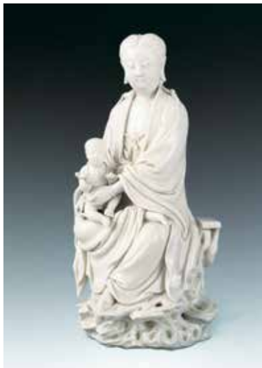
图1 明 坐岩送子观音像（何朝宗款）

灯的数量最少选择四只，即顶灯、主灯、辅灯和背景灯。各个灯的输出要根据具体拍摄的文物，产生一定的光比，完美表现文物。拍摄文物时摄影师可以按自己的需要随意安排光线的投射方向及光的强弱。不