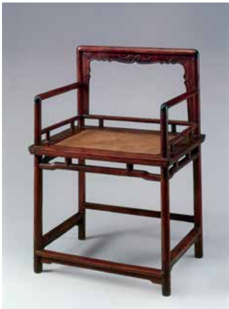
图 11 明 黄花梨玫瑰椅子

对数字图像的保护包括数据备份和数据迁移等。数据备份即是对重要的数据资料备份下来，生成一个备份文件放在安全的存储空间内，当重要的数据丢失、误删或被病毒破坏时，将其恢复到做数据备份时的状态。应当将文物数字照片全部进行备份，以防造成不可挽回的损失。存储载体是存贮数字信息资源的实体或记录信息的材料，数字信息资源的保存质量与其依附的存储载体密切相关。不论存储载体保存的条件如何完备，也只是延长其使用期限，所以要注意存储设备的存储寿命，以便更好地做好文物底片、照片的存储和保护工作。