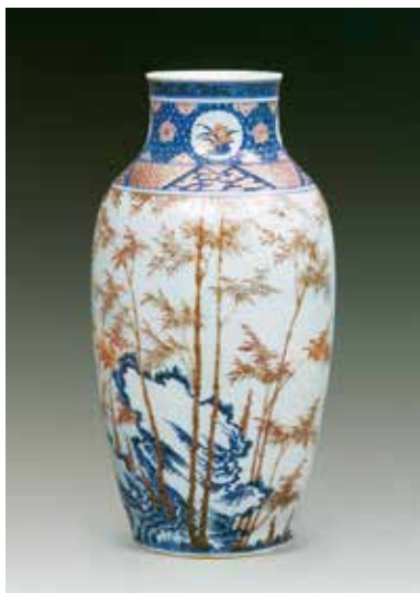
图3 清 乾隆青花釉里红竹石纹瓶