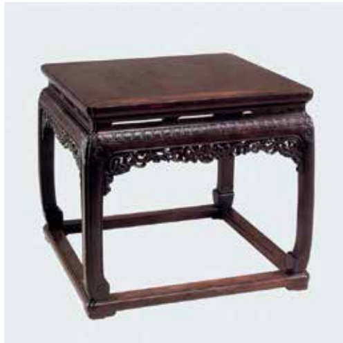
图9 清 紫檀高束腰有托泥雕卷草纹大方凳