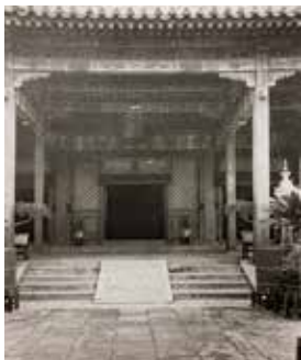
图9 养心殿抱厦内摆放的松桩盆景、盆兰