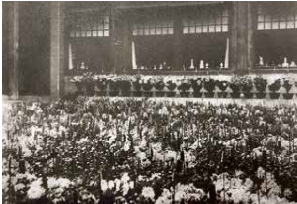
图6 养心殿庭院摆放的标本菊、多头菊