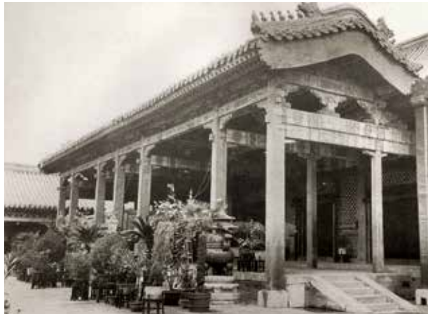
图5 养心殿庭院摆放的盆植：柏树、苏铁、棕树等

红白二种，花单瓣，结实如碗子大，味甘，曰“软子石榴。” 1 可见清时养心殿台阶旁摆放盆石榴，观赏兼食用。