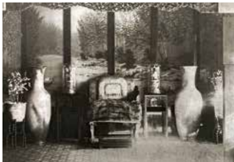
图10 养心殿东暖阁内花架上摆放的盆梅盆景、盆兰