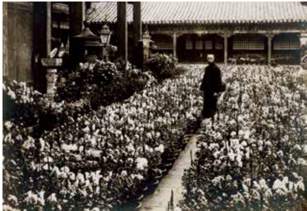
图7 养心殿庭院摆放的标本菊、“十样锦”

列庭榭中者次之，余持论则反是。” 1 虽然时尚流行将盆景摆放在几案上，但由于庭院通风且阳光充足，摆放于庭院更有利于盆景（即盆玩）的生长，乾隆时期亦将盆植（含盆景）摆放于养心殿的庭院：“庭除列盆植，更喜爽风拂。” 2 可见在庭院中摆放盆植（含盆景）、盆花的历史自清早期一直延续到清晚期。另外，庭院内亦摆放应季盆花，例如菊花，清代菊花栽培形式多样化，而清宫中菊花培育仍具规模，具有一定的养殖技艺，据《最后的皇朝——故宫珍藏世纪旧影·宫殿》所载溥仪在养心殿院内照片可见：养心殿院中、廊下摆满菊花，约几百乃至千盆，花型多样，高低排列，以供赏玩，可以辨认当时宫中不仅可培育出标本菊、多头菊〔图6〕，而且可培植出利用嫁接技术才能养殖出的“十样锦”〔图7〕，由此可知清宫拥有高超的园艺栽培技术。而如此盛大的菊花品赏形式，文震亨品评“好事家必取数百本，五色相间，高下次列以供赏玩，此以夸富贵容则可” 3 ，这种赏菊形式虽不被文人推崇，但是彰显了清宫赏花的富贵与豪气。《故宫藏影——西洋镜里的宫廷人物》中还有溥仪在养心殿院内与石榴、月季及夹竹桃的合影〔图8〕，拍摄于1922～1924年，照片里四盆置于花架上的盆花辨认为月季的原因为：最右边的盆花可见奇数羽状复叶，最左边那盆里开的两朵花型像月季，盆花的枝条像月季，由于怕倾倒两两盆花之间用横向及竖立的竹竿连接。月季自乾嘉时期就是清宫品赏的花卉，月季又名长春花，是我国传统名花，圆明园四十景之一的长春仙馆就植此花，嘉庆帝有《咏长春花》：“长春花发长春馆，御赐嘉名卉谱添。” 4 的诗文，其注释有“即月季花，御赐今名”，可见长春花作为清宫花卉的悠久历史。而石榴、夹竹桃清代也是庭院中品赏的花木，《燕京岁时记》载：“京师五月榴花正开，鲜明照眼。凡居人等往往与夹竹桃罗列中庭，以为清玩。” 5 表明京师皆以赏石榴与夹竹桃为当时流行风尚，清末皇室也以这两种花木为清玩。