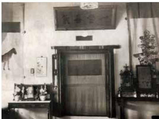
图11 养心殿东暖阁几案上摆放的案头菊