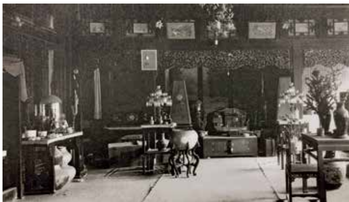
图12 养心殿东暖阁几案上摆放的瓶花

抱厦的旧照片显示：养心殿门两侧及抱厦内的柱子旁摆放松桩盆景、盆兰，两两对称摆放，且盆花、盆景都摆放在花架上〔图9〕。