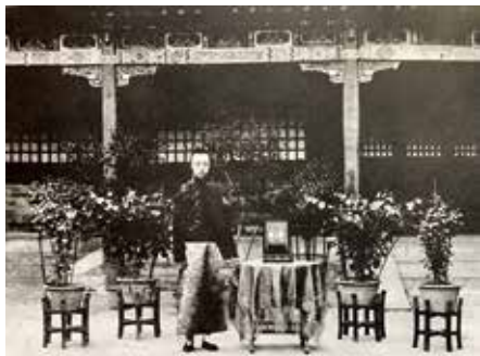
图8 养心殿庭院摆放月季、石榴、夹竹桃