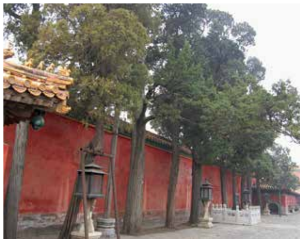
图2 养心门外院落古柏