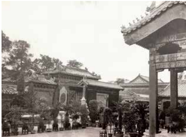
图4 养心殿庭院的排列整齐的盆植：夹竹桃、棕树等