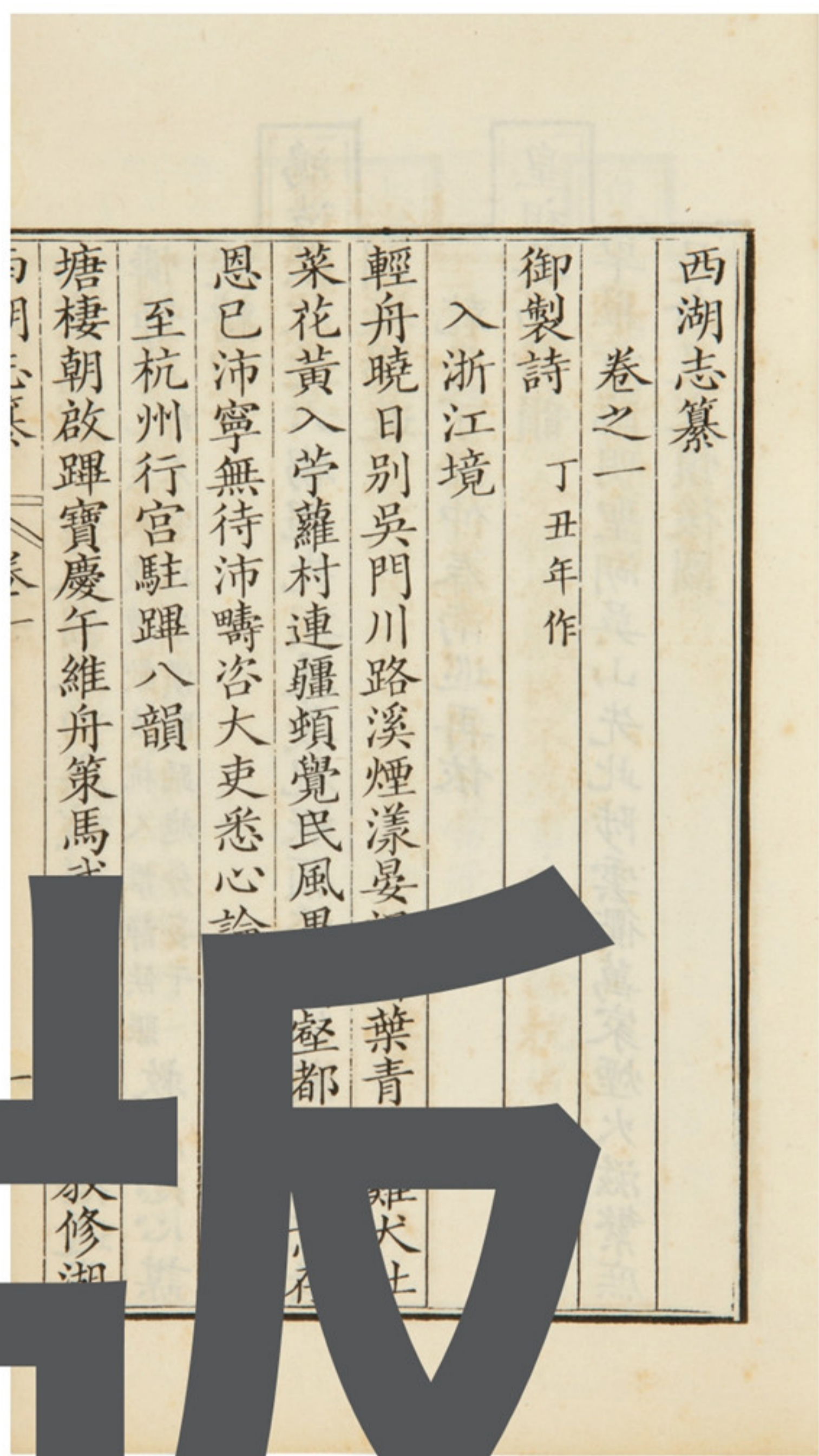
《西湖志纂》内页