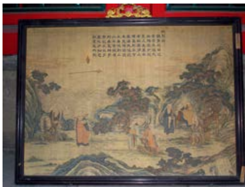
图 42 养和精舍供奉的《缙丝应真飞锡图》挂屏