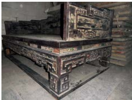
图10 颐和轩明间紫檀木嵌玉宝座

因此太上皇宫里面充斥着不同形制的宝座，几乎所有的宫殿明间均设宝座，重要的宫殿则设地平即矮须弥座，特别是中路一线上的宫殿明间均设地平、宝座、屏风、掐丝珐琅角端、掐丝珐琅龙挂香筒等高等级陈设〔图9〕，档案记载：