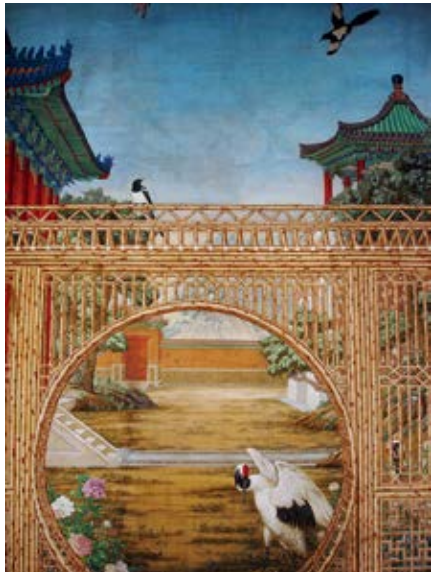
图 23 倦勤斋通景画局部——双喜临门

（乾隆四十二年六月十六日）接得郎中图明阿押贴一件，内开六月十三日太监常宁传旨：宁寿