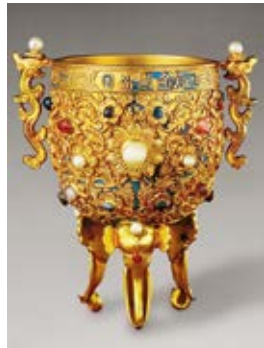
图 14 金瓯永固杯