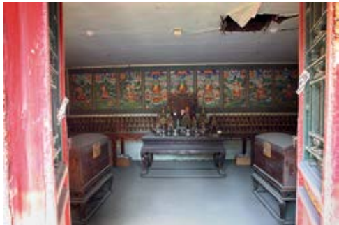
图 47 佛日楼楼上供奉

各室与西一室的供奉相同，只是塔的样式和唐卡所绘神不同：西二室为无上阳体根本品，唐卡所绘主神为六臂勇保护法，八位伴神为护国护法、尊亲护法、宜帝护法、大黑雄威护法、柔善法帝护法、增盛法帝护法、权德法帝护法、雄威法帝护法。