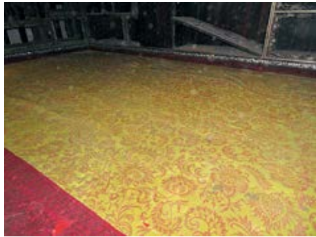
图 56 景祺阁面西紫檀木描金漆多宝格宝座床上所铺狸狸毡

乐寿堂楼上东北间床罩内南墙画斗一张、乐寿堂东间寝官东墙横披一张、乐寿堂后层西里间南