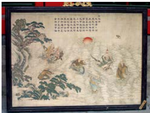
图 43 养和精舍供奉的《缙丝应真渡海图》挂屏

颐和轩东暖阁是一座“凹”字形仙楼佛堂〔图 35〕，西板墙上嵌西方极乐世界壁屏，画中有三座宫殿庄严，中间宫殿玻璃龕中供奉文殊菩萨〔图 36〕，两侧宫殿玻璃龕中供奉阿弥陀佛和不动佛，西方极乐世界的主尊应是阿弥陀佛，在这里却变成了文殊菩萨，阿弥陀佛和不动佛仿佛成了文殊菩萨的两位胁侍菩萨，为何文殊菩萨地位如此之高呢？原来这与乾隆皇帝有关系，《章嘉国师若必多吉传》称 1 ：“从了义上讲，大皇帝（按：乾隆皇帝）是文殊菩萨的转世，从不了义上讲，在徒众看来他是转大力法转的君王。”六世班禅于乾隆四十五年进京觐见乾隆皇帝，在乾隆皇帝座前叩拜称：“天神文殊菩萨大皇帝对小佛向来格外宠渥优施，对此日益深加之鸿恩，小佛永世难报。……有幸瞻覲天颜，正值无比欣悦之际，又赏赐闪烁神力光辉之珍贵缎子垫褥。” 2