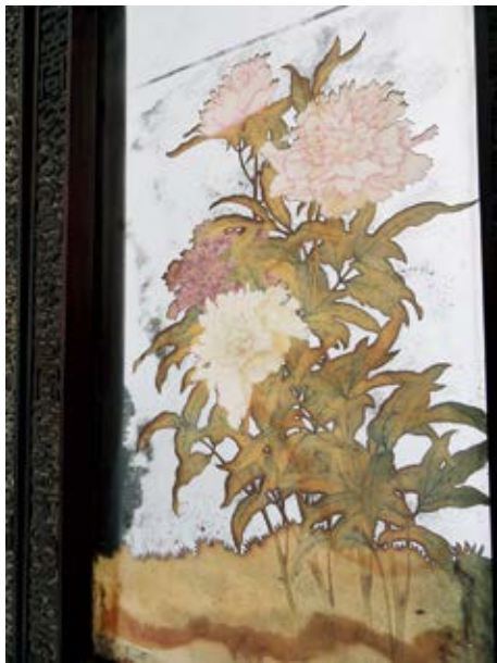
图 19 乐寿堂屏风上的四季花卉——芍药