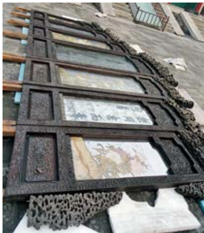
图17 乐寿堂明间紫檀木嵌玻璃《题乐寿堂》诗七屏风