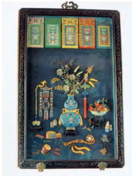
图 58 紫檀框嵌牙骨珐琅大吉葫芦五福春屏彩胜

养性殿、乐寿堂等处宝座上俱铺猩猩毡，沿边镶石青缎边，钦此。计开：养性殿东暖阁面西宝