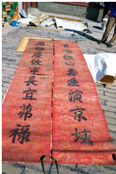
图4 宁寿宫东暖阁东间东门对联