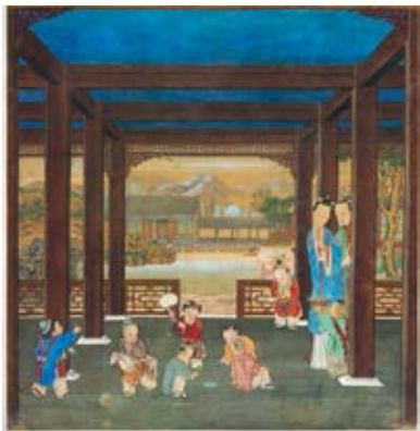
图 26 养和精舍明间婴戏线法画