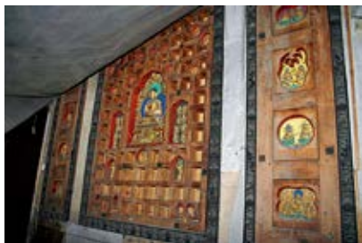
图 45 养性殿西暖阁仙楼佛堂紫檀木八方塔