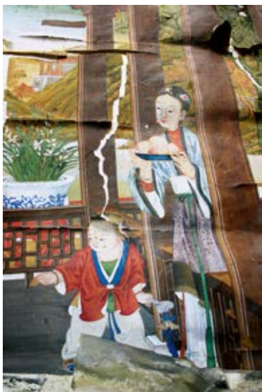
图 30 婴戏犬线法画局部——宫女献桃