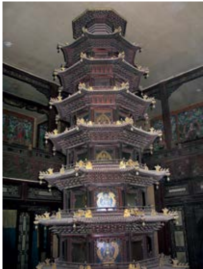
图 44 抑斋西方极乐世界擦擦佛挂屏龕

梵华楼位于宁寿宫东北角，为卷棚顶二层楼，面阔 7 间，进深 1 间，除明间外，其它各间均开天井，上下层相通。楼下明间供奉从圣安寺请来的铜旃檀佛立像一尊〔图 39〕，北东西三面墙上挂供 3 幅释迦源流唐卡。明间东西各三室，西一室为般若品，正中供藏式塔一座，塔顶开天井，与二层相通，塔周围的北东西壁沿墙设长供案，上供珓琅八供养，三壁上均挂通壁护法法唐卡，每幅唐卡绘三位护法神，以北壁正中者为主神，左右八位为伴神。主神为白勇保护法，八位伴神为持国天王、增长天王、广目天王、财宝天王、梵王、帝释、难陀龙王、优波难陀龙王。其他