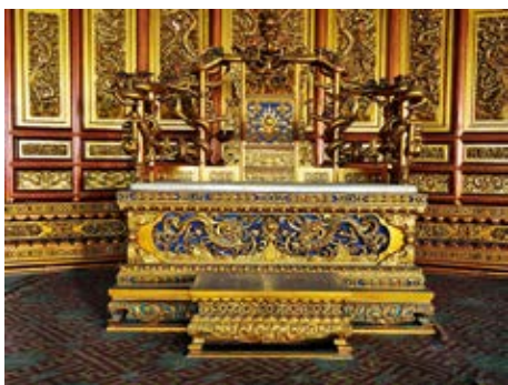
图8 皇极殿髹金漆蟠龙宝座