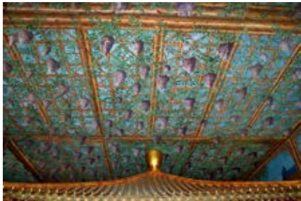
图 22 倦勤斋通景画局部——天顶藤萝架

屏风上所绘四季花卉是牡丹、芍药、菊花和山茶花，所题御制诗为《题乐寿堂》〔图 21〕，诗曰：“寄兴由来在山水（向以万寿山背山临水，因名其堂曰乐寿，屡有诗，后得董其昌论古帖，知宋高宗内禅后，有乐寿老人之称，喜其不约而同，因以名宁寿宫，书堂以待倦勤后居之），绍兴先我篆题铭。因名宝额待他日，冀叶贞符娱曼龄。忧则付人乐则寿，存吾顺事没吾宁（用张子西铭语）。廿年屈指居斯俟，恩许之乎赖昊灵。”说明名乐寿堂的缘由，特别是屏风上的御笔对联“乐同乐而寿同寿”句，与《宁寿宫铭》“寿同黔黎”