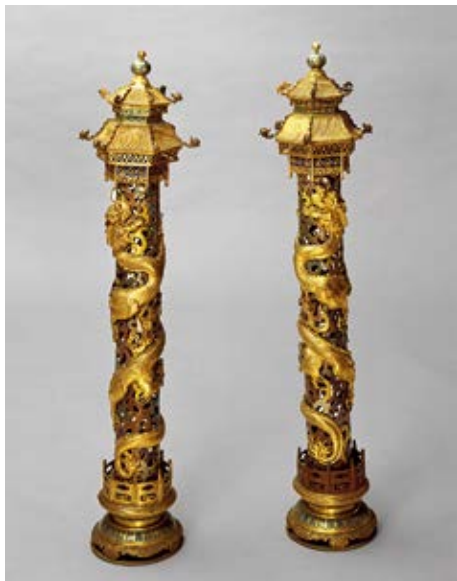
图9 铜胎掐丝珐琅龙挂香筒