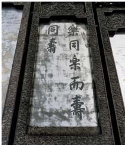
图18 乐寿堂屏风上的对联