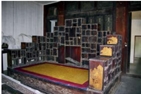
图 48 景祺阁东次间紫檀木描金漆多宝格宝座床

抑斋亦是这种组合供奉，东间隔断上中嵌西方极乐世界擦擦佛挂屏龕〔图 44〕，两侧嵌十八罗汉擦擦佛对联式壁挂龕。隔断对面墙壁上挂供紫檀边画十六应真玻璃挂屏一对即《姚文瀚画罗汉像》挂屏和《赵孟頫画罗汉像》挂屏。档案记载：乾隆四十一年二月初五日，员外郎四德库掌五德来说太监胡世杰