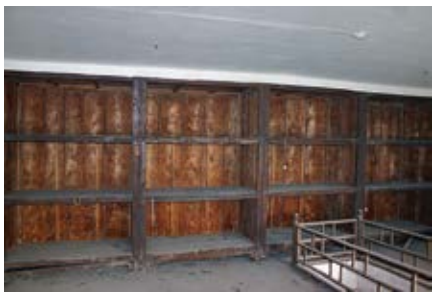
图 50 景祺阁楼上楠木架

着照养心殿西暖阁楼上现供佛像一样镶边成做，在养性殿西暖阁楼上供，钦此。计开：五方佛五张、白勇保护法一张、六臂护法一张、尊胜佛母一张、白伞盖一张、八大菩萨八张、成锁观音一张、如意观音一张、吉祥天母一张、六臂马头金刚一张、四座金刚一张、大威吼声金刚一张、大轮手持金刚一张、金刚亥母一张、无哉佛母一张、持嘎布拉喜金刚一张、威罗瓦一张、智行佛母一张、六面威罗瓦一张、天王四张、秘密不动金刚一轴、坛城三轴、上乐王二轴、一勇威罗瓦一轴、四面勇保护法一轴、四臂勇保护法一轴、白上乐王一轴。 1