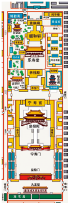
图1 太上皇宮寧壽宮區圖

乾隆太上皇宮的前身，是明代的仁壽宮院，位於東六宮蒼震門東，原為先朝有名封之妃嬪、無名封之宮眷所居養老之處。清康熙時在明外東裕庫、仁壽宮、嘯鸞宮等宮殿的基礎上進行改建，改建後的宮殿區稱為寧壽宮院，以奉養仁憲皇太后。乾隆六旬大壽後，下旨營建太上皇宮，選址於康熙時的寧壽宮院，至乾隆三十七年，開始進行大規模改建，“前部已非舊觀，後部更多改築” 1 。乾隆在《寧壽宮銘》中注稱：“茲新葺寧壽宮，待余歸政後居處，則為太上皇臨御之所。”