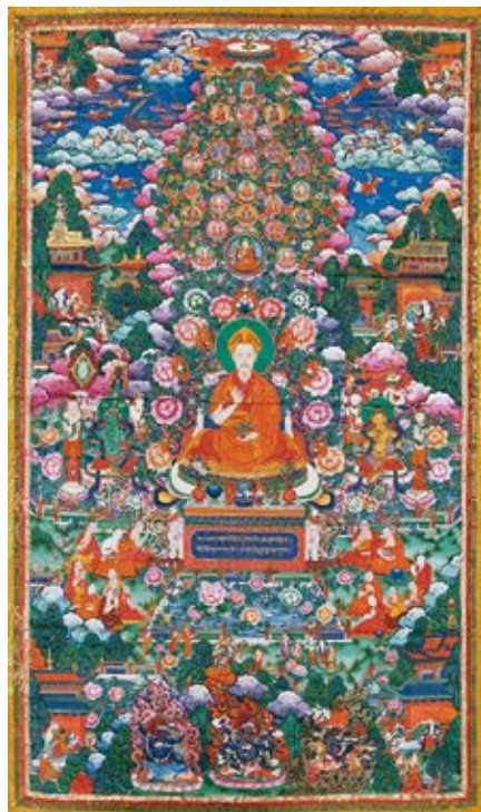
图 37 乾隆皇帝文殊菩萨佛装像