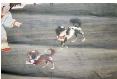
图 29 婴戏犬线法画局部——双犬