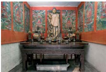
图 39 梵华楼明间

一件，连座通高一丈六寸，奴才等即督同造办处官员前往乾坤清官、宁寿宫等处量其分位大小，详细斟酌以期如式谨拟得：乾清宫西暖阁对如意门陈设，并拟请宁寿宫东暖阁现安玉瓮分位换安，如蒙允准，其玉瓮拟陈设乐寿堂西梢间。再拟得乐寿堂向北现安西洋水法一统万年青分位换安。又拟得颐和轩西次间雕龙柜分中安，设计踏勘得应行陈设地方谨画得地盘纸样五张，一并粘签恭呈御览，伏祈圣主训示遵办，为此谨奏等因。