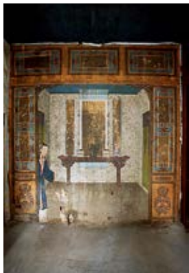
图 27 养和精舍南间花开结子线法画