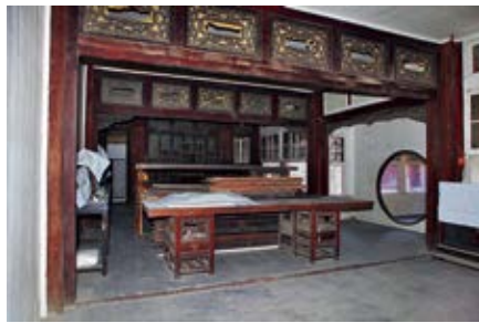
图 60 颐和轩东西墙大案，现存景祺阁

宁寿宫中一路应挂之神，画样呈览，准时发往苏州成做，钦此。于三月初三日库掌五德、福庆拟做：皇极殿：东西暖阁堆仙童门神二副，高三尺，宽一尺九寸。宁寿宫：东西暖阁堆仙童门神一副，高二尺七寸，宽一尺九寸；东门堆帅神一副，高二尺，宽一尺一寸五分。养性殿：东西暖阁堆仙人门神二副，高二尺五寸，宽一尺九寸。景祺阁：阁下堆仙人门神一副，高二尺四寸，宽一尺六寸，共堆做门神七副。宁寿宫：正门画仙女门神一副，高二尺九寸，宽一尺五寸。养性殿：东净房画门神一副，高一尺六寸，宽九寸。乐寿堂、三友轩：前后隔扇画仙女门神二副，高二尺四寸，宽一尺三寸；东净房画门神一副，高一尺六寸，宽九寸。颐和轩：后隔扇画判门神一副，高二尺七寸，宽一尺五寸；楼上下傍门画仙童门神三副，高一尺六寸，宽七寸；楼上正隔扇画仙人门神一副，高一尺七寸，宽九寸；东西廊画门神二副，高一尺九寸，宽九寸。景祺阁：阁上正隔扇画判门神一副，高一尺七寸，宽一尺；穿廊东西隔扇画帅神门神二副，高二尺三寸，宽一尺八寸；阁上东隔扇画仙人门神一副，高一尺七寸，宽一尺三寸；西廊门画门神一副，高一尺八寸，宽一尺二寸；东顺山房画门神一副，高二尺，宽八寸；东净房画门神一副，高二尺，宽八寸；东敞厅画门神二副，高二尺五寸，宽一尺一寸。如亭：南门画门神一副，高一尺五寸，宽六寸。景福宫：景福门画老仙人门神一副，高三尺，宽二尺；屏门画老仙人门神一副，高三尺，宽一尺八寸；前后隔扇画仙童官门神二副，高二尺一寸，宽一尺二寸五分；东顺山房画门神一副，高一尺五寸，宽八寸。梵华楼：正隔扇画帅神门神一副，高二尺一寸，宽一尺三寸；西廊门画判门神一副，高一尺五寸，宽八寸。佛日楼：楼上正隔扇画帅神门神一副，高一尺八寸，宽一尺一寸；楼下正隔扇画老仙人门神一副，高一尺九寸，宽一尺；西净房画门神经一副，高一尺三寸，宽八寸；西廊门画门神一副，高一尺五寸，宽一尺。东廊门画门神一扇，高一尺七寸，宽一尺四寸。旭辉庭：正隔扇画仙人门神一副，高二尺一寸，宽一尺二寸。遂初堂：垂花门画老仙人门神一副，高二尺六寸，宽一尺二寸；屏门画仙官门神一副，高三尺三寸，宽一尺六寸；前后正隔扇画仙童门二副，高二尺，宽一尺二寸；东西配殿画判门神二副，高二尺五寸，宽一尺三寸；东配殿内画仙女门二副，高一尺八寸，宽七寸五分；南门画仙童门神一副，高一尺七寸，宽九寸；东廊门画门神一副，高一尺七寸五分，宽八寸；西净房单画门神一扇，高一尺八寸，宽一尺三寸；后穿堂向东画门神一副，高一尺八寸，宽八寸；向北画门神一副，高一尺七寸，宽一尺二寸。延趣楼：楼上隔扇画仙人门神一副，高一尺九寸，宽一尺二寸；楼下隔扇画