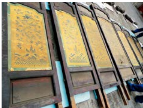
图 20 乐寿堂明间紫檀木嵌玻璃《题乐寿堂》诗七屏风背面

仍享有元旦开笔之典礼，其陈设金瓯永固杯〔图 14〕和《万国来朝图》〔图 15〕，特别是《万国来朝图》将前朝三大殿场景改绘为太上皇宫宁寿宫场景，说明万国来朝的实现与太上皇不可分割的关系，目的是归政后可继续赐天下苍生福，祈江山永固，万国来朝。