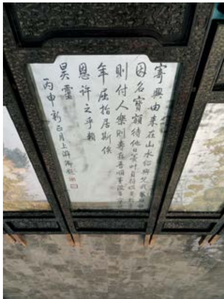
图 21 乐寿堂屏风中扇《题为乐寿堂》诗

着查系何处屏风上起下，查明回奏，钦此。随查得缙丝屏风小七张系四十年五月间宁寿宫乐寿堂明殿七屏风上安玻璃换下交如意馆有用处用等情交太监鄂勒里口奏，奉旨：着在圆明园查有合尺寸屏风上贴，钦此。随查得淳化轩七屏风一座，拟将缙丝片七张贴在后背，交太监鄂勒里口奏，奉旨：准在屏风背后贴如缙丝片穿小周围镶边，钦此。随将缙丝屏心七张在淳化轩七屏风背后比较宽合式高里下缙线片短二寸，难以镶边，请将屏风背后板上用木补做，贴得纸样持进交太监鄂勒里呈览，奉旨：准照样用木补做，钦此。于二十四日员外郎五德知来说太监厄勒里传旨：将缙丝屏风心七张不必在淳化轩屏风上贴，仍在乐寿堂七屏风上背后贴〔图 20〕，钦此。 2