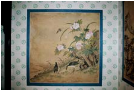
图 51 倦勤斋西间墙上黄念画花鸟画斗