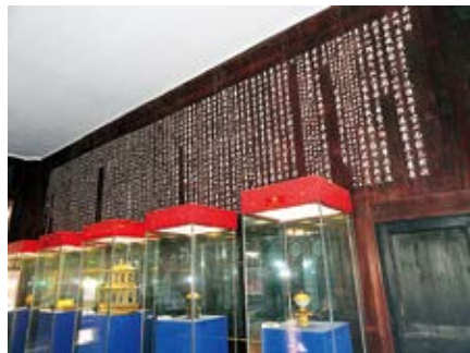
图 31 颐和轩明间东西板墙所刻御制诗文

倦勤斋西三间通景画描绘的是藤萝〔图 22〕，天顶上所绘架上爬满藤萝，枝繁叶茂，花开朵朵。西壁描绘的是一座高大的山峰，北壁描绘的是一座金碧辉煌的宫殿，殿前绘制的竹篱笆墙与真实的竹篱笆墙相连，竹篱笆墙上的月亮门与对面真实的竹篱笆月亮门相对，一真一幻，在幻景的月亮门里盛开着牡丹花和一只展翅起舞的白鹤，一只喜鹊正朝月亮门飞来，另一只喜鹊停在篱笆墙上。倦勤斋西三间藤萝架通景画主题由两部分组成，并以乾隆的御制诗句点明。第一部分是藤萝花，寓意花开后就会结子，象征子孙万代。第二部分是一对喜鹊飞临竹篱笆月亮门，门内有仙鹤和牡丹花，象征双喜临门〔图 23〕，牡丹象征富贵，仙鹤象征长寿，