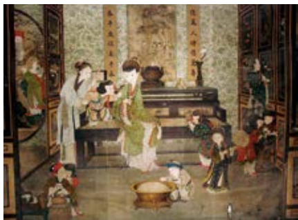
图 25 玉粹轩明间岁朝婴戏通景画