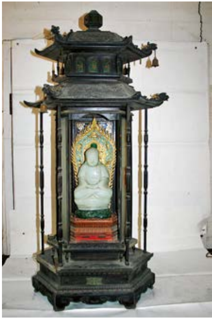
图 38 供青玉阿弥陀佛紫檀木亭式龕