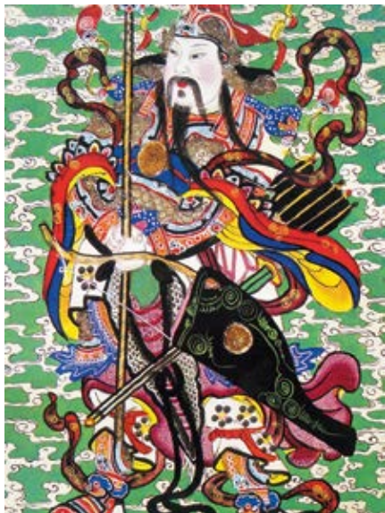
图 57 清宫门神画像

北窗画对一副，着方琮画。乐寿堂后层西北间罩内南墙格顶上横披一张、乐寿堂中层西北间罩外北墙方窗两边画条一张、楼上西南间外间西墙通景大画一张、楼上西间西墙横披一张、养性殿西南间北墙通景大画一张，着袁英画。乐寿堂楼上西间罩内北墙西边门上画条一张，着程志道画。乐寿堂楼上东间东墙柜顶上画斗一张、乐寿堂后层夹道东梢间外南墙东边门上画条一张、乐寿堂楼上东北间床罩内西墙画一张、乐寿堂楼上西里间南间西罩南墙画一张，着周本画。 1