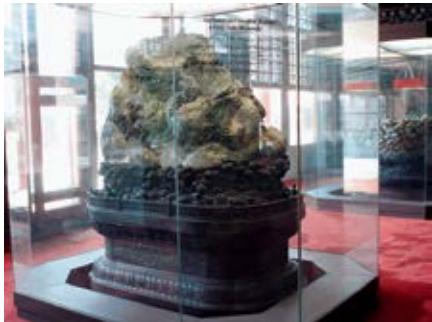
图 33 乐寿堂明间丹台春晓玉山