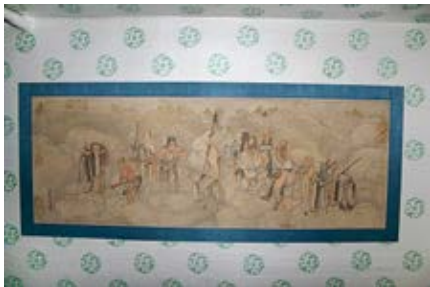
图 52 倦勤斋明间宝座床西墙顶格上顾铨画罗汉图