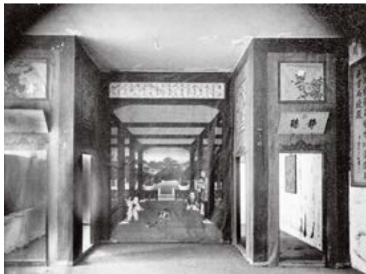
图 28 景祺阁西梢间戏台婴戏犬线法画老照片