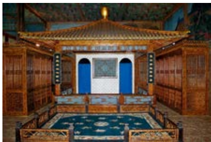
图 24 倦勤斋戏台挂对