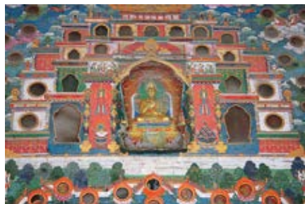
图 36 颐和轩西方极乐世界壁屏中的文殊菩萨