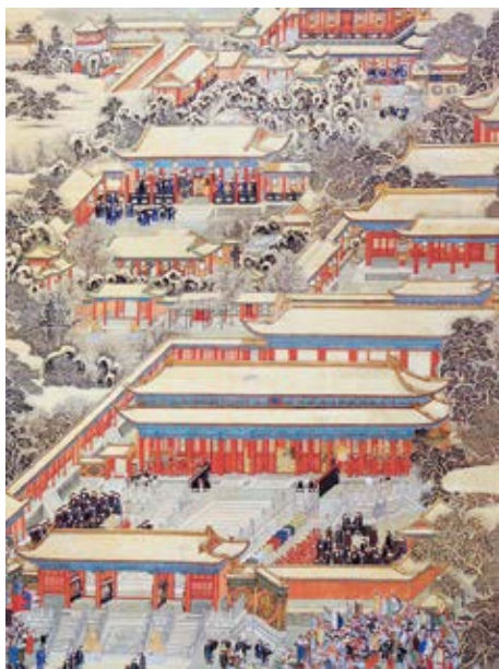
图 15 养性殿东暖阁明窗《万国来朝》图