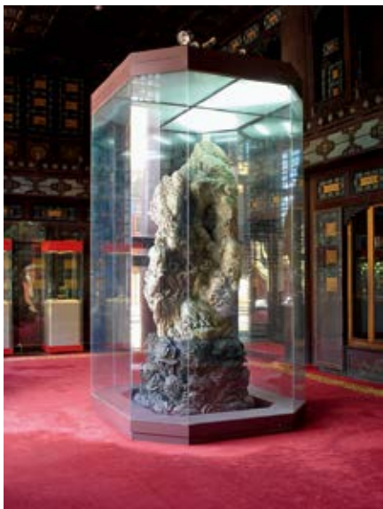
图 34 乐寿堂北厅大禹治水图玉山