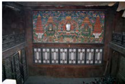
图 35 颐和轩东暖阁仙楼佛堂

乾隆五十二年四月二十六日，笔帖式福海来说将两淮送到大禹开山木样一座，安在奉三无私呈览，奉旨：着交舒文、伊龄阿看地方安设，其现做大玉山子俟送到时亦交舒文伊龄阿在乾清宫、宁寿宫看准地方奏明再安，钦此。于四月 日将大禹开山木样一座安设在淡泊宁静讫。于八月二十五日员外郎同德等交来折片一件内开奴才伊龄阿、舒文谨奏为奏闻请旨事，本年四月二十六日奉旨两淮现做大禹开山俟送到时交伊龄阿、舒文在乾清宫、宁寿宫看准地方奏明安设，钦此。今据两淮盐政徵瑞于八月十六日送到大禹开山陈设