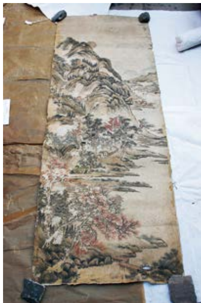
图 54 宁寿宫东暖阁魏鹤画山水图