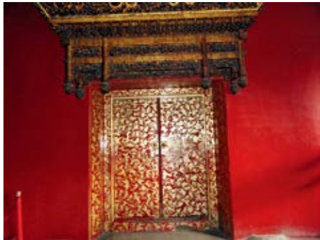
图 13 养性殿东暖阁红漆描金云蝠纹门