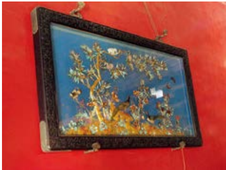
图 55 养性殿明间紫檀木框玻璃嵌石树泥金雉鸡挂屏

内装二等有款瓷器三百九十二件。丁字格式，内装二等有款瓷器六十一件，二等无款瓷器三百二十九件。戊字格式，内装二等无款瓷器四百三十九件。己字格式，内装三等有款瓷器四百五十件。庚字格式，内装三等有款瓷器四百七十七件。辛字格式，内装三等有款瓷器三百七十二件。壬字格式，内装三等有款瓷器七十件，三等无款瓷器一百八十七件。癸字格式，内装三等无款瓷器三百十三件。以上格子十座，共装有款无款瓷器三千四百七十九件。余剩瓷器四十一件。于乾隆四十四年十月十八日，将瓷器三千五百件分晰年款，按依