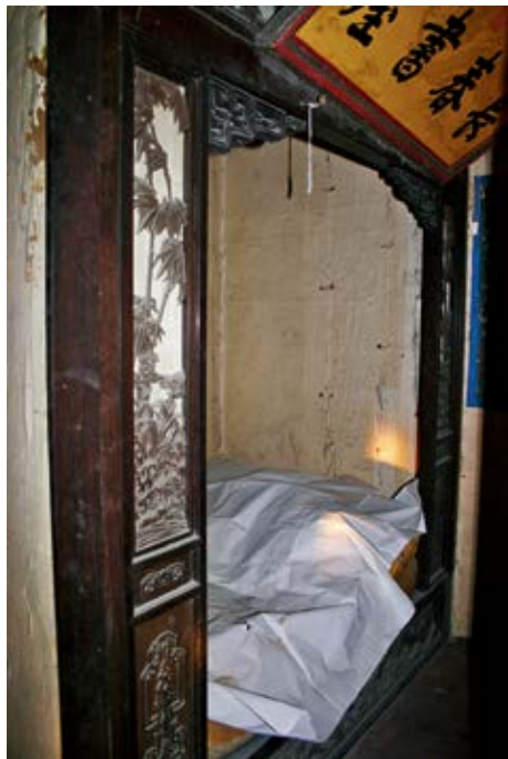
图 11 养性殿长春书屋宝座床

二尺三寸。西间栏杆床长九尺二寸五分，宽三尺一寸。后宝座床长七尺三寸五分，宽四尺二寸五分。东梢间面南床长七尺八寸，宽六尺。楼上面西床长六尺七寸，宽三尺三寸五分。西暖阁勤政床长七尺五寸，宽五尺四寸五分。三希堂床长六尺五寸九分，宽三尺五寸，矮床长七尺二寸五分，宽三尺七寸五分。楼下宝座床高七尺九寸五分，宽五尺一寸五分。长春书屋高床长五尺六寸，宽三尺九寸五分〔图 11〕。矮床长五尺六寸，宽三尺二寸。面西宝座长三尺二寸，宽二尺四寸。无倦斋床长四尺九寸，宽三尺六寸。乐寿堂：明殿正宝座长三尺六寸，宽二尺八寸。西暖阁面东宝座长三尺二寸，宽二尺二寸。东暖阁大宝座长一丈二尺，宽七尺一寸。里间面南宝座长七尺七寸，宽五尺一寸。东次间面南宝座长六尺六寸，宽四尺一寸。东次间面北宝座长六尺六寸，宽三尺六寸。后宝座长一丈三尺九寸，宽五尺八寸。楼下面东宝座长九尺八寸，宽五尺五寸。西次间面西宝座长九尺八寸，宽五尺。面东宝座长三尺五寸，宽二尺二寸五分。面北宝座长六尺二寸，宽三尺一寸。西次间高床长一丈一尺九寸，宽五尺二寸。矮床长一丈二尺二寸，宽二尺二寸五分。西梢间面南宝座长六尺七寸，宽五尺五寸。后面宝座长九尺二寸，宽六尺七寸。元光门高床长九尺四寸，宽三尺九寸。楼上西梢间面北高床长一丈一尺九寸，宽五尺一寸五分。矮床长一丈一尺九寸，宽五尺二寸。面东宝座长一丈三尺九寸，宽四尺四寸。正宝座长七尺一寸，宽三尺。西北宝座长三尺二寸，宽三尺三寸五分。西次间面北宝座长六尺五寸，宽三尺五寸。西次间面南宝座长六尺三寸，宽三尺五寸五分。楼上面北宝座长二尺八寸，宽二尺一寸。东梢间面北床长一丈一尺九寸，宽五尺二寸。面西宝座长七尺七寸，宽二尺七寸。东次间面北宝座长六尺五寸，宽三尺九寸五分。共宝座床毡四十五块，挑得内库黄地红花猩猩毡七板红地黑花猩猩二板，石青小卷缎十匹，持进交太监胡世杰呈鉴，奉旨：准用，钦此。 1