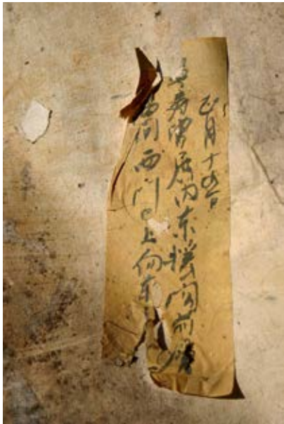
图5 《宁寿宫铭》黄签题记