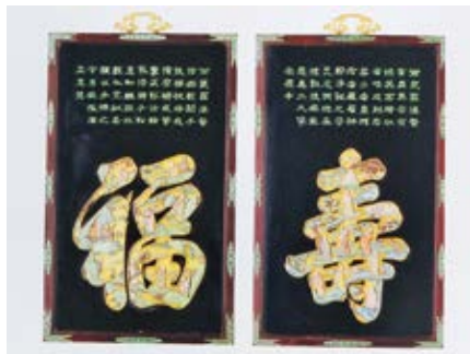
图 59 紫檀木框嵌牙罗汉福寿字春屏彩胜