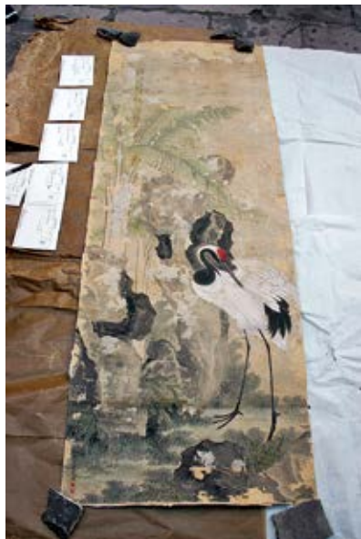
图 53 宁寿宫东暖阁杨大章画花卉图

宁寿宫景祺阁殿内照咸福宫现安装瓷器格子一样，成做楠木格子十件，钦此。于四十一年八月初二日将交出头等有款瓷器一百十五件，头等无款瓷器二百七十四件，二等有款瓷器四百五十三件，二等无款瓷器七百六十八件，三等有款瓷器一千三百六十九件，三等无款瓷器五百十九件，有款无等瓷器十件，无款无等瓷器十二件，通共有款无款瓷器三千五百二十件，画得瓷器格子纸样十张。内将甲字格式，内装头等有款瓷器一百十五件，头等无款瓷器六十四件。乙字格式，内装头等无款瓷器二百十件。丙字格式，