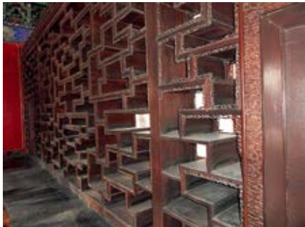
图 49 养性殿明间聚珍格