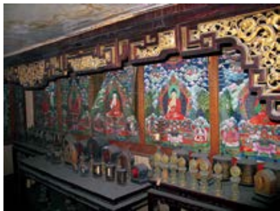
图 46 养性殿西暖阁仙楼佛堂楼上的五方佛画像