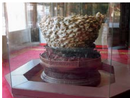
图 32 乐寿堂明间雕云龙玉瓮