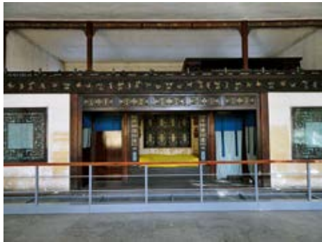
图 12 养性殿东暖阁仙楼的云蝠装修