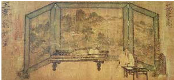
图3 南唐王齐翰的《勘书图》卷 南京大学藏

唐末至五代，地方割据势力造成了国家分裂，大半个中国处在乱政之中，为获得政治权利和经济利益，