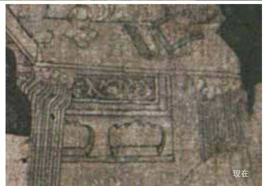
图 14 屏风中人物活动的三个时间状态

单一情节是：王昌龄和他的诗友们正在寻诗觅句，书童们忙着磨墨和准备文具。大案子上摆放着砚台等书写工具，联想情节均为未来要发生的两件事情：一、诸位文人完成诗句的构思之后，会依次在这个大案上书写出来；二、画幅左侧石凳上，依旧放着一笼点心，意味着众雅士们书写完毕后，照例会在这里小酌一场。画中只表现出一个情节，但预告了未来书写诗句、休憩小酌等两个情节，使得画面的欣赏内容丰富了起来〔图 15〕。在独幅画中体现一连串情节故事的构思，