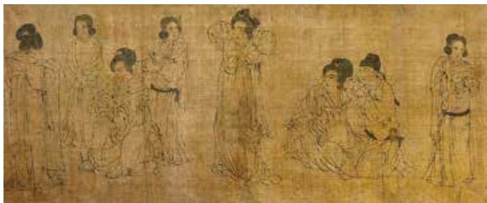
图10 周文矩《宫中图》卷（部分） 宋摹本，分藏于美国克利夫兰美术馆、大都会博物馆和福格美术馆藏

友善。唯有李璟手执记谱册 2 ，目视前方，若有所思。看得出来，他对棋局是十分满意的，他担心的是这种气氛能持续多久。画家把皇室活动描绘成生动有趣的文人雅集。画的左侧画一小身侍从，衬托出主要人物硕大的体态。他们身后有一屏风，画唐代诗人白居易《偶眠》的诗意：“放杯书案上，枕臂火炉前。老爱寻思事，慵多取次眠。妻教卸乌帽，婢与展青毡。便是屏风样，何劳古画贤。”其意在于追求淡泊、闲适的生活，正切合该图的主题。屏画中又画一座三折屏风，上画三幅山水，故此图得名为“重屏”〔图9〕。