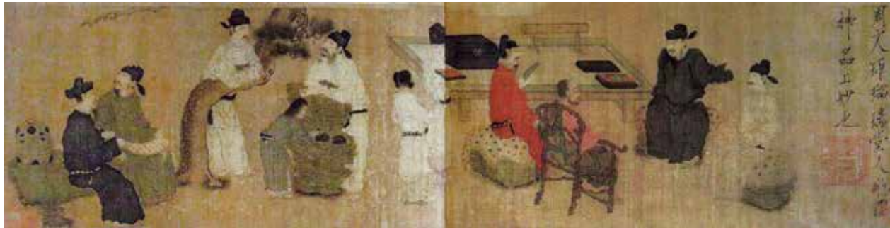
图 15 五代周文矩《琉璃堂人物图》(局部) 故宫博物院藏

也是南唐的其他人物画家孜孜以求的，大多用于描绘文人们的高雅生活。如王齐翰的《勘书图》卷所表现的单一情节是主人公在书房里即挑耳；联想情节是此前他曾在此摆弄过乐器，然后校勘书籍，表现了文人雅士一系列惬意的读书生活。又如卫贤《高士图》卷，画孟光“举案齐眉”的情景，在此之前，梁鸿已经伏案多时了〔图 16〕。这种刻意表现人物在室内连续性活动的时序，是非常注重描绘一连串道具和生活细节，否则观者难以感觉到人物在室内活动的连续性。不妨说，这是兴起于南唐的人物画坛的新时尚，周文矩是推动这个时尚的核心画家，也是表现时间和空间的最佳能手。