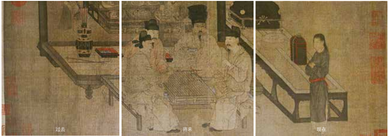
图 13 画面人物活动的三个时间状态分解图