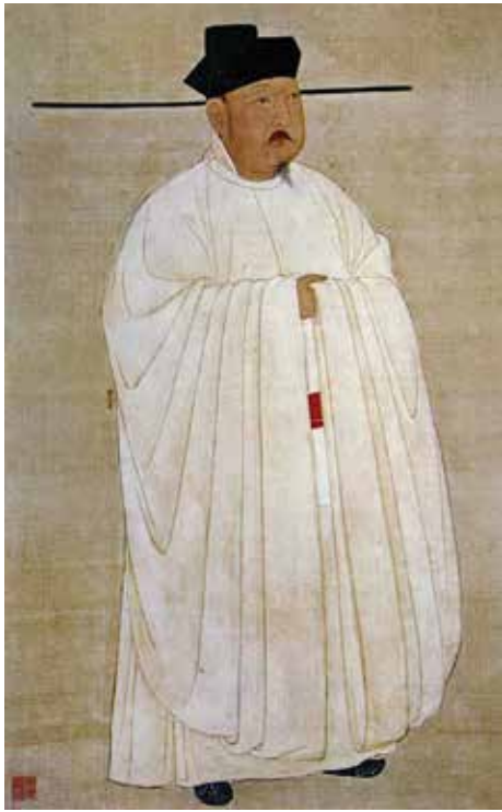
图8 北宋佚名《宋太宗像》轴 台北故宫博物院藏

宁年间被一位法号叫文莹的僧人详细地写进了《续湘山野录》里，这不仅否认了赵光义继位的合法性，而且给一个个后继者蒙上了阴影……因为自宋太宗起，皇位的继承权被赵光义这一脉把握着，直到南宋绍兴三十二年（1162年），宋太祖七世孙、秀王子偁之子赵昚（1127～1194年）登基，庙号孝宗，皇位继承权才回到了赵匡胤这一脉。《重屏会棋图》卷中的政治含义对宋太宗这一支来说实在是太重要了，如果推断的话，摹制该图的时间很可能是宋太宗赵光义朝以后，以此证实赵光义继承兄位、承嗣天下的历史依据，他们通过摹者之手用艺术的手段继续营造平和的政治气氛。另外，宋太宗还是北宋棋坛的名手，他“留意艺文，而琴棋亦皆造极品。” 1 《宋史·艺文志六》记有《太宗棋图》一卷（今佚）。太宗极为关注他执政之初棋坛的棋德、棋风和棋道，以求重振棋风。摹本是否直接与他有关，尚难得知，但可以确信，凭赵光义的个人兴趣，一定会留意周文矩的《重屏会棋图》卷。