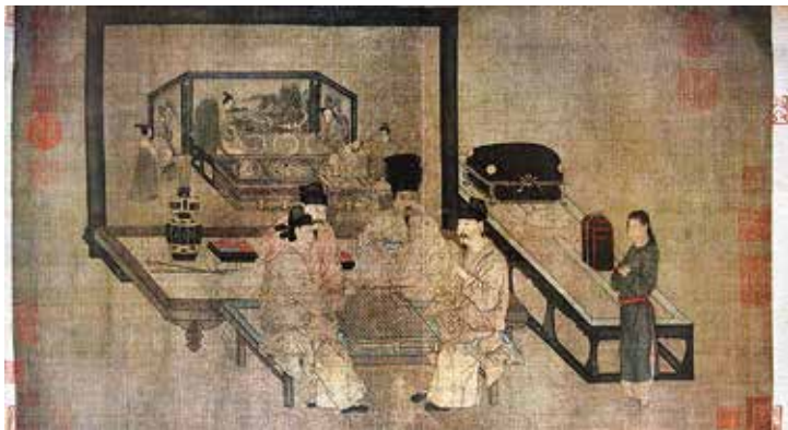
图1 五代南唐周文矩《重屏会棋图》卷 绢本设色 纵40.3厘米 横70.5厘米 故宫博物院藏

《重屏会棋图》卷[图1]本无作者名款，其后有明代沈度、文徵明的跋文，《石渠宝笈初编》著录为五代南唐周文矩真迹。在上个世纪八十年代以前，它一直被作为周文矩的真迹。本文拟就该图的原作者周文矩与原图创作时间进行考辨，并对南唐宫廷与皇室传位、北宋摹本与政治背景以及该图的艺术特性等问题展开讨论。