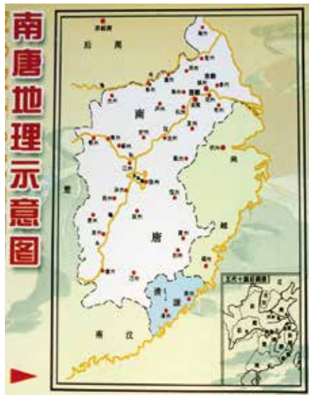
图 5-1 《南唐地理示意图》 南京南唐二陵博物馆制