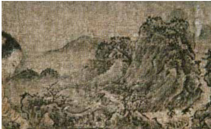
图 12 屏中屏上绘制的理想隐居地

出：“画家有意混淆视觉、迷惑观者，引诱他相信画中屏风里的家居景象是画中描绘的真实世界的一部分。” 1 这的确是画家扩大画面空间的手段，画家的构思何在？笔者以为，周文矩是想将现实生活中的景象通过家具的一条条看不见的透视线导向古代生活，特别是棋盘格上的线条直接导向屏风画，即白居易所描绘的《偶眠》诗意：卸了“乌帽”后，享受着没有任何纷争、唯有恬淡静谧的家庭生活。李璟早年在庐山时，