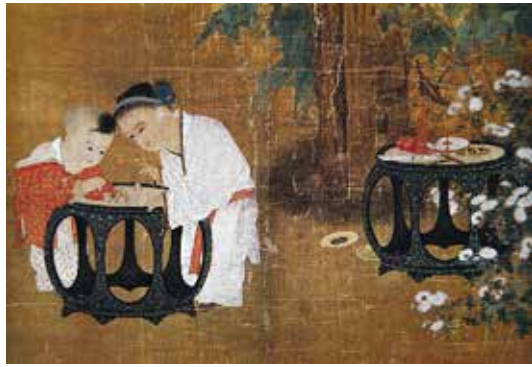
图 18 南宋苏汉臣《秋庭婴戏图》轴（局部） 台北故宫博物院藏