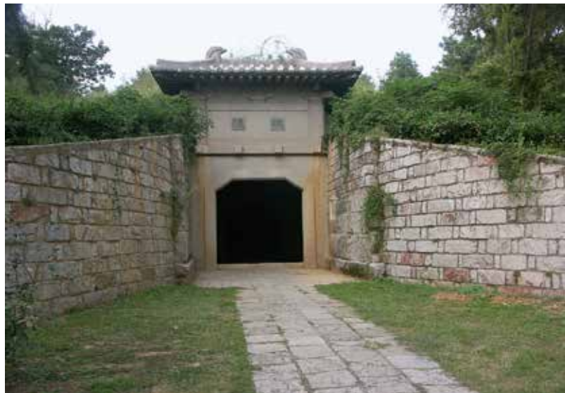
图 5-2 南唐李昇陵墓门外景

父子、兄弟相弑的血光事件屡屡发生。如后晋王李克用误以为其子李存孝要造反，当众杀子。朱温为灭口杀了养子友恭。乾化二年（912年）六月，朱友珪得知他未被立为太子，杀了父亲、梁帝朱温，朱友贞不服，杀兄友珪自立，为后梁末帝。后唐庄宗李克用被养子李嗣源所推翻，是为后唐明宗。又楚主马希范死后，马希广继位，其长兄马希萼不服，攻入潭州，希广被俘而亡……此类家族里亲人之间为争夺王权而自相残杀的事例，有的就发生在李璟当政之时的邻国，不可能不对南唐政权有所震动〔图 5-1〕。