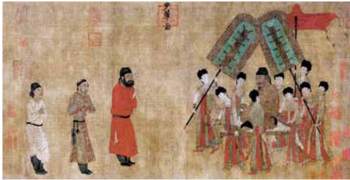
图 17 唐代阎立本《步辇图》卷 宋摹本