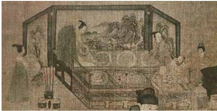
图9 周文矩《重屏会棋图》卷（北宋摹本）中的屏风

此绘容即其人”。王明清评曰：“面貌冠服无毫发之少异。” 1 足见其画艺之精。值得注意的是，画家领会了中主不是借绘画表现其威严，而是展现宫中平和的悌行，画家没有过多地扩张中主的体态，只是在构图上予以中心位置，四兄弟的头冠高低和外形有所不同，中主李璟戴方山巾，此乃唐宋时期隐士喜欢戴的冠式，表明主人公向往山林的思想，耸起的冠式也突出了主人公的形象；景遂、景邕和幼弟景达，都戴着十分普通的褙头，他们容貌端庄，眸子乌亮。画中的情节十分细腻而生动，画中的景邕执白，目视对手景达，其手势是在提醒对手，景达执黑子，神情专注，景遂和景达目视棋局，景遂的手背搭在景达的肩上，似乎是在鼓励小弟，显得十分