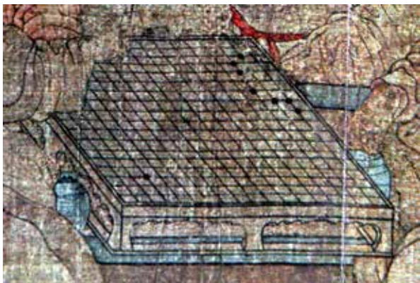
图7 周文矩《重屏会棋图》（北宋摹本）卷中的棋局是“北斗七星”