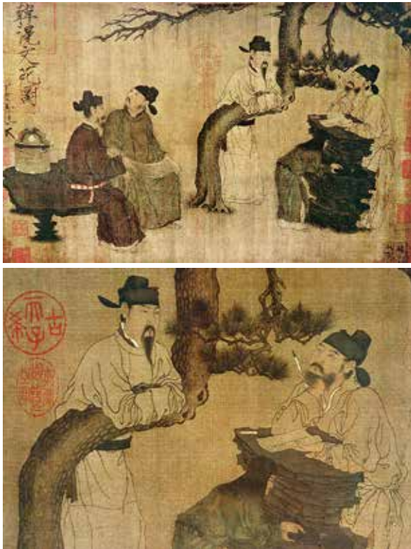
图2 周文矩《琉璃堂人物图》卷(部分) 旧作唐代韩晁《文苑图》卷,故宫博物院藏

查找的重点画家之一。此后已无周氏的活动记载,《宣和画谱》将周文矩归在宋代,位居第一,体现了北宋皇室特别是宋徽宗赵佶对其人物画的推崇程度。宋军将被征服国家的画家带到汴京,《宣和画谱》均将他们作为北宋画家,以壮声势,如西蜀的石恪、黄居冢和南唐的巨然、李煜及族叔景道、景游等。从这个角度来说,周文矩有可能入了北宋,也许生活时间较短。但至少可以确信,他的一大批绘画作品被宋军收缴,运至宋室,其中就有他的《重屏会棋图》卷,与其他的七十五件绘画被《宣和画谱》卷七著录。据此著录,可知周文矩除了擅长画仕女和表现皇室生活之外,还长于画界画(如《阿房宫》等)、山水画(如《春山图》)、佛像(如《卢舍那佛像》《慈氏菩萨像》等)、历史故事(如《李德裕见刘三复图》等),惜皆不存世,其中包括《重屏会棋图》卷。