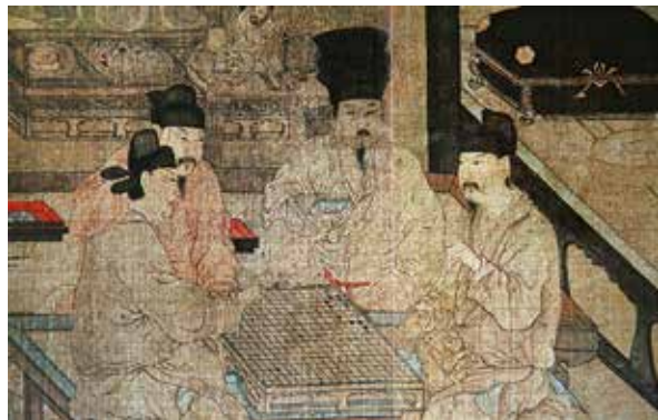
图4 明人临《重屏会棋图》卷 编本墨笔 纵31.3厘米 横50厘米 美国佛利尔美术馆藏