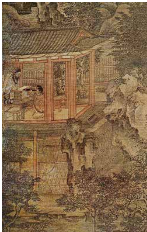
图 16 五代南唐卫贤《高士图》卷(局部) 故宫博物院藏

比较唐代阎立本《步辇图》卷（宋摹）〔图 17〕、李真《不空金刚像》轴（日本京都教王护国寺藏）和王维（传）《伏生授经图》轴（日本大阪市立美术馆藏）等表现单一情节的人物画，周文矩等南唐宫廷画家开始改变了前朝人物画环境简单化和情节单一性的创作手法，大大增强了人物画的叙事能力，影响了两宋人物画的构思技巧，这无疑是一个新的发展。如南宋苏汉臣的《秋庭戏婴图》轴更是娴熟地掌握了这种表现联想情节的时间关系，画中的儿童正静静地玩着小转磨，刚才他们还在庭院里追打，玩具散落一地，花枝似乎还在摇动〔图 18〕。比较《唐五代两宋人物画中人物活动时序表》，便可发现古代人物画史上这一重要的发展和变化：自五代南唐人物画兴起的联想情节，这种表现手段较多地运用到表现文人雅集的活动或其他故事性人物画中，可将绘画史上的这一微妙变化作为鉴别唐五代两宋人物画的佐证之一。