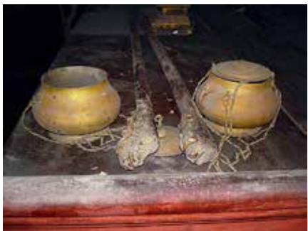
图 20 铜提炉