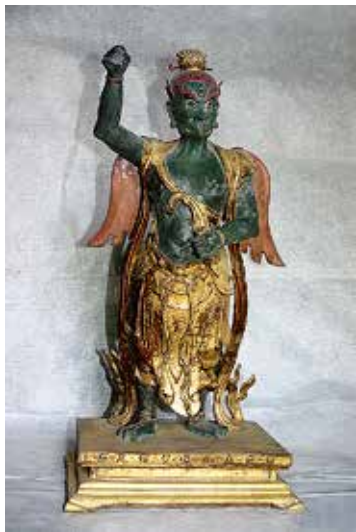
图 10 雷霆主令炎帝邓元帅

描金红油漆神龛两侧供红油漆神龛桌，内供神牌，南侧龛桌内所供神牌有：九天雷祖大帝、六天洞渊大帝、可韩司丈人真君、九天生神上帝、斗母摩利支天大圣、东极注生大帝、长生保命天尊、南斗六司星君、天地人黄甲君、三台华盖星君、十二宫辰星君、十一道曜星君，共 12 位。北侧龛桌内所供神牌位有：二十八星君、三垣帝座星君、天都万寿天尊、北斗九皇星君、福禄寿星真君、三十二天帝君、保运妙化天尊、六波天生帝君、碧玉宫太一大天帝、南极长生大帝、雷声普化天尊，共 11 位。