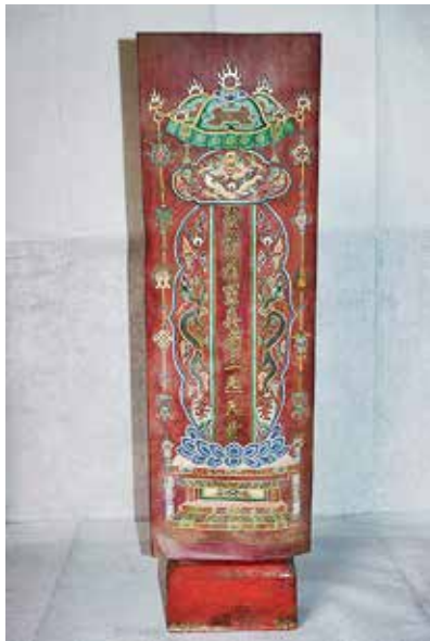
图 16 五方之南方神牌

《斋坛陈设图》应是娄近垣主持宫中和宫外皇家道场时法坛的陈设依据，天穹宝殿的法器与《斋坛陈设图》中的法器是一致的。