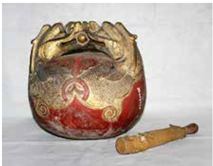
图 19 木鱼