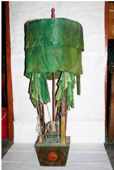
图 17 东方镇坛斗

根据《斋坛陈设图》，可复原天穹宝殿的坛场分布格局：醮坛北供主神玉皇大帝，上方是三清神位（即《陈设图》中三面悬挂圣像的位置）。在昊天上帝座前，设供案一张，上置五供，供案左右两侧设金钟、玉磬。供案前辅拜垫一块，拜垫东西置经桌四张，东经桌两张一字排开，上设皇经五部、道经五部、敕剑令牌一份、铜磬一口，铜帝钟一把；西经桌两张一字排开，上设皇经五部、道经五部、敕剑令牌一份、木鱼一件、铜帝钟一把。法师和知磬等立于东经桌前，都讲与表白等立于西经桌前。再于坛的四隅设神牌桌五张，上置五方神牌五份〔图 16〕、五方镇坛斗五份，即于坛的东南方设南方斗，东北方设东方斗〔图 17〕，于坛的西南方设西方斗，西北方设北方斗，于坛的东北上方设中央斗。坛的前方于东西再设法桌两张，上设铛、钹、鼓等乐器，是音乐人站立演奏的地方。