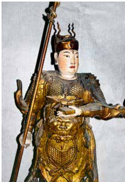
图4 正一灵官马元帅

为东汉道士张道陵，于汉顺帝时创立“正一盟威之道”，尊老子为道祖。因受其道者辄出五斗米，故又称为“五斗米道”。唐僖宗时封为“三天扶教辅天大法师”，宋理宗加封为“三天扶教辅天大法师、正一静应显佑真君”。许真君，头戴天丁冠，白脸，手执令牌，身着道袍，为晋代道士许逊，少年时即得师大洞真君吴猛所传三清法要，晋太康元年拜为蜀旌阳令，为官清明，政绩卓著，受民爱戴，为他立生祠供奉。他因见晋室纷乱，弃官从吴猛游走江湖，后遇上圣真人传授“太上灵宝净明法”，斩蛟精，为民除水患，道法大显，声名远扬。北宋政和二年封为“神功妙济真君”。葛真君，头戴天丁冠，执令牌，身着道袍，为西晋道士葛天，为葛洪的三代从祖，相传他曾在江西阁皂山修道，擅符咒诸法和各种奇术，人称“葛仙公”，宋宁宗三年封为“冲应真人”，淳佑三年封为“冲应孚佑真君”。萨真君，头戴天丁冠，执令牌，着道袍，为宋代道士萨守真，少时本为医生，相传因误用药死人，故弃医从道。