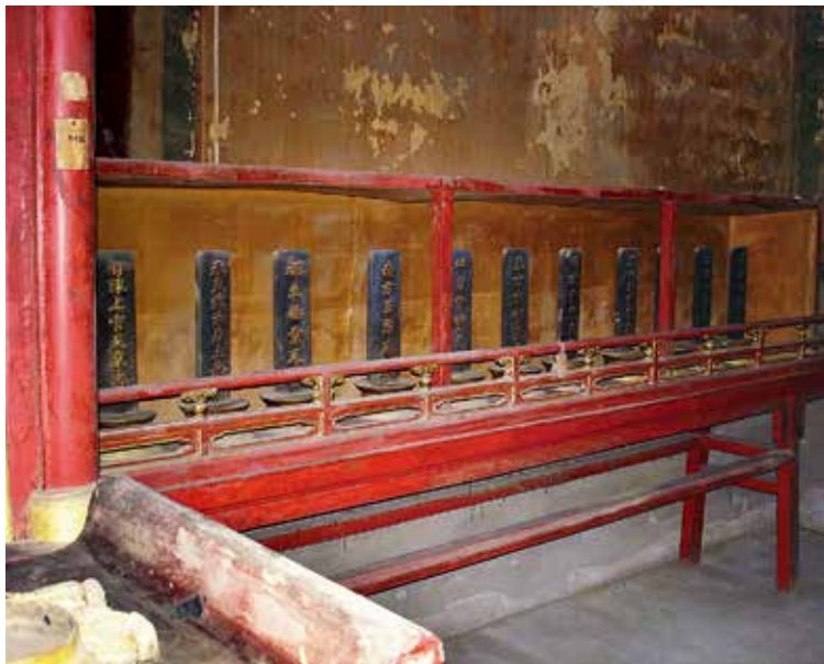
图 14 西配正龕之北側粗木紅漆神龕

描金红油漆神龕两侧供红油漆神龕桌〔图 14〕，内供神牌，南侧龕桌内所供神牌有：十向十极天君、下方灵宝天尊、西北方灵宝天尊、东南方灵宝天尊、北方五气天君、南方灵宝天尊、中央一气天君、西方一气天君、东方九气天君、太平护国天尊、星主紫微北极大帝，共 11 位。北侧龕桌内所供神牌有：勾陈上宫天皇大帝、承天效法后土地祇、福生无量天尊、南方三气天君、北方灵宝天尊、东方灵宝天尊、西方灵宝天尊、东北方灵宝天尊、西南方灵宝天尊、上方灵宝天尊、五福十神真君，共 11 位。