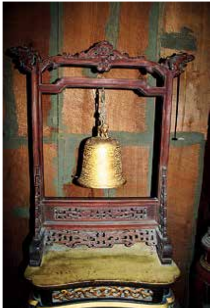
图 23 金钟