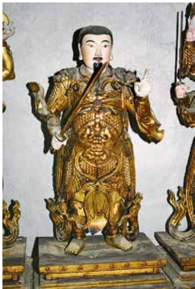
图5 北极佑圣玄天上帝