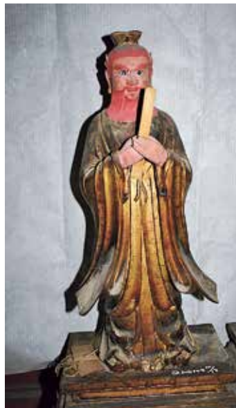
图3 正一静应张真君