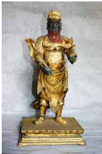
图 11 雷霆掌令青帝辛元帅