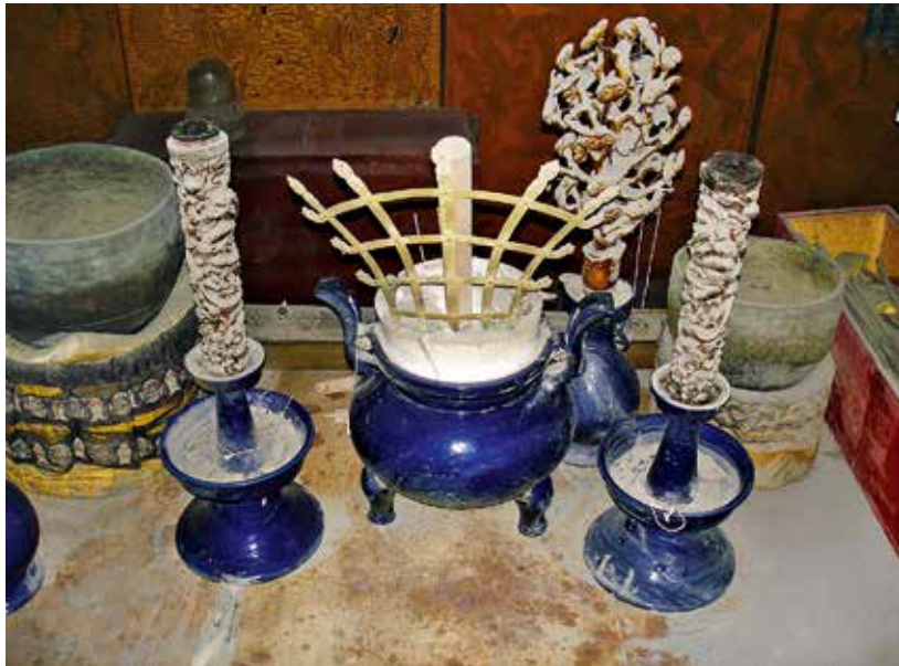
图 24 天青瓷五供

辉为成造天穹殿幡、帐、桌围等件请交苏州织造一并绣做之处缮写折片持进交太监胡世杰转奏，奉旨：准交苏州办做，其幡上字并“郁罗霄台”字俱着于敏中另写。于四月初五日郎中白世秀、员外郎金辉将画得天穹欢门幡、帐、桌套、龕幔等纸样十五张持进交太监胡世杰呈览，奉旨：准交苏州织造处成做。于八月初一日催长强锡将做得幡、桌围等件持进安挂讫 1 。