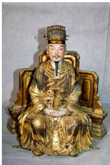
图 13 三官大帝之一