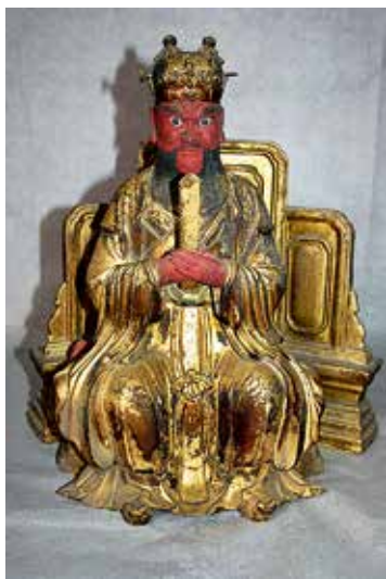
图 12 火神帝君