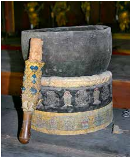
图 18 铜磬