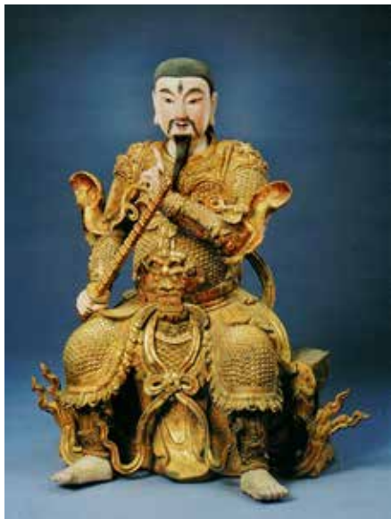
图9 九天应元雷声普化天尊铜像