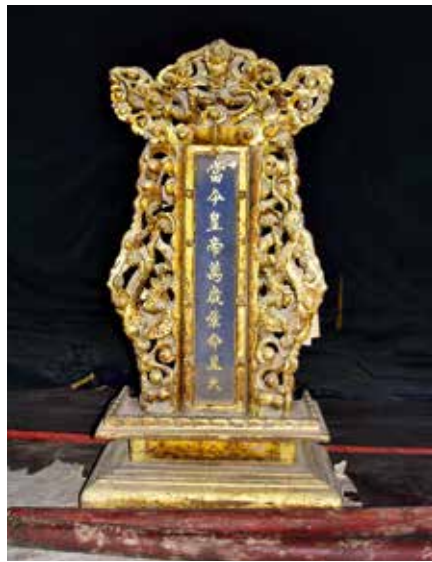
图 22 皇上景命牌