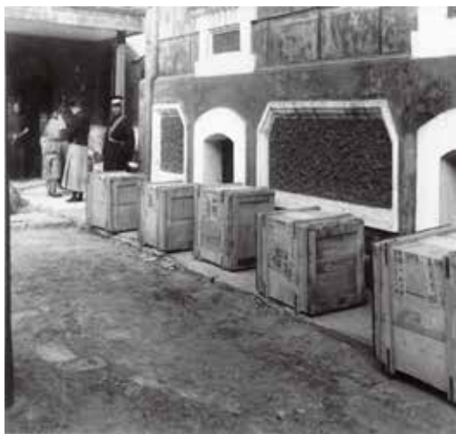
图7 宝蕴楼外的南迁文物箱件 5