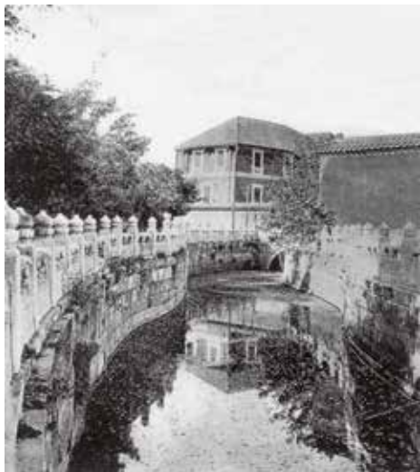
图3 宝蕴楼旧照 1

外观也别致，东西两楼相峙，左右对称，三楼均采用大块的城砖砌筑墙身，屋顶是高耸的四坡式屋顶，没有曲线、出檐，不铺琉璃瓦，而是铺绿灰两色的片石。宝蕴楼的建筑风格具有明显的时代特征，选用西式的外观使其可以运用当时较为现代化的建筑材料和装修风格。砖木结构的楼房较之木建筑更为坚固，在防潮、防震等方面也更为突出。它同时采用中国传统的院落式建筑布局，这样既与周围建筑保持了相对的和谐，更重要的是保留了中式建筑封闭性好的优势。同时，宝蕴楼选用细窄的玻璃窗户，则在通风的同时加强了宝蕴楼作为库房的安全性。宝蕴楼工程共建设有3层，其中最下层是地下室，这显然也是考虑到了库房的防震、防爆特性。