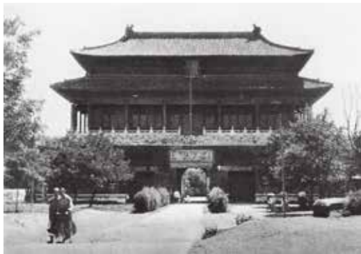
图1 古物陈列所（西华门牌）

宝蕴楼，位于西华门〔图1〕附近，其建筑是在咸安宫旧址上建立起来的。咸安宫原是一座位于寿康宫后、长庚门内的明紫禁城宫殿建筑，后于清康熙二十一年（1682）改建。雍正六年（1728）在此设立官学。雍正七年（1729），咸安宫内修理读书房三所。乾隆十六年（1751），咸安宫改称寿安宫，作为皇太后、妃等居住之所，而原咸安宫官学则被移到西华门内、武英殿西的尚衣监处。乾隆二十五年（1760）又在尚衣监西边新建咸安宫官学新校舍，门三间，门内影壁一座，内为三进院，每进院正房3间，东西厢房各3间，共有房27间，新建校舍依官学的名称仍命名为咸安宫。 2 目前在一些新闻报道及研究文章中，写到宝蕴楼的缘起都会提到“康熙时废太子允礽曾禁錮于此”。但康熙两次废太子的时间是在四十七年到五十年间，此时咸安宫尚未搬迁，也尚未成立官学，禁足废太子允礽的宫殿为寿安宫（即现故宫博物院图书馆所在地），而非宝蕴楼现在的位置。由此可见，对于宝蕴楼的历史还有很多误读。