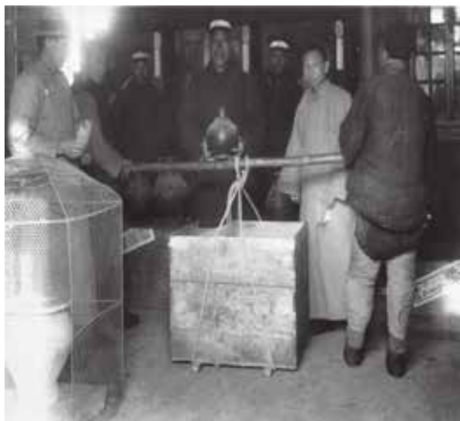
图6 1933年宝蕴楼库房内的文物装箱 4