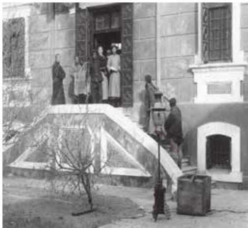
图5 文物集中宝蕴楼 3

此外，随着原分散放于各殿的古物陆续移入宝蕴楼，古物陈列所的各殿得以腾出，从而进一步发展了博物馆事业。如文华殿最初被用于存储古物，将文物陆续移入宝蕴楼后，才逐渐开始作为展厅使用。1935年1月，古物陈列所清理福开森寄托物品，并暂分别收入宝蕴楼正楼柜内；6月31日，