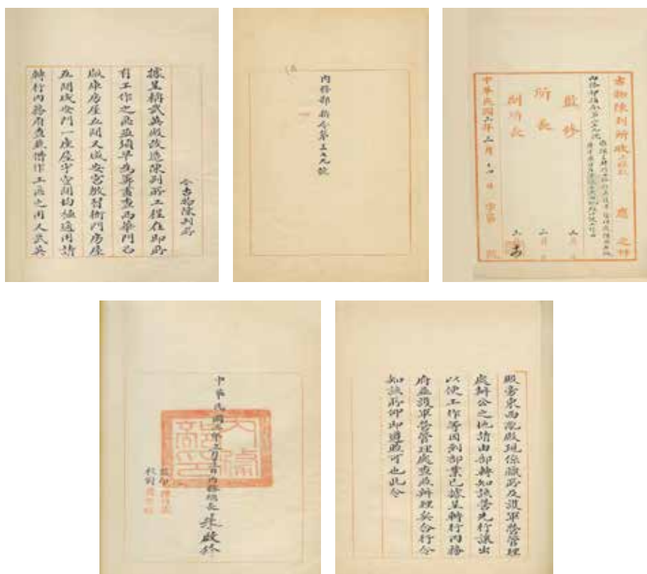
图2 内务部指令第三七九号

时值北洋政府执政，对清室极为优容。清帝虽已退位，但紫禁城内宫殿大多仍为清室所占。外廷部分有清室所属的“护军”驻扎。1914年3月14日，内务部批准了古物陈列所的呈文，并与护军营管理处沟通，要求其让出该地区〔图2〕。 2