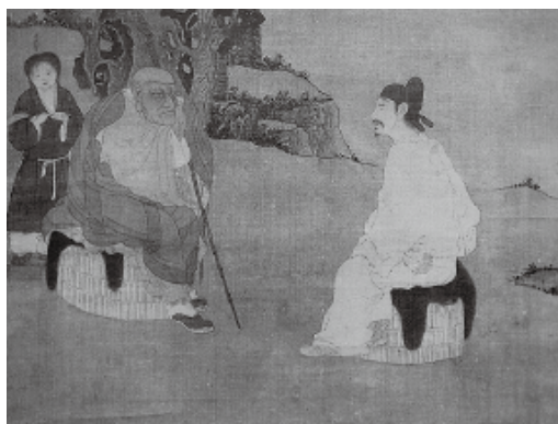
图三〇 元人 传经图 轴，绢本，设色，纵 130 厘米，横 56.2 厘米，台北故宫博物院藏