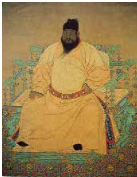
图一 宝座 明 宫廷画家绘，明宣宗坐像，轴，绢本，设色，纵210厘米，横171[1].8厘米，台北故宫博物院藏。

首先看看明代皇帝有哪些坐具。皇帝的坐具统称御座，一般在朝会、觐见、进表、进书等庄严肃穆的场合所用，或称“金台” 5 ，也就是近世所称的宝座，形制相对较为宏伟隆重，如明宣宗的坐像画，其宝座坐面宽广，扶手及靠背如建筑般的支架式架构，所有的出头都雕饰龙首，镶嵌杂宝、雕饰繁复，并且璎珞绦结、五色缤纷，整器呈现巍然的气势〔图一〕。宝座之外另有日常办公所用之坐榻，如黄淮（1367～1449）在朱棣南京登极