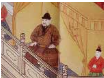
图七 胡床 明 宫廷画家绘，宪宗元宵行乐图卷（局部），绢本，设色，纵 37 厘米，横 624 厘米，中国历史博物馆藏