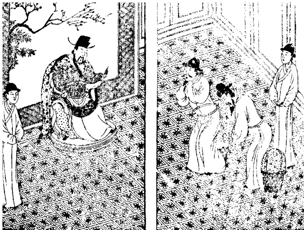
图三一 明 汪廷讷撰，三祝记，万历间汪氏《环翠堂乐府》版 日本京都大学藏。周芜编著，《金陵古版画》，江苏美术出版社，1993，页226～227