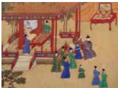
图六 胡床 投壶 明 宫廷画家绘，明宣宗宫中行乐图卷（局部），绢本，设色，纵 36.6 厘米，横 687 厘米，北京故宫博物院藏