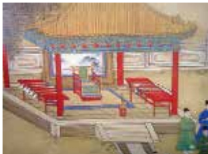
图三 四出头坐椅 明 宫廷画家绘，捶丸 明宣宗宫中行乐图卷（局部），绢本，设色，纵 36.6 厘米，横 687 厘米，北京故宫博物院藏