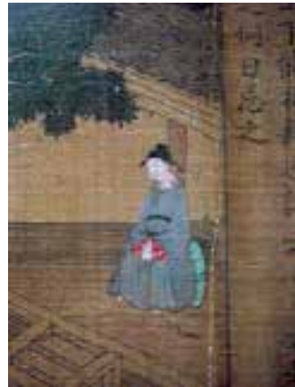
图二七 宋 孝经图卷 绢本，设色，纵 18.6 厘米，横 529 厘米，辽宁省博物馆藏