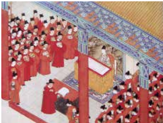
图二三 明万历 余士等绘，经筵进讲，徐显卿宦迹图册（部分） 绢本，设色，纵62厘米，横58.5厘米，北京故宫博物院藏