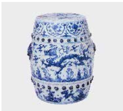
图二九 明 青花云龙纹鼓式绣墩 面径 21.5 厘米，底径 21 厘米，高 34 厘米，北京故宫博物院藏