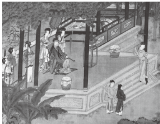
图二八 明 仇英 宫中图卷 日本，永青文库藏

至于蒲墩，有资格上殿赐坐的官员无分品秩皆可用，唯未加装饰。退朝后或燕闲在家，以及随驾出外时，可在蒲墩上加毛料编织成的绒罽绣褥。不过，根据定制，并非“一人一把号，各吹各的调”的自行随意打造，即使燕闲在家所用之蒲墩也要“如式制之”。崔亮所定之式不详。晚名文人文震亨在《长物志》说：“用蒲草为之……四面编束细密坚实，内用木车坐板，以柱托顶，外用锦饰。” 4 也许可做宫廷蒲墩之参考。元人的“传经图”上，描写伏生授经鼈错的故事，其坐具可能即为蒲草编织的蒲墩〔图三〇〕。明代中晚期的版画《环翠堂乐府》中，一冠带官员坐在覆着椅帔的交椅上，