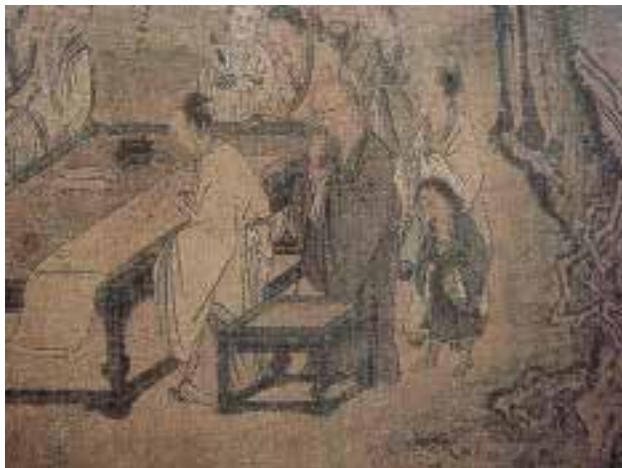
图一七 南宋 马远 Composing Poetry on a Spring Outing, 卷，绢本，设色，纵29.3厘米，横302.3厘米， 美国堪萨斯的尔逊美术馆藏

较，同为机凳类轻便小坐具，但是精粗有差、繁简有别。晚明的焦竑（1540～1620）曾撰《养正图解》以为太子朱常洛（后来的明光宗）出阁讲学用，其中的“辟馆亲贤” 1 描写“唐太宗”高坐交椅上，左右文学之士如燕翅般两溜排开，俱坐于一式低矮的圆机上〔图一八〕。若腿足略长，供上下马所