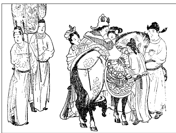
图一九（传）元 钱选杨妃上马图（线绘） 转引自陈增弼撰，《马机简谈》，《文物》，1980，第4期，页83

用又称“马机” 2 ，传为元代钱选的“杨妃上马图”，就描写“杨妃”在宫人的搀扶下正踏在一只曲腿圆机上马〔图一九〕。具体形制则有现藏北京故宫博物院的一件方机作为参考。至于小板凳，则是单片木板两端下接板足，侧看形成“凵”字形，形制更为简单。