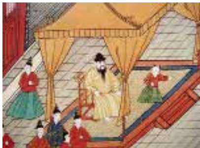
图四 四出头坐椅 明 宫廷画家绘，明宪宗元宵行乐图卷（局部），绢本，设色，纵 37 厘米，横 624 厘米，中国历史博物馆藏