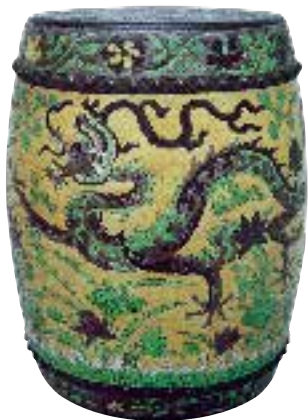
图二五 明万历 黄地三彩双龙纹鼓凳 高 34.1 厘米，上海博物馆藏