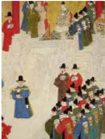
图二二 明万历 余士等绘，捧敕，徐显卿宦迹图册（部分） 绢本，设色，纵62厘米，横58.5厘米，北京故宫博物院藏

御座的至高尊崇，明代还有一条“擅入御座者律绞”之令 1 。对官员的进退，也有具文的“百官朝见仪”与“出入仪”等加以规范，如禁止“指画窥望”，就是上朝或出入宫苑不可比手画脚、东张西望。洪武二十六年（1393）所定的规矩，官员入朝时要“拱手端行，威仪整肃，不许私揖及吐唾”，除非是“眩晕或感疾”，否则不许“搀越失仪”，大致就是端庄肃穆的各自前行，不可私下行礼、吐痰和勾肩搭背等。官员上朝和退朝的动线是“文武东西，不许径越御道”，如在奉天门上朝，东边的官员要到西边，得绕金水桥南行再往西走，不准径越“御道”。凡“御座”所在之处就是“御道”或叫“中道”、“正道”，只有手捧“朝廷颁降诏书册命”时才可从“中道”出，但一出中门得立即偏东而行。前举“徐显卿宦迹图册”的“捧敕”一景，可见徐显卿双手高捧敕书，正步下中道，走向跪候于地的受敕官，背后丹墀中道之上，正是端坐在交椅上的万历皇帝〔图二二〕。