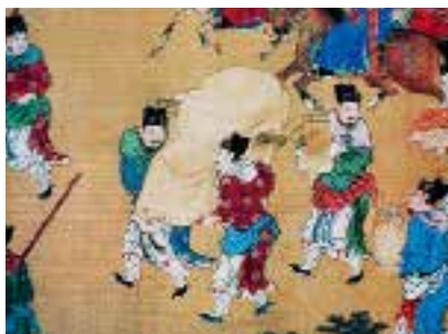
图一〇 圈背交椅 明 宫廷画家绘，明人出警入蹕图卷（出警局部），绢本，设色，纵 92.1 厘米，横 2601.3 厘米，台北故宫博物院藏