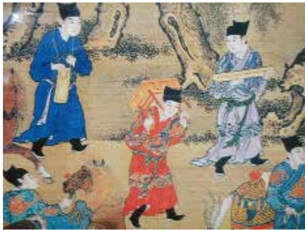
图三二 马机，明宫廷画家绘，明人出警入蹕图卷（入蹕图局部） 绢本，设色，纵92[1].1厘米，横3003.6厘米，台北故宫博物院藏

面前的二名官员正身对其弯身揖拜，身后各有同式蒲墩，俨然上级对下属的“赐坐”，蒲墩蜂巢式编织〔图三一〕，上覆碎花绣物，或可作为形制参考。