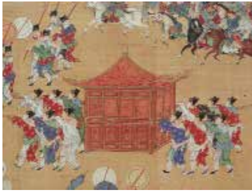
图一二 红板轿 明 宫廷画家绘，明人出警入辟图卷（出警图局部），纵92.1厘米 横2601.3厘米，台北故宫博物院藏。

宴毕，嘉靖又“乘輿还宫” 1 。隆庆四年（1570）庆贺冬至仪后之赐宴，“与宴官俱序列于丹墀东西迎驾，候驾过殿内，与宴官随即趋入分班序立，上常服乘板輿，由归极门出入皇极门，乐作，至殿上降輿，升座，乐止，鸣鞭……” 2 万历的“出警入辟图”中亦可见到此十二人扛的红板轿〔图一二〕。