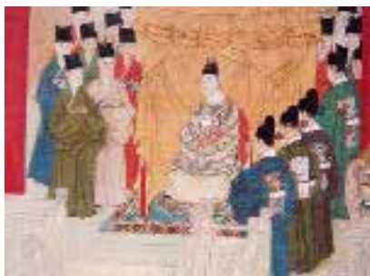
图九 圈背交椅 明 万历 余士等绘，捧敕，徐显卿宦迹图册（部分），绢本，设色，纵 62 厘米，横 58.5 厘米，北京故宫博物院藏