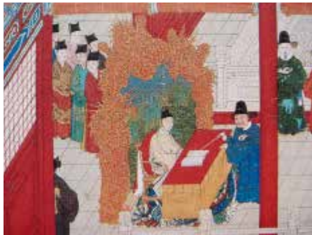
图二四 明万历 余士等绘，日直讲读，徐显卿宦迹图册（部分） 绢本，设色，纵62厘米，横58.5厘米，北京故宫博物院藏

伺候。……各官行礼毕，裕王殿下就于本书堂里间就座，景王殿下入南书堂里间就座……内侍官捧书展于案上就案左立，讲读官以次进立于案前授书各十遍 1 。