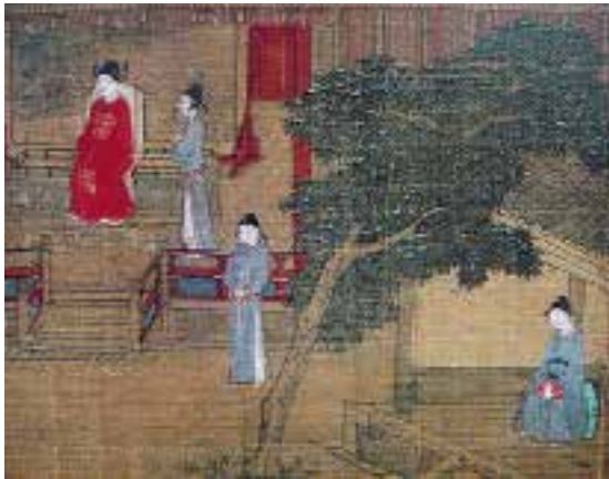
图二六 宋 孝经图卷 绢本，设色，纵 18.6 厘米，横 529 厘米，辽宁省博物馆藏