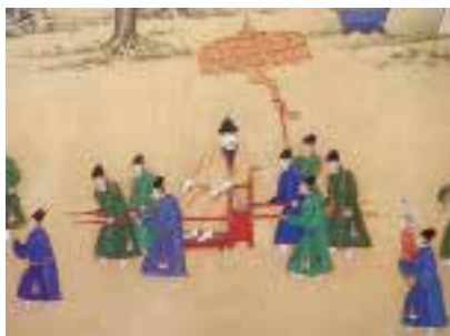
图一一 椅轿 明 宫廷画家绘，明宣宗宫中行乐图卷（局部），绢本，设色，纵 36.6 厘米，横 687 厘米，北京故宫博物院藏

为板座，长轿杆穿过板座外的环扣，前后各一名太监从杆端处起索，攀过肩颈抬至腰处行走 1 ，画中可见左右另有太监躬身协力扶持〔图一一〕。