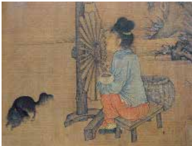
图一六 北宋 王居正 纺车图 卷，绢本，设色，纵26.1厘米，横69.2厘米，北京故宫博物院