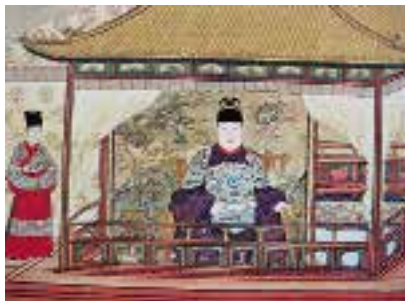
图五 四出头坐椅 明 宫廷画家绘，明人出警入蹕图卷（入蹕局部），舟中行坐，绢本，设色，纵 92.1 厘米，横 3003.6 厘米，台北故宫博物院藏