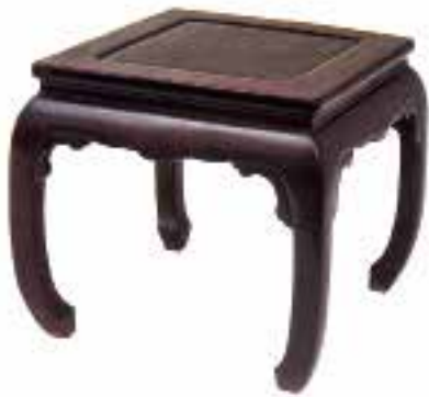
图二〇 清初 紫檀鼓腿彭牙方机 长宽57厘米，高52厘米，北京故宫博物院藏

渥也。” 1 成化（1465～1487）一朝有二十三年，成化中期约当成化十二年左右。换言之，明代的阁臣们坐了一百余年的小杌子，至此才有个“连椅”可坐，并且还有舒适体面的“漆床”，并附设“锦绮衾褥三副”。内阁 2 的门扉又在太监的张罗下，夏秋间有竹帘，冬春间有毡帘，撰文的兵部尚书尹直（1427～1511）对宪宗的“宠遇”，觉得“恩何渥也”，似乎就要涕泗纵横了。所谓的“连椅”，依据今人解释，就是有靠背、椅面向两旁延伸以供二人以上所坐的长椅子。张居正任职太子少师时，曾撰有《帝鉴图说》一书，引古圣先王之德作为太子规鉴，其“任用三杰”图中，“汉高帝”之侧为韩信、萧