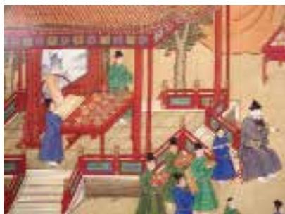
图八 圈背交椅 明 宫廷画家绘，明宣宗宫中行乐图卷（局部），绢本，设色，纵 36.6 厘米，横 687 厘米，北京故宫博物院藏。