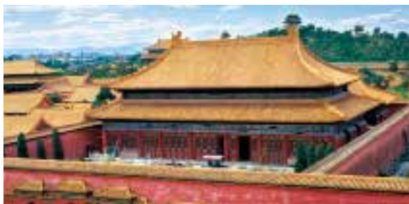
图一：4 奉先殿重檐庑殿顶