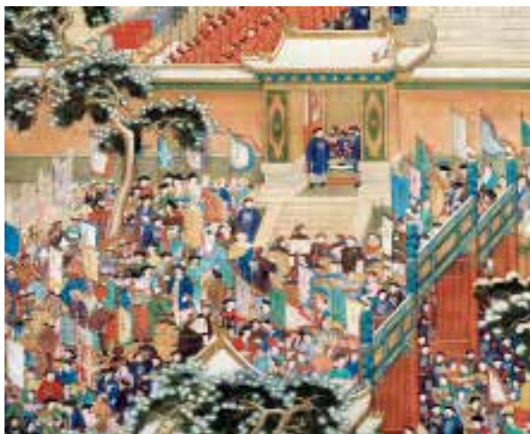
图七：3 清人万国来朝图轴 - 局部

集,仪仗整齐。宁寿门外的广场上左右排列着进贡的队伍 1 。从宫廷绘画这个侧面也说明了皇极殿与太和殿的等同意义。