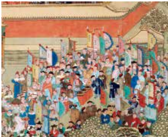
图六：3 清人万国来朝图轴 - 局部