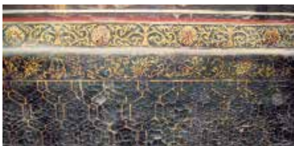
图二：3 皇太后的永康宫彩绘的龟锦纹样