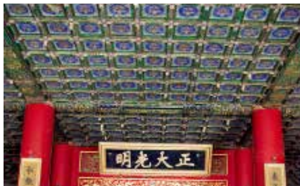
图四:4 乾清宫内天花