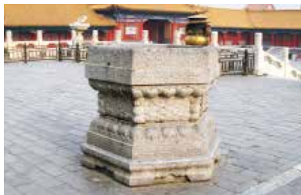
图八：6 乾清宫万寿灯石座