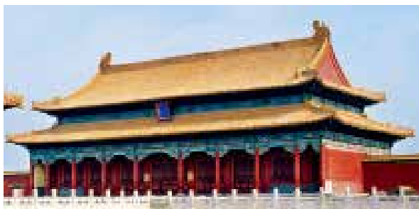
图一：5 保和殿重檐歇山顶