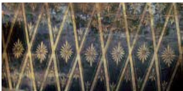
图二：5 皇太子的惇本殿彩绘的花卉纹样