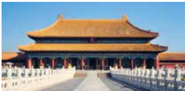
图一：3 乾清宫重檐庑殿顶