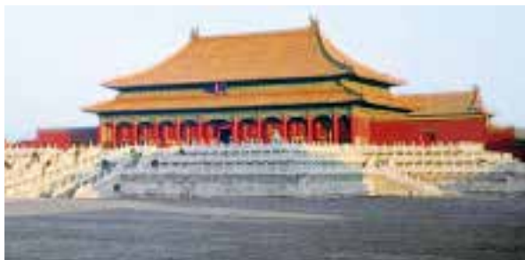
图一：2 太和殿重檐庑殿顶