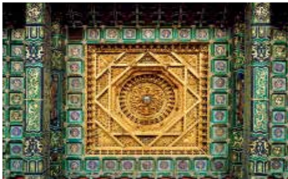
图四:1 皇极殿内藻井