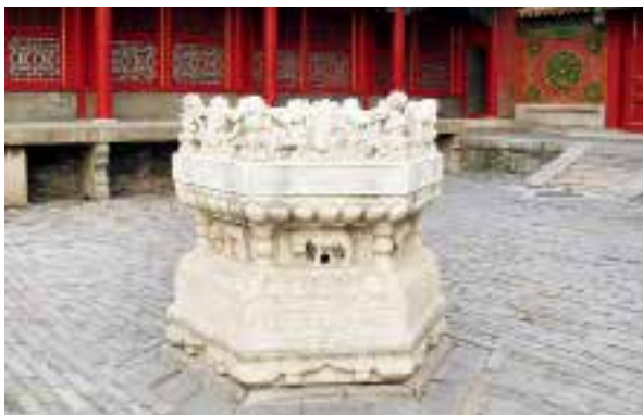
图八：3 皇极殿天灯石座