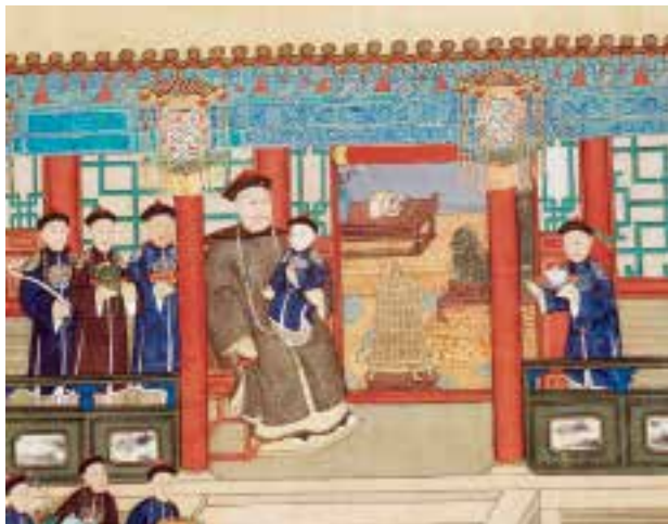
图六：2 清人万国来朝图轴 - 局部