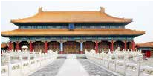
图一：1 皇极殿重檐庑殿顶