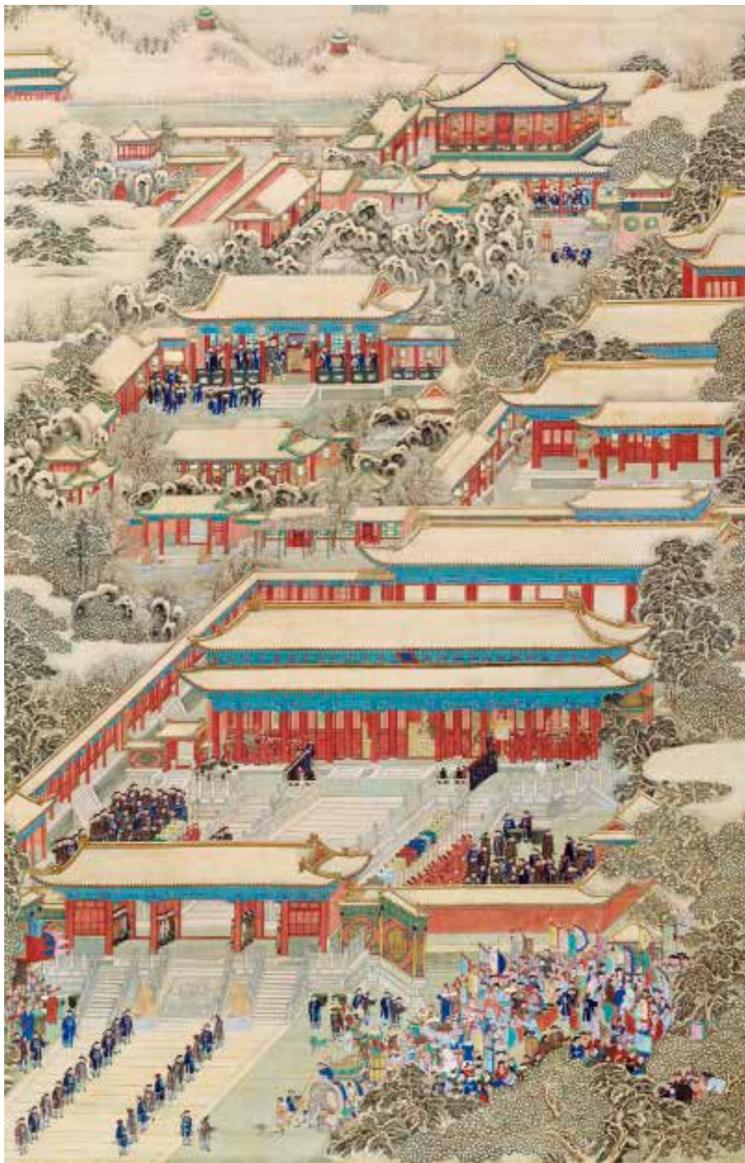
图六：1 清人万国来朝图轴

图六 清人《万国来朝图》轴（以宁寿门、皇极殿为背景） 绢本设色 纵365厘米 横219.5厘米 故宫博物院藏