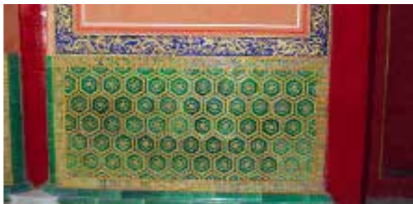
图二：1 皇极殿摆砌的黄绿色琉璃龟锦纹砖