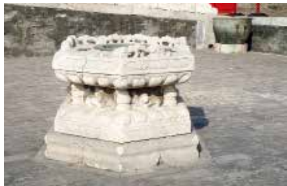
图八：4 乾清宫天灯石座