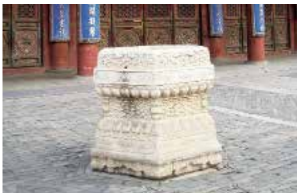
图八：5 皇极殿万寿灯石座