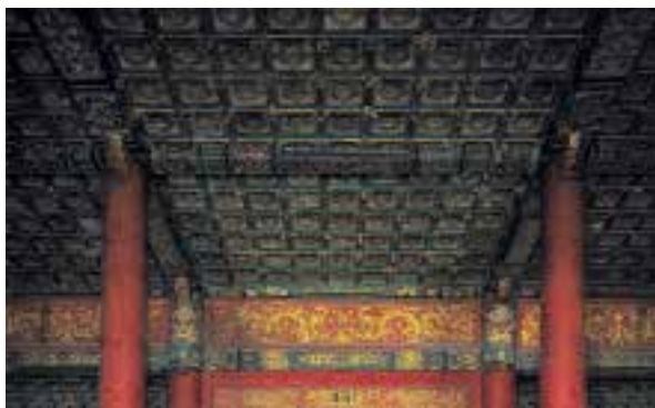
图四:3 保和殿内天花