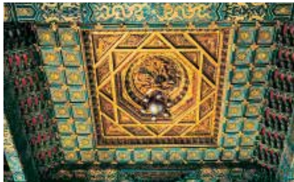
图四:2 太和殿内藻井