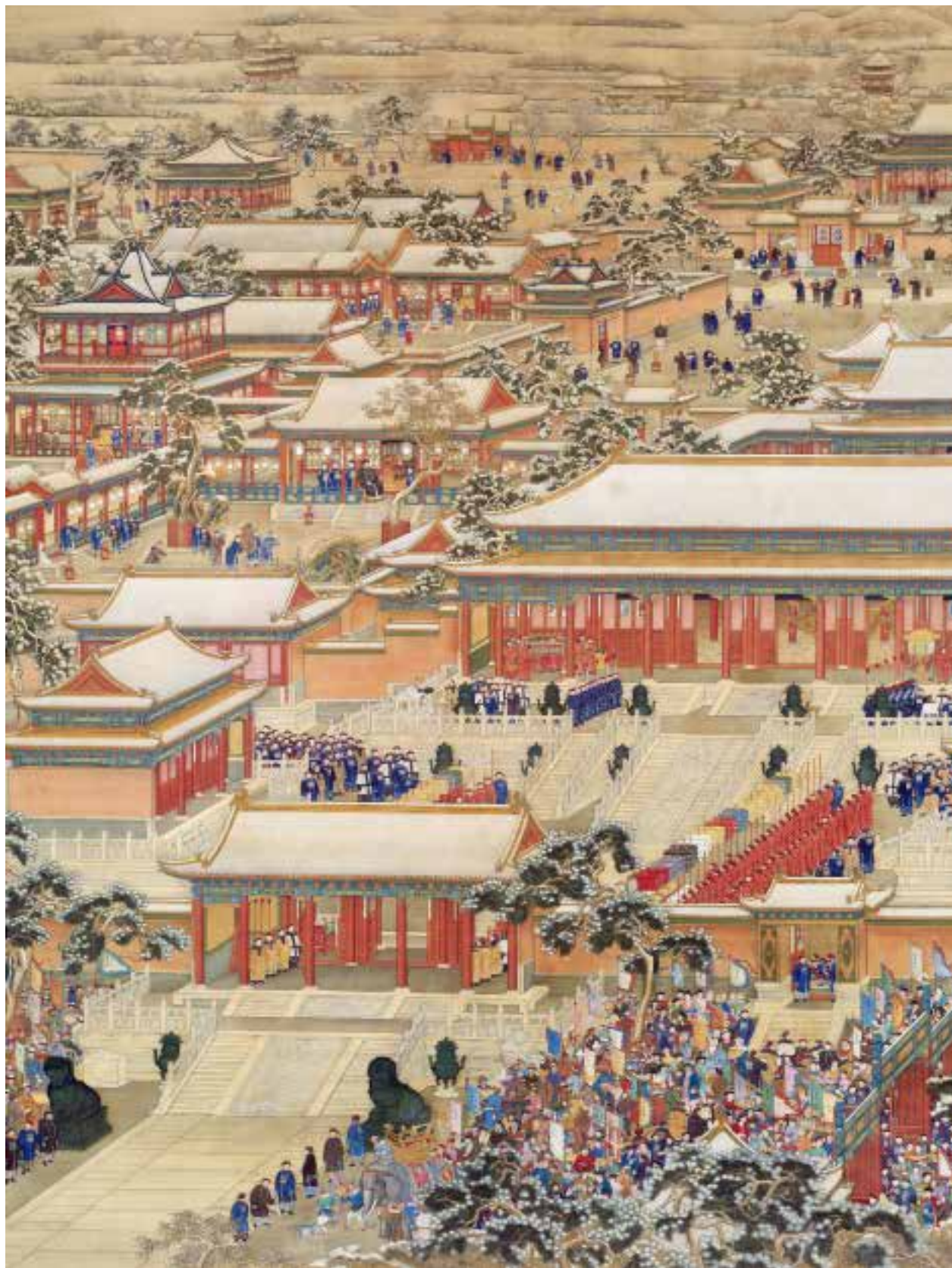
图七：1 清人画万国来朝图轴-全形