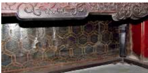
图二：4 乾隆潜邸崇敬殿彩绘的龟锦纹样