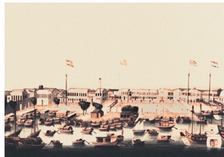
约 1810-20 年代的广州商馆区