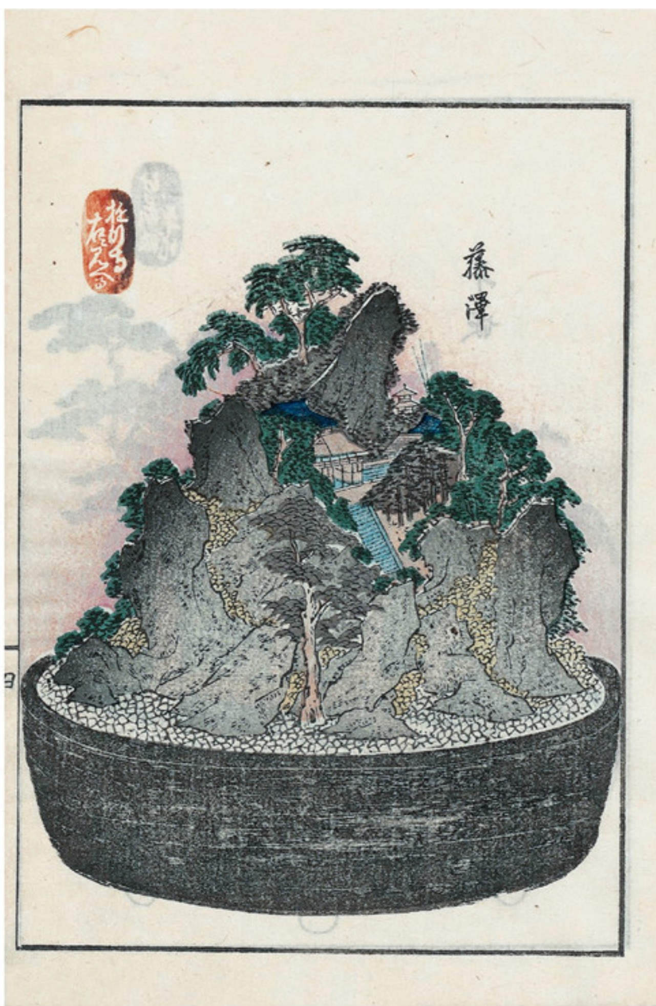
一八四八年（日）嘉永元年 木村唐船编、歌川芳重绘《东海道五十三驿钵山图绘》之「藤泽」 木刻水印 史密斯·卢瑟福 (Smith-Lesoufer) 图书馆藏

占景盘，在我国原指插花器皿。宋陶谷《清异录·器物》：「郭江州有巧思，多创物，见遗占景盘，铜为之，花唇平底，深四寸许，底上出细筒殆数十。每用时，满添清水，择繁花插筒中，可留十余日不衰。」在日本则为一种沙盘景物，于盘中摆放景石，栽种小型花草，盘面覆砂，浇水后形成自然山水景色。《占景盘图式》与《东海道五十三驿钵山图绘》是日本古代传统盆景的专论。二书内容、形式和内涵均沿袭自中国传统盆景，表现手法上均借鉴中国传统画理与园艺之论，《占景盘图式》书名亦沿袭中国古称。