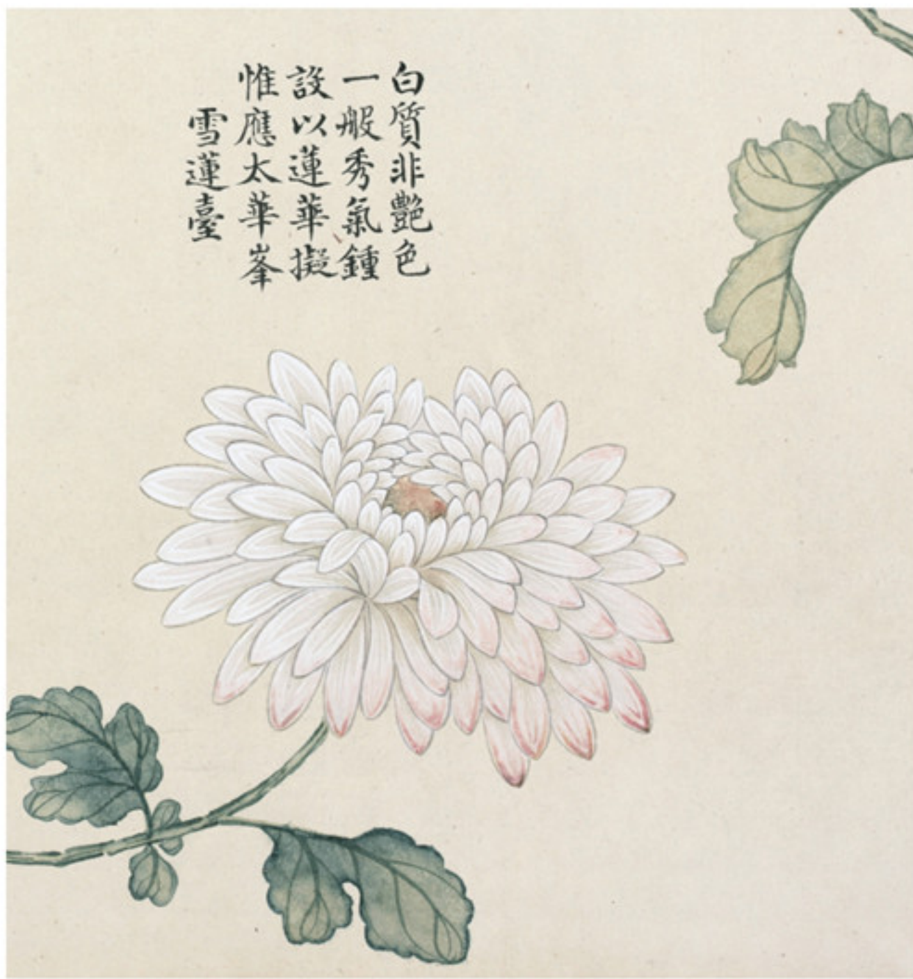
清 汪承霈 洋菊四十四种图局部之“雪莲台” 纸本设色 故宫博物院藏

材的绘画创作中，早期作品以陶渊明赏菊、采菊、嗅菊、栽菊的形象描绘较多，而清代画坛中的花鸟画派使咏菊独占晚香。这时，菊花清高傲世的精神渐渐淡化，逐步