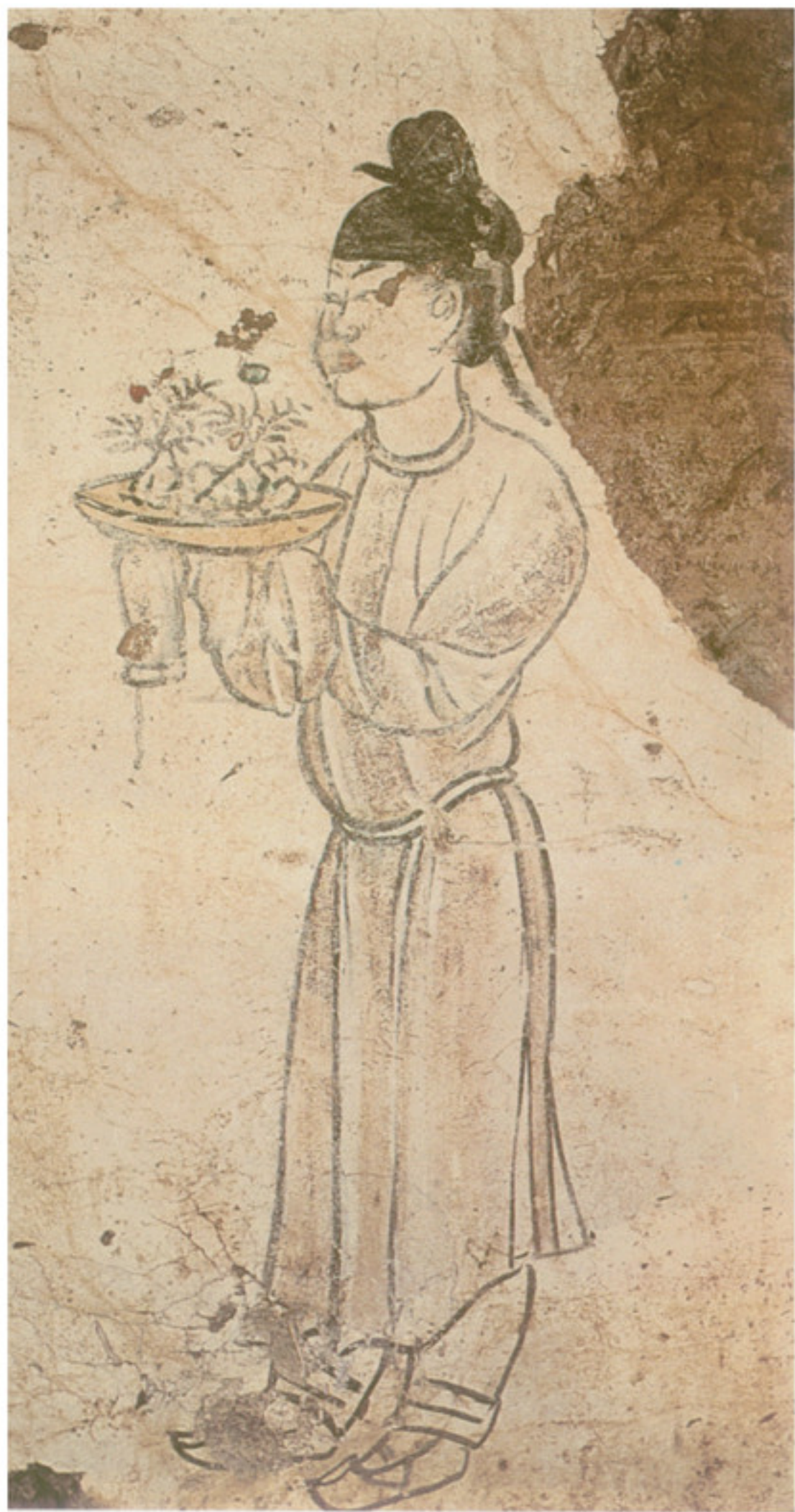
唐代章怀太子李贤墓前甬道东壁画上手捧盆景的仕女

在天然盆景迅速发展的同时，一种由贵金属与各种稀有宝石为材料的工艺盆景应运而生。这种力求顺应自然但又超脱于自然的工艺品，创造性地将自然与人工融为一体，使之能够跨越时间的界限为世人