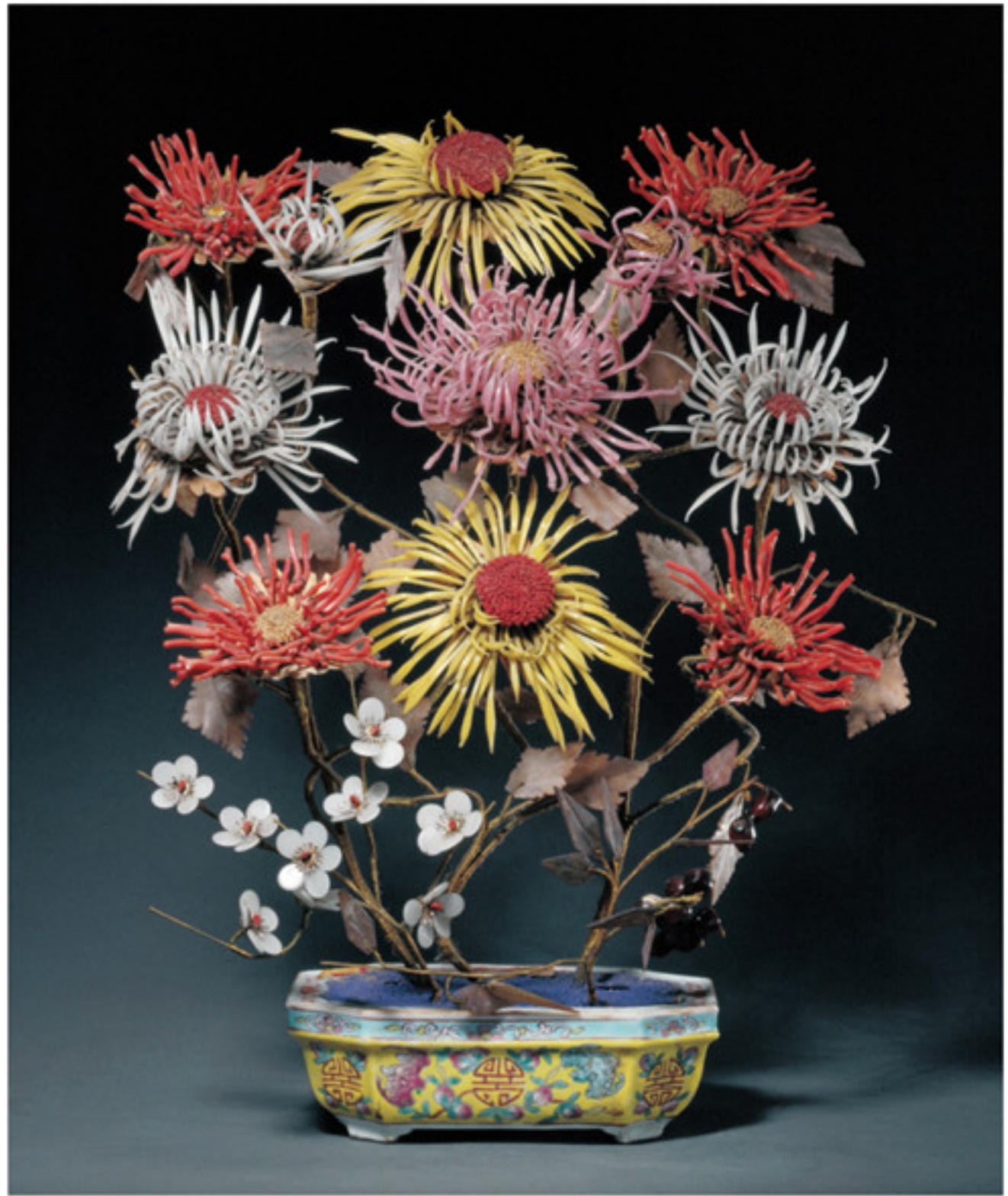
清 粉彩桃蝠纹盆珊瑚菊花盆景 高四二厘米 故宫博物院藏