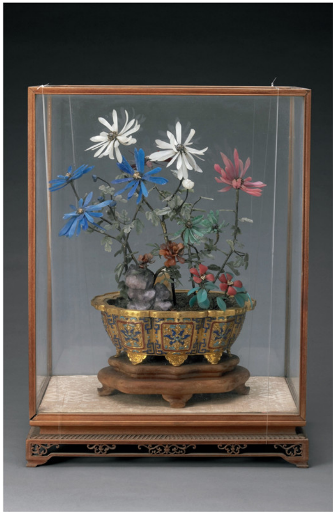
清 铜镀金嵌玉石玻璃盆玻璃菊花盆景 通高三八·九厘米 故宫博物院藏 原陈设于延晖阁

其一，内廷造办处的相关作坊制作。造办处的工艺盆景活计主要交由镶嵌作承办，珐琅作、木作等承担花盆及香几、琴桌等座托的配置。如乾隆十二年七月十四日《活计档》记载，木作为两件紫檀木镶银母盆鹤顶红塔盆景配香几座子。不过，由于造办处承制活计的能力有限，完整制作盆景的记录并不常见，较多的为收拾见新、添配或修补。如：乾隆九年五月十八日，镶嵌作将四件镶嵌玳瑁牙花盆景的花叶粘好；乾隆二十年三月二十日，镶嵌作为一件象牙花盆景收拾见新；乾隆十一年五月十七日，玉作将一件紫檀木六方玻璃罩金盆景上松石拆下，另配绿猫石补上。诸如