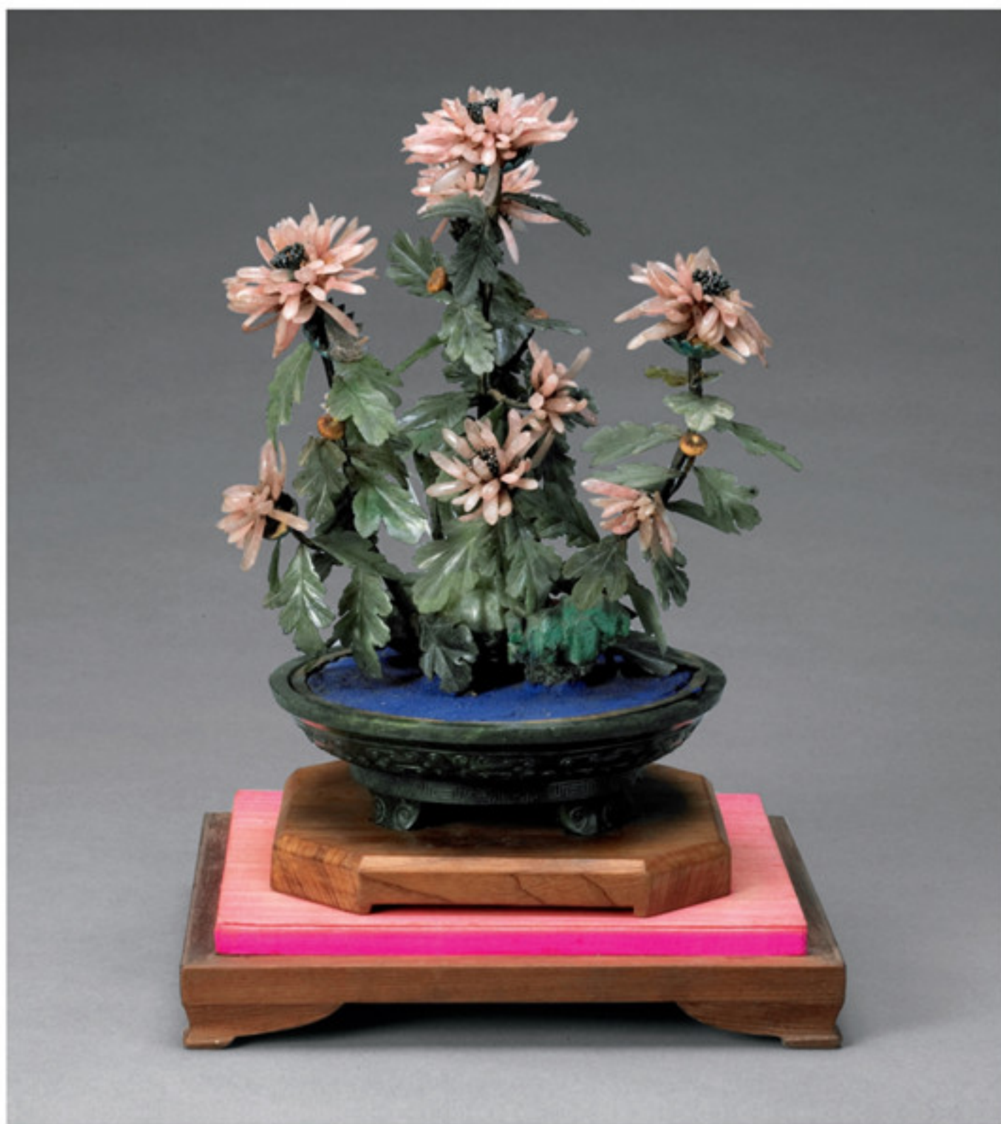
清 碧玉盆珊瑚菊花盆景（一对） 故宫博物院藏