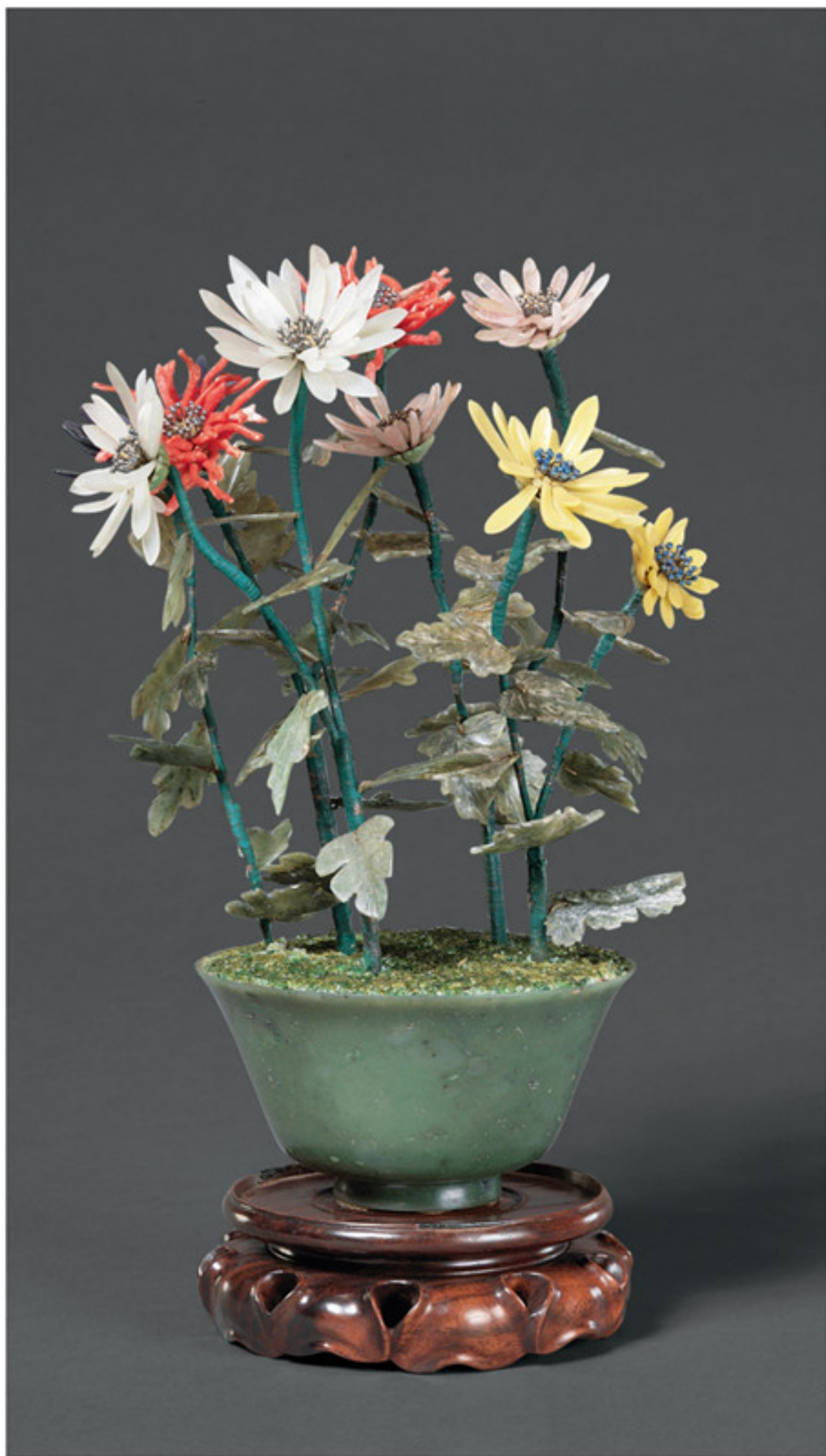
清 碧玉盆玉石珊瑚菊花盆景 故宫博物院藏