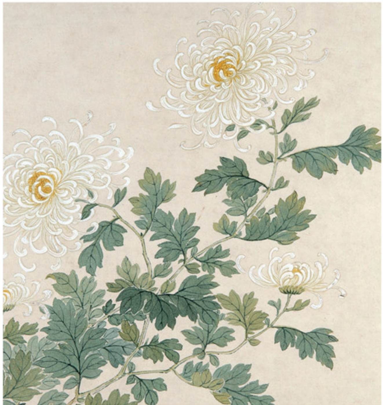
清 关槐 洋菊十六种图册局部之“万卷书” 纸本设色 故宫博物院藏