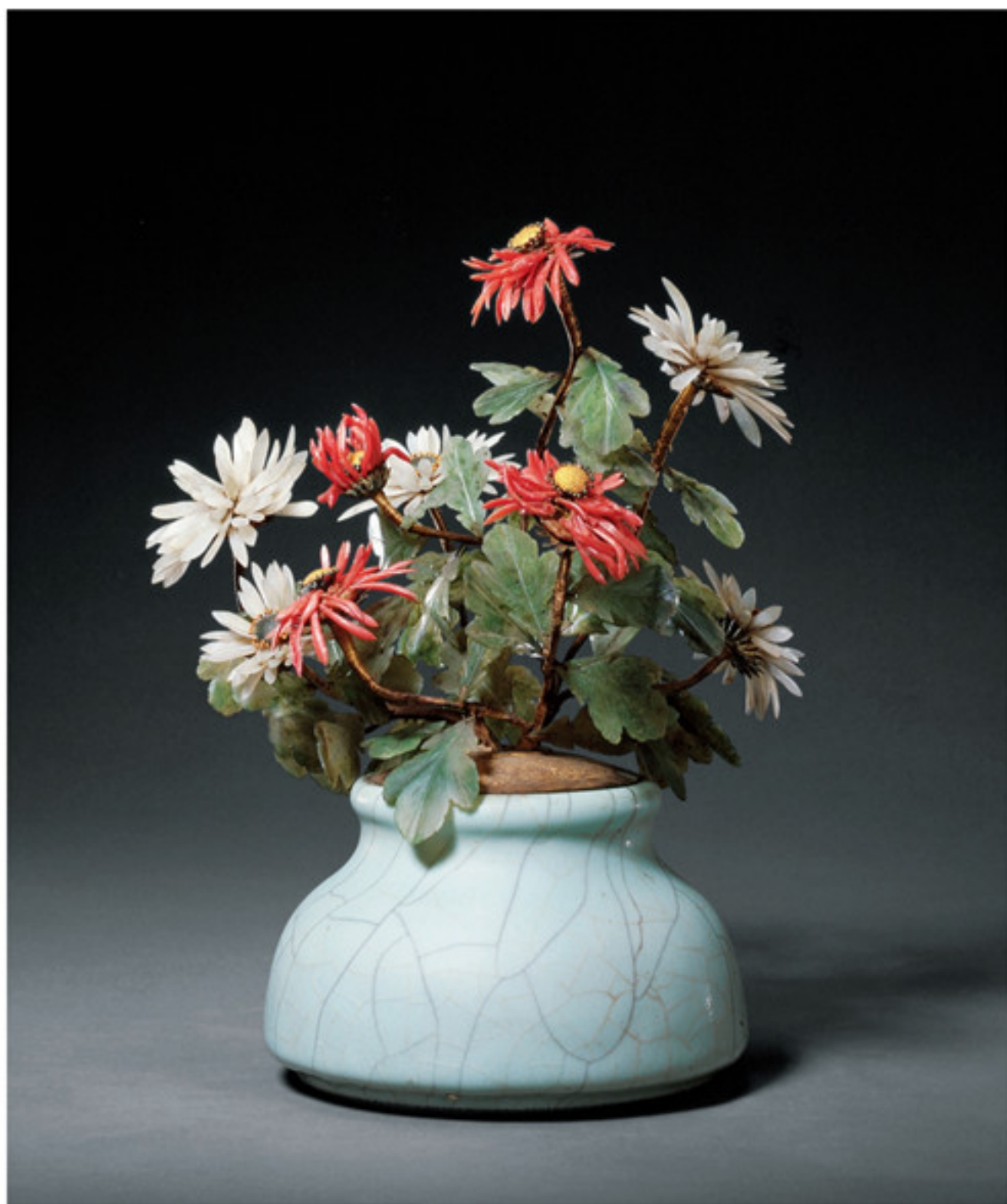
清 仿哥釉盆玉石菊花盆景 通高二四·二厘米 故宫博物院藏