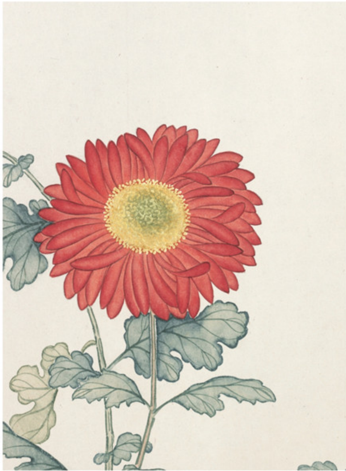
清 汪承霈 洋菊四十四种图局部之“鹤头丹” 纸本设色 故宫博物院藏