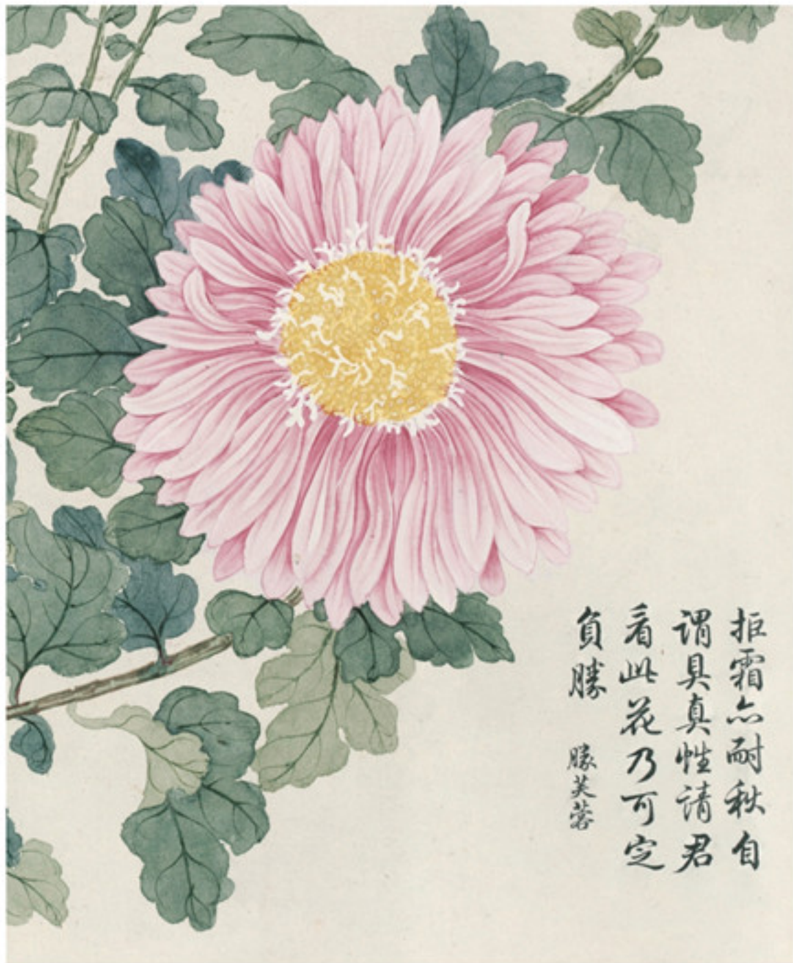
清 钱维城 洋菊图卷局部之“胜芙蓉” 纸本设色 故宫博物院藏