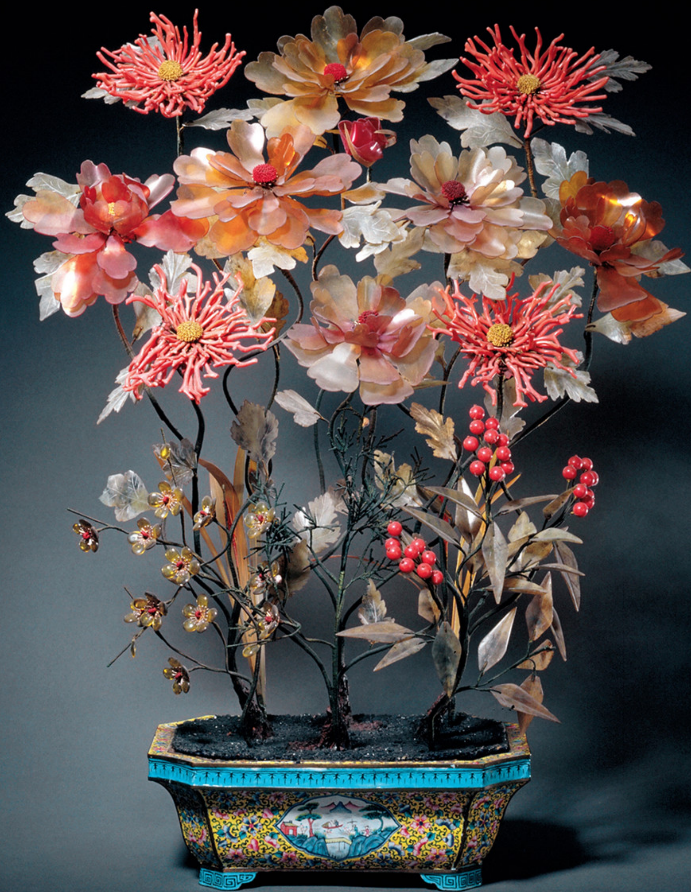
清 画珐琅委角长方盆花卉盆景 通高五三厘米 故宫博物院藏