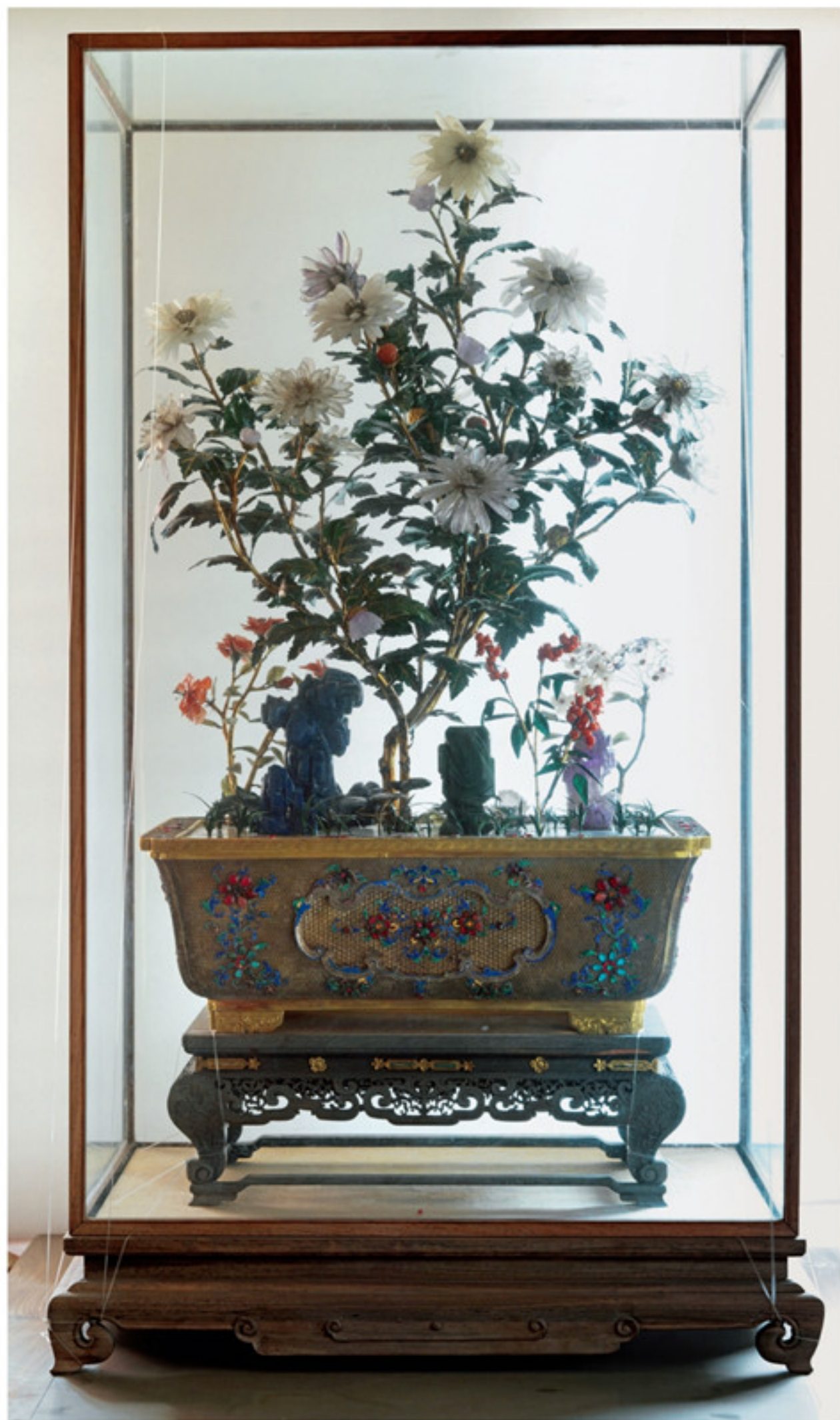
清 铜镀金嵌玉石玻璃长方盆玉石菊花盆景 故宫博物院藏 原陈设于养心殿