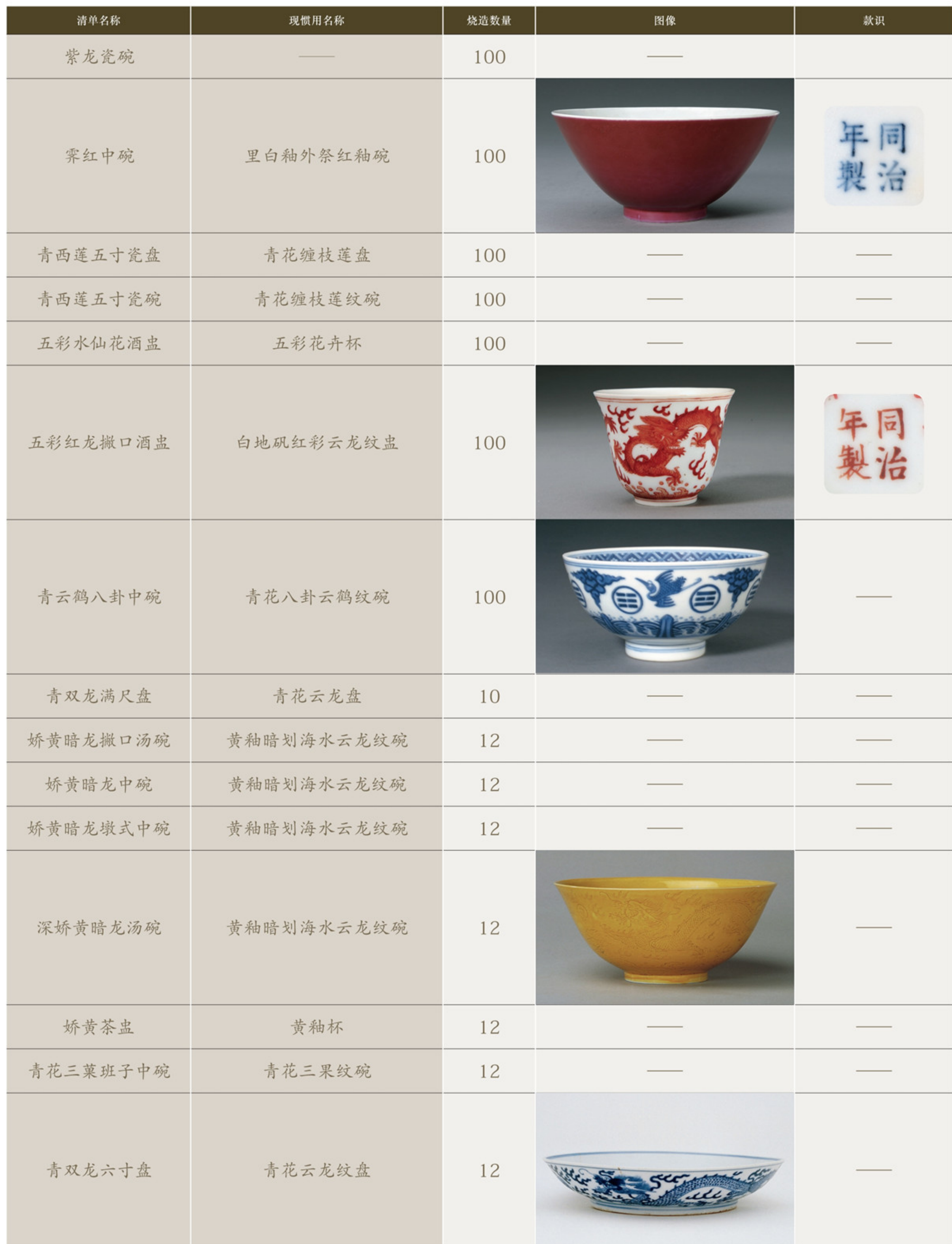
《同治四年分制造琢圆瓷器并奉文传办瓷祭器名目件数黄册》所记同治四年大运圆器烧造品种及数量情况表