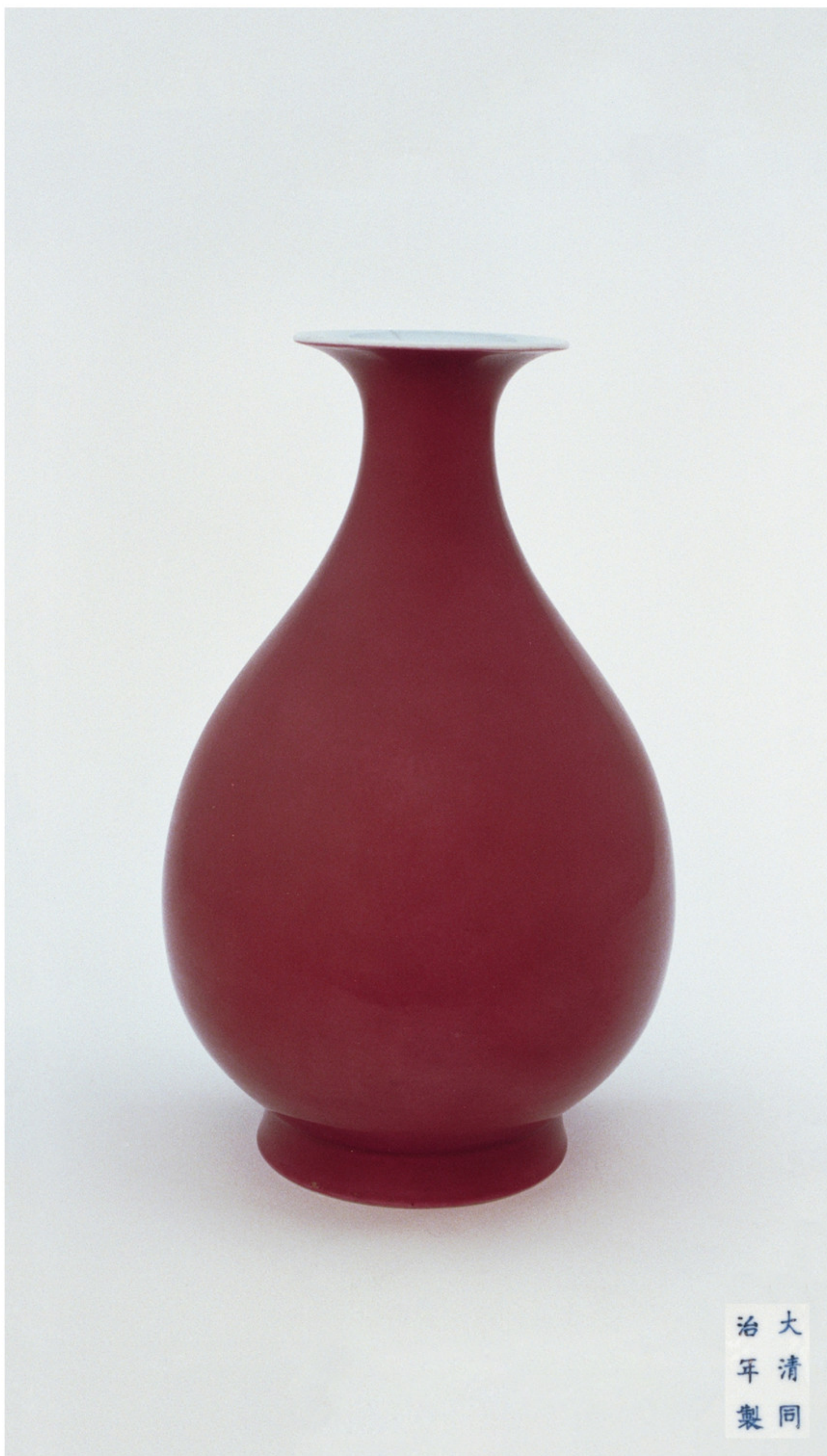
清同治 祭红釉玉壶春瓶及款识 高二九·六厘米 口径九·五厘米 故宫博物院藏

袭了前朝大运琢器式样，如仿哥釉八卦纹琮式瓶，琮式瓶源于宋代，是仿先秦礼器玉琮而烧制的一种瓶式，自雍正朝开始仿烧，乾隆朝仿哥釉琮式瓶烧造最为精美，至咸丰朝以后，仿哥釉器已烧不出哥釉的灰青色和酥光效果，釉色呈