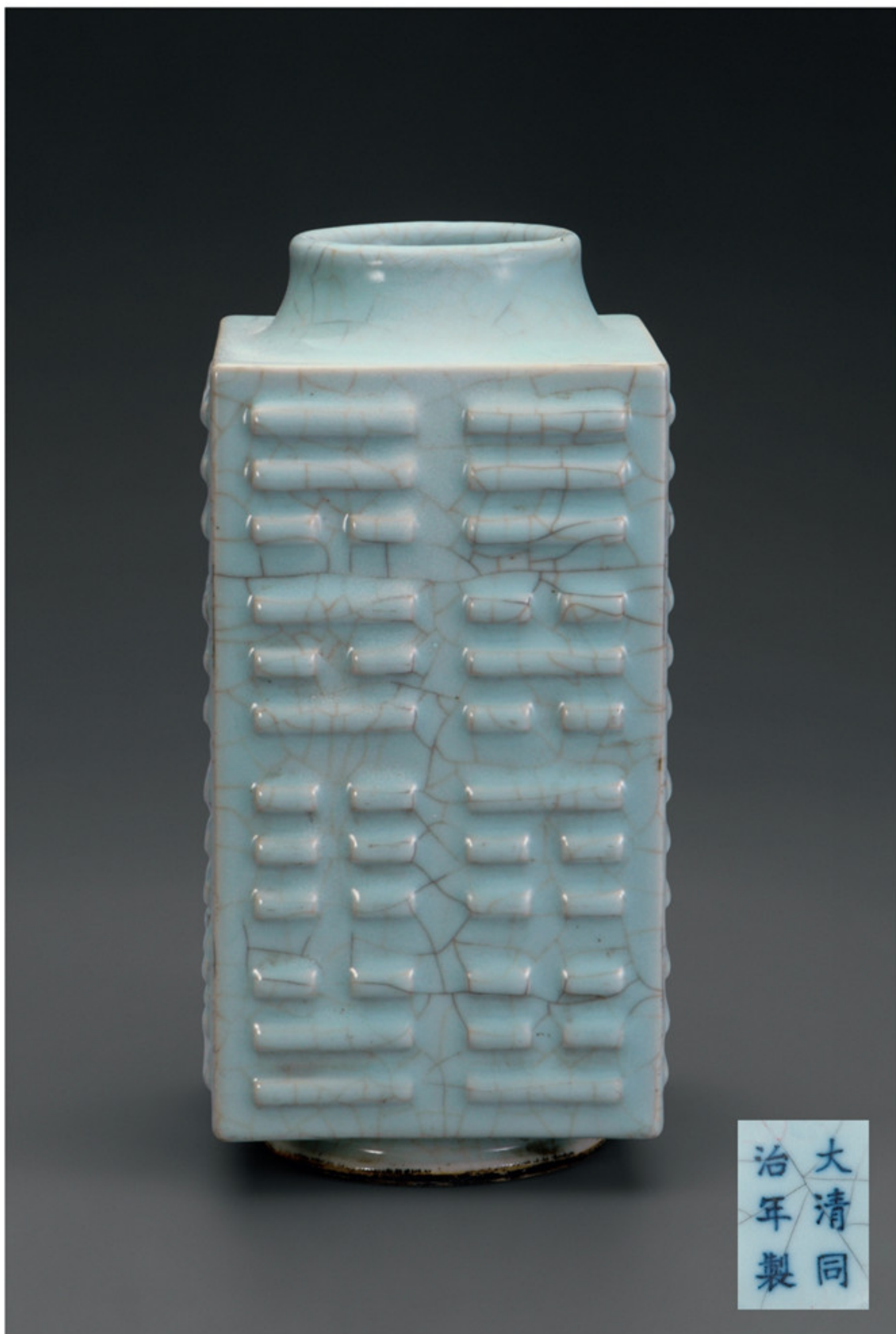
清同治 仿哥釉八卦纹琮式瓶及款识 高二八厘米 口径八·七厘米 足径一一·五厘米 故宫博物院藏