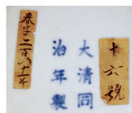
清同治 青花缠枝莲纹赏瓶及款识 高三九厘米 口径一〇厘米 故宫博物院藏