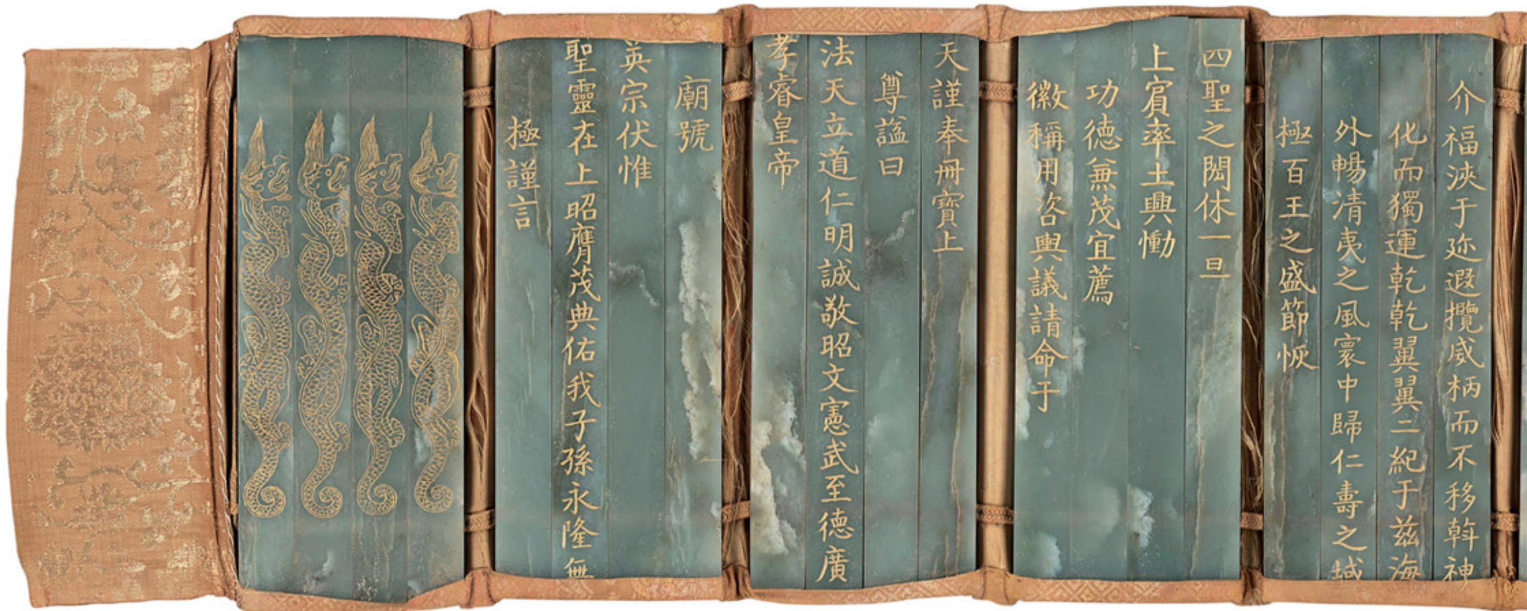
明天顺八年 青玉明英宗谥册