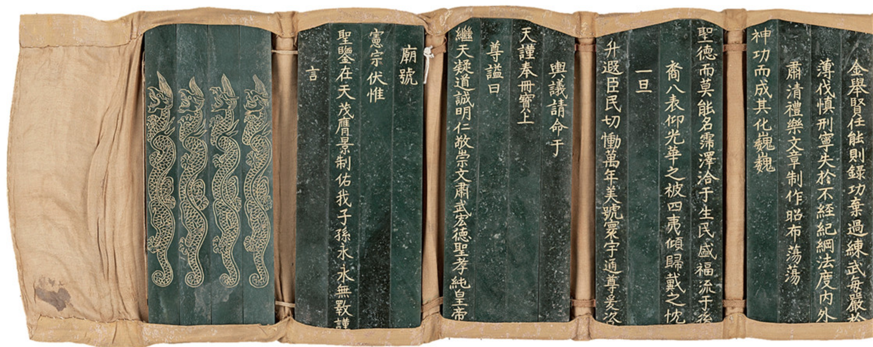
明成化二十三年 青玉明宪宗谥册 长二四·六厘米 宽九·五厘米 厚一·一厘米 故宫博物院藏