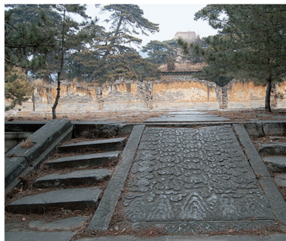
明宪宗茂陵陵恩殿遗迹