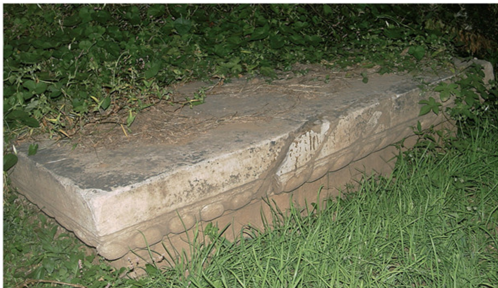
明万贵妃墓祭台石