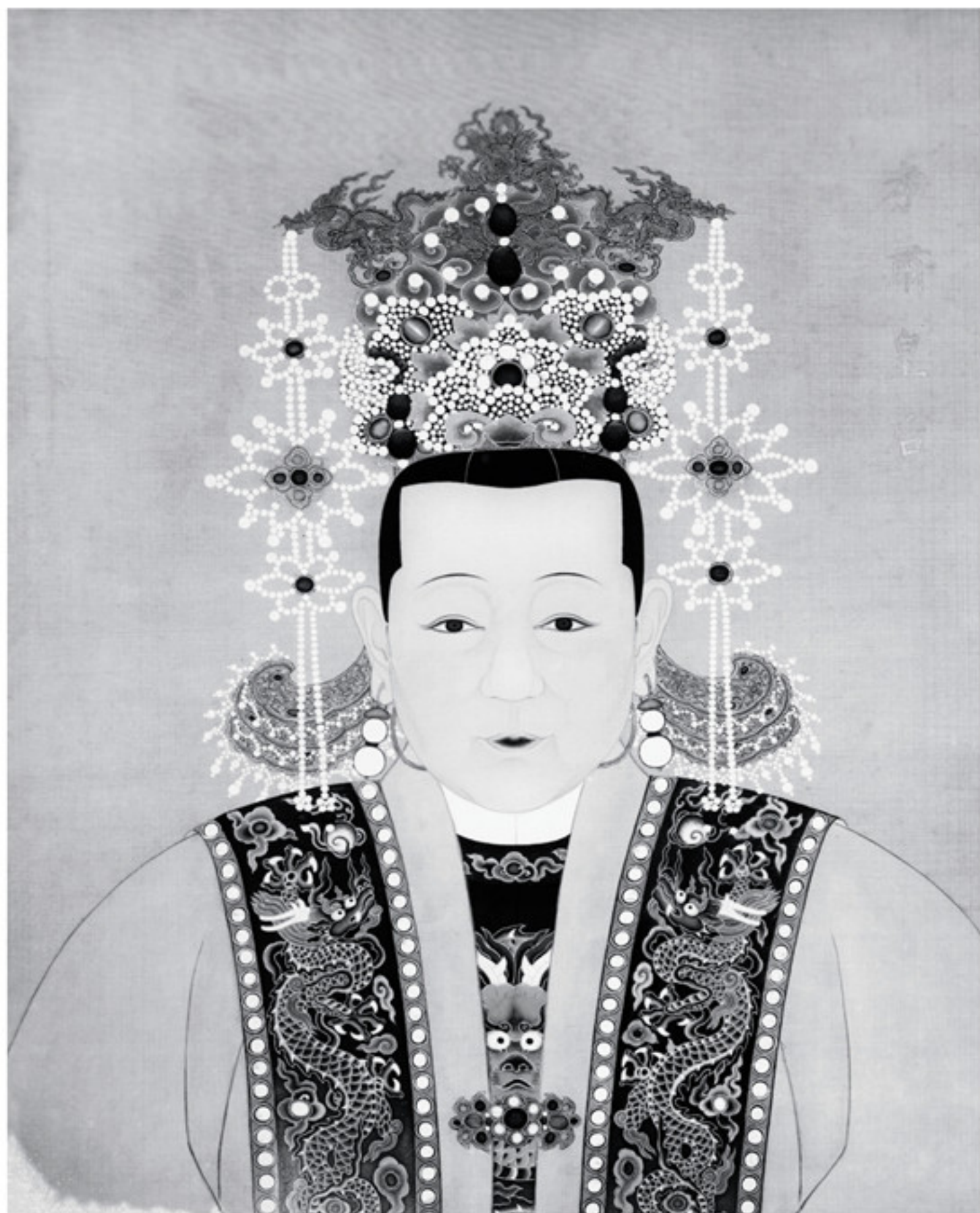
明孝肅皇后周氏（宪宗生母）像