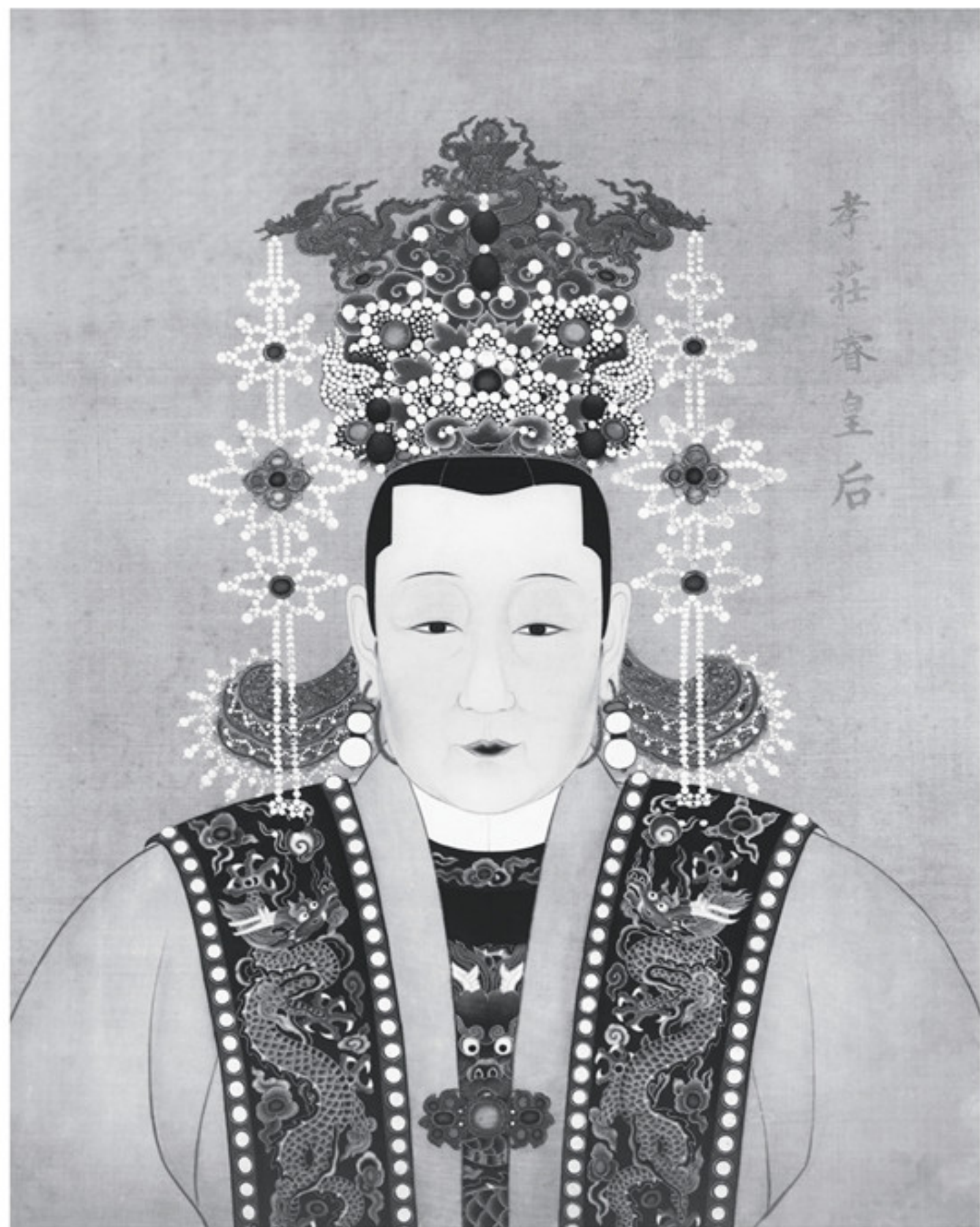
明孝庄睿皇后钱氏（英宗元配）像