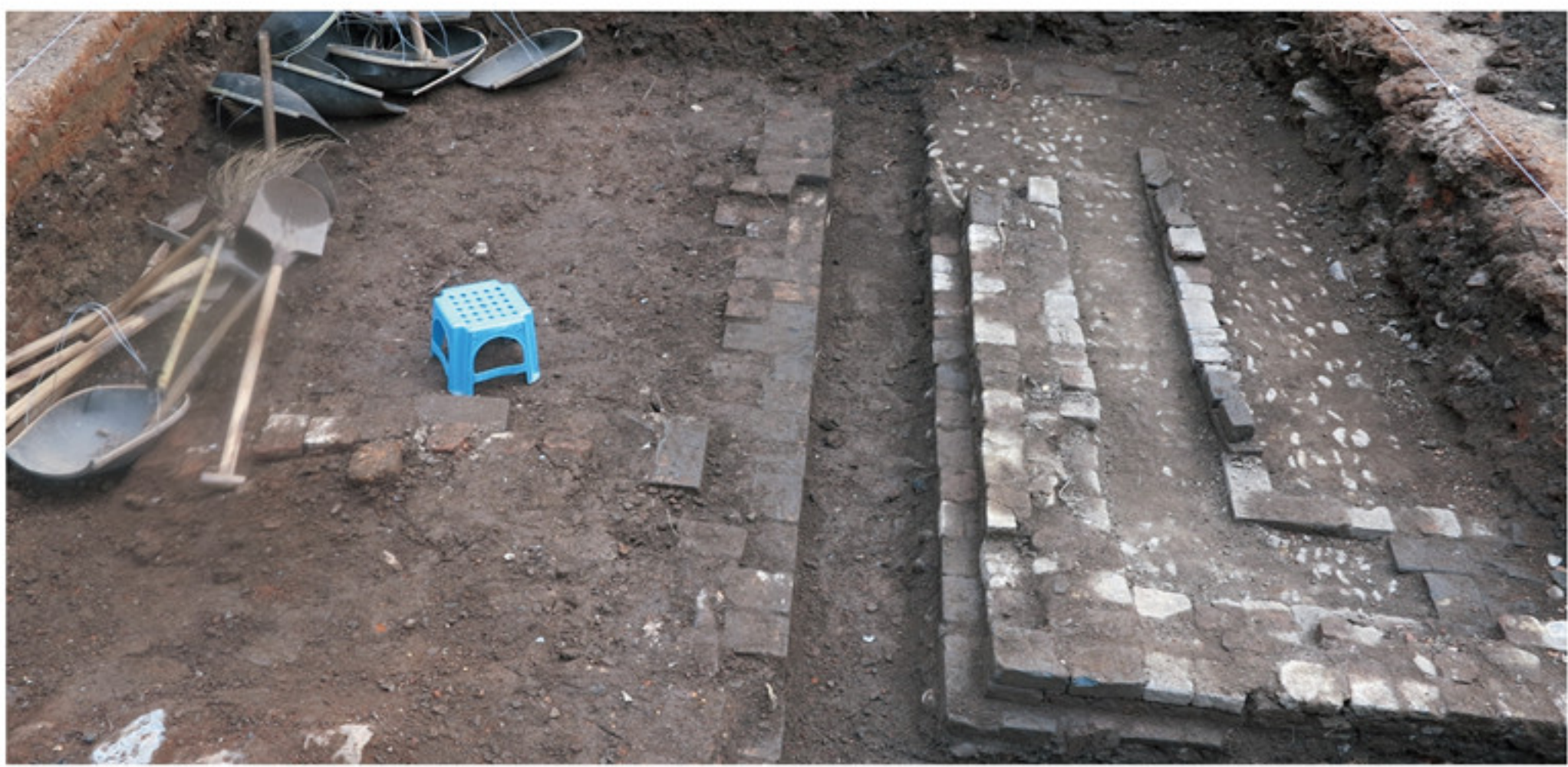
景德镇御窑厂遗址东围墙地区东门西南侧 T0103 内鹅卵石墙基 由东向西拍摄

二〇一四年七月至十二月，为了配合龙珠阁北麓保护房改扩建工程项目的顺利进行，景德镇市陶瓷考古研究所等