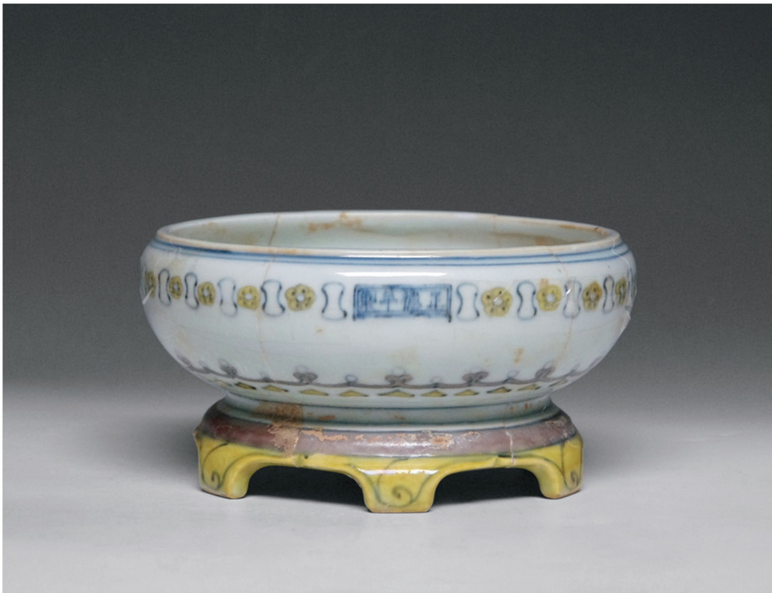
明正德 斗彩六足盆托 景德镇市陶瓷考古研究所藏

代延续较长，序列较为完整，种类比较齐全，可谓御窑厂历次发掘工作中出土遗物最为丰富的一次。