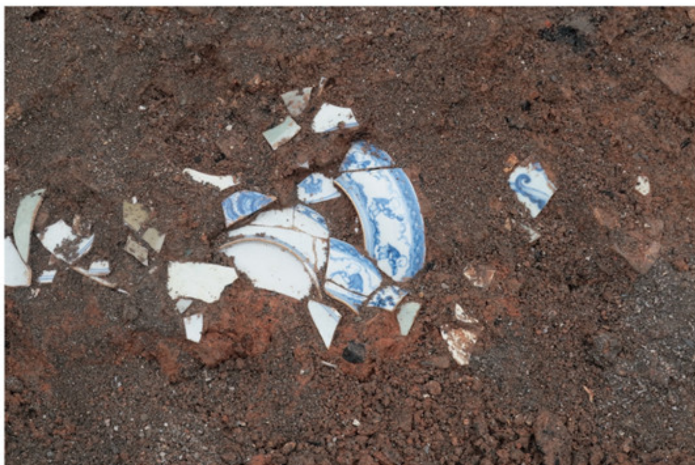
景德镇御窑厂遗址龙珠阁北麓成化时期青花婴戏纹盘出土现场