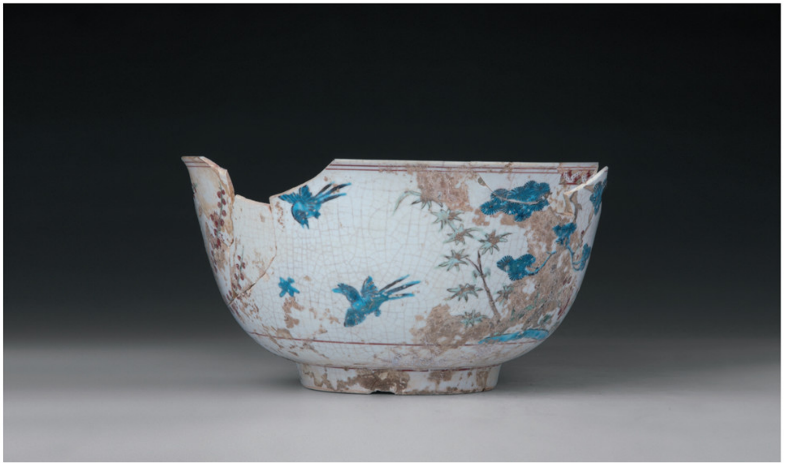
明嘉靖 五彩松竹梅雀鸟纹深腹大碗 景德镇市陶瓷考古研究所藏