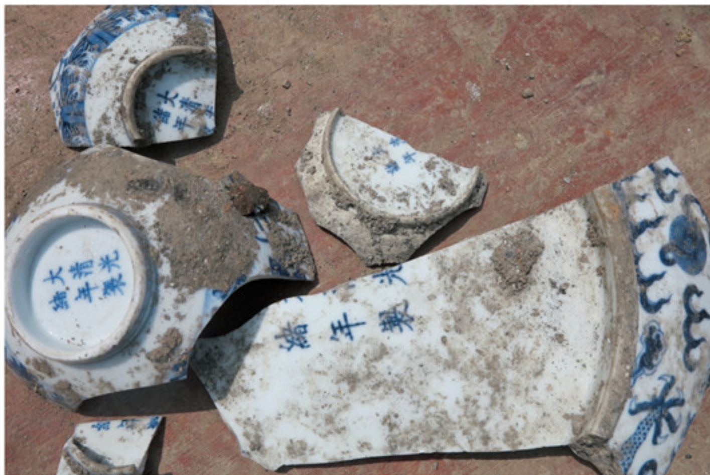
景德镇御窑厂遗址龙珠阁北麓出土“大清光绪年制”款青花碗、盘瓷片