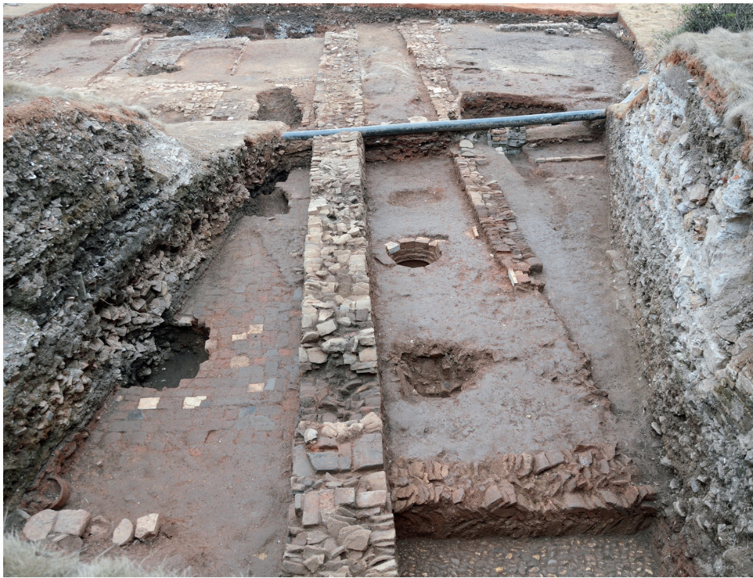
景德镇御窑厂遗址毕家弄东侧 F6 南墙发掘现场 自西向东拍摄

出土遗物的时代始自元朝，历经明洪武、永乐、宣德，到成化、弘治、正德、嘉靖、万历、天启、崇祯，再到清代的康熙、雍正、乾隆、嘉庆，直至同治、光绪、宣统，民国江西瓷业公司、建国瓷厂等各个时期。此次发掘出土遗物时