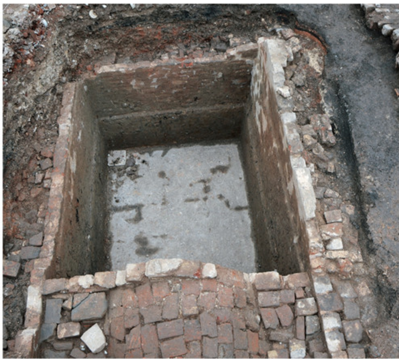
景德镇御窑厂遗址毕家弄东侧晒架塘 C1 自东向西拍摄