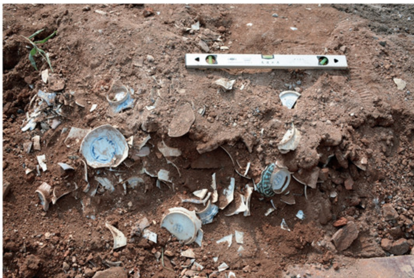
景德镇御窑厂遗址龙珠阁北麓成化时期遗物堆积 自南向北拍摄