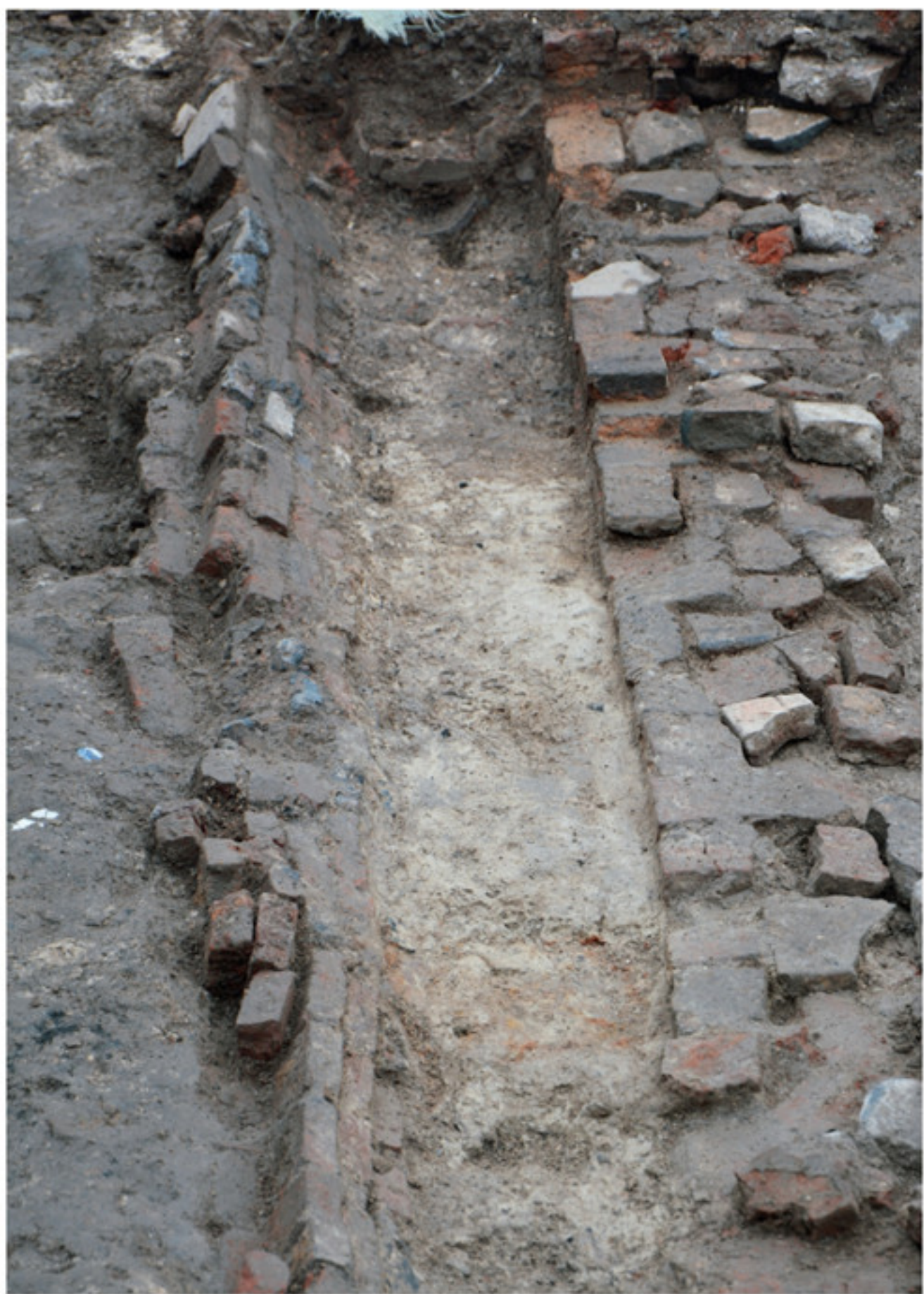
景德镇御窑厂遗址毕家弄东侧排水沟 G1 发掘现场 自西向东拍摄