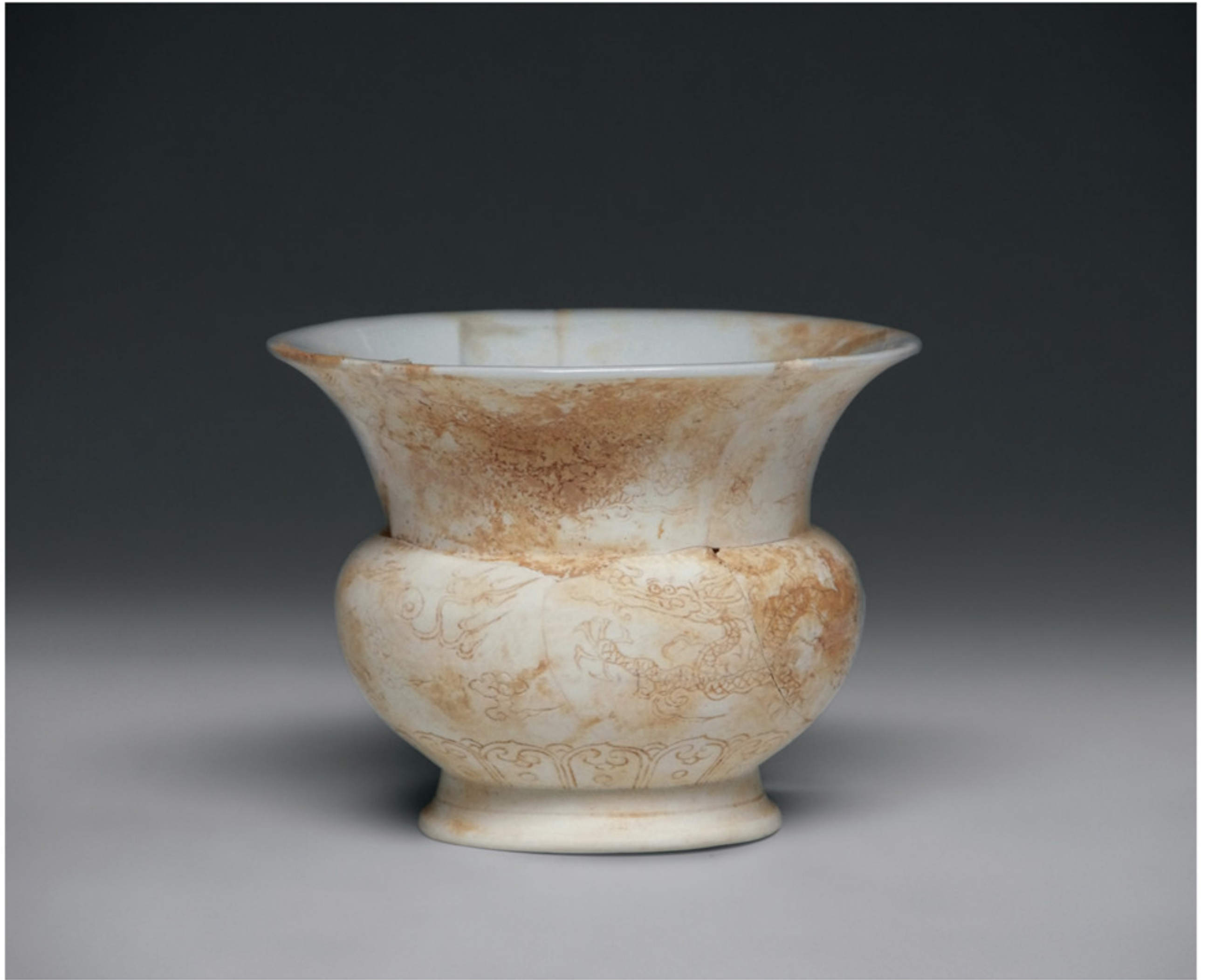
明正德 涩胎暗刻云龙纹渣斗及款识 景德镇市陶瓷考古研究所藏