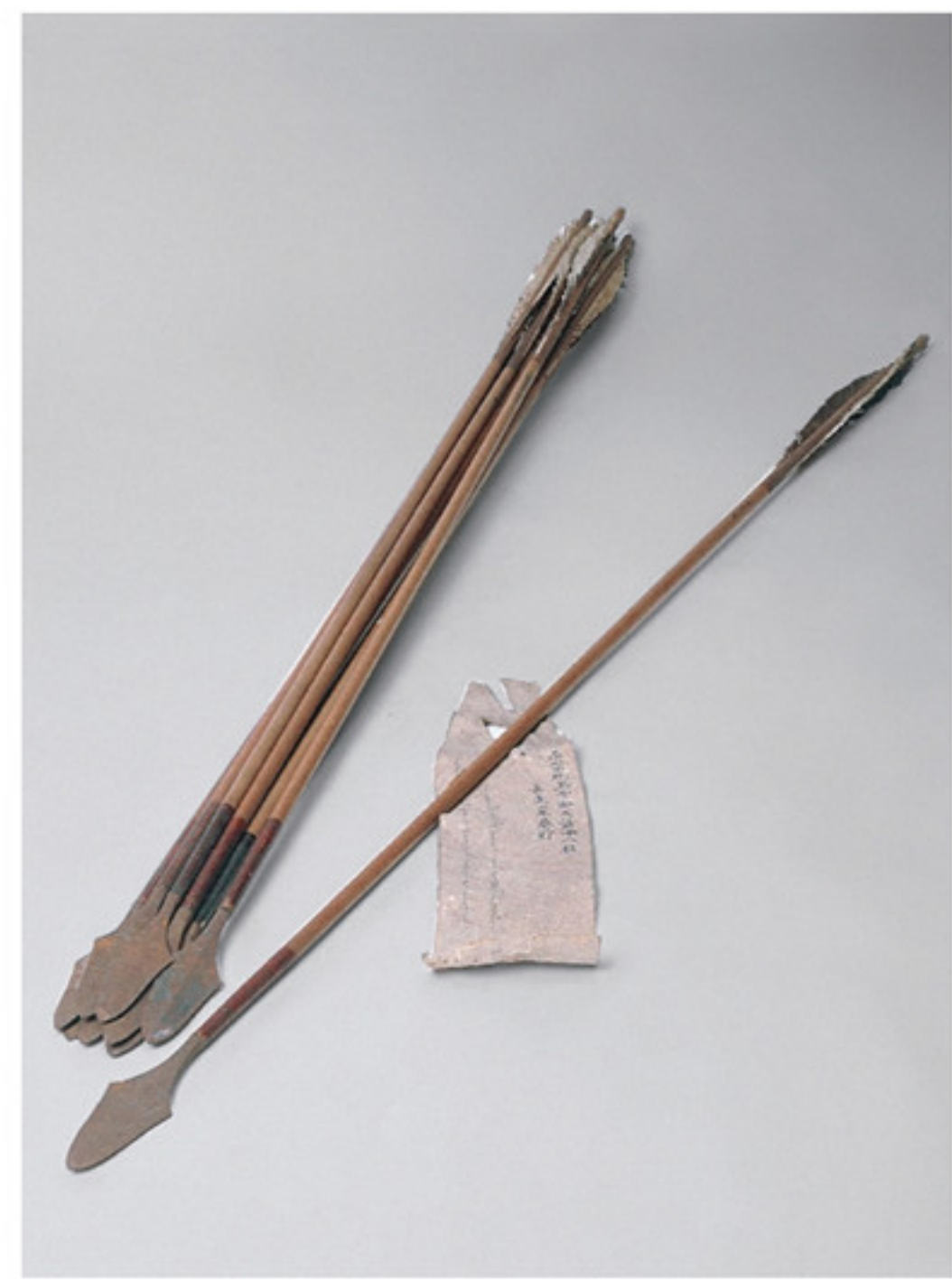
乾隆帝御用鈇箭 故宫博物院藏