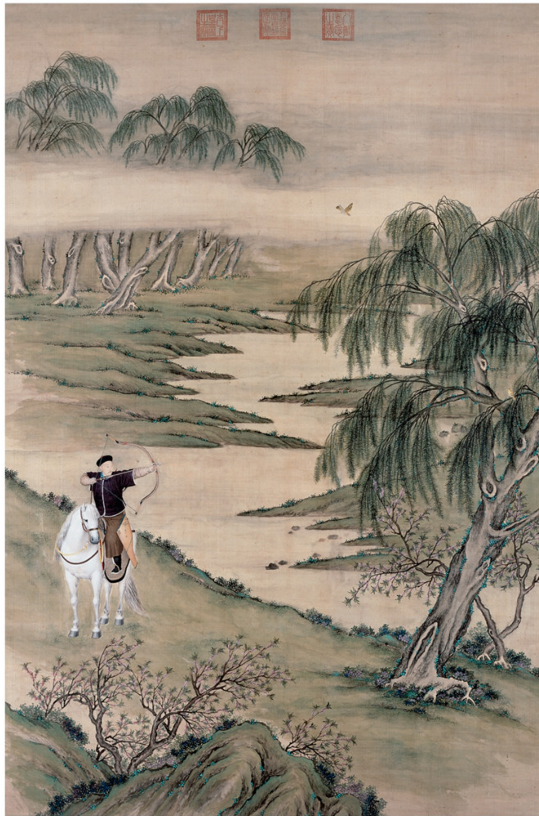
清人绘 弘历弋飞图轴 绢本设色 纵二五八·三厘米 横一七一·八厘米 故宫博物院藏