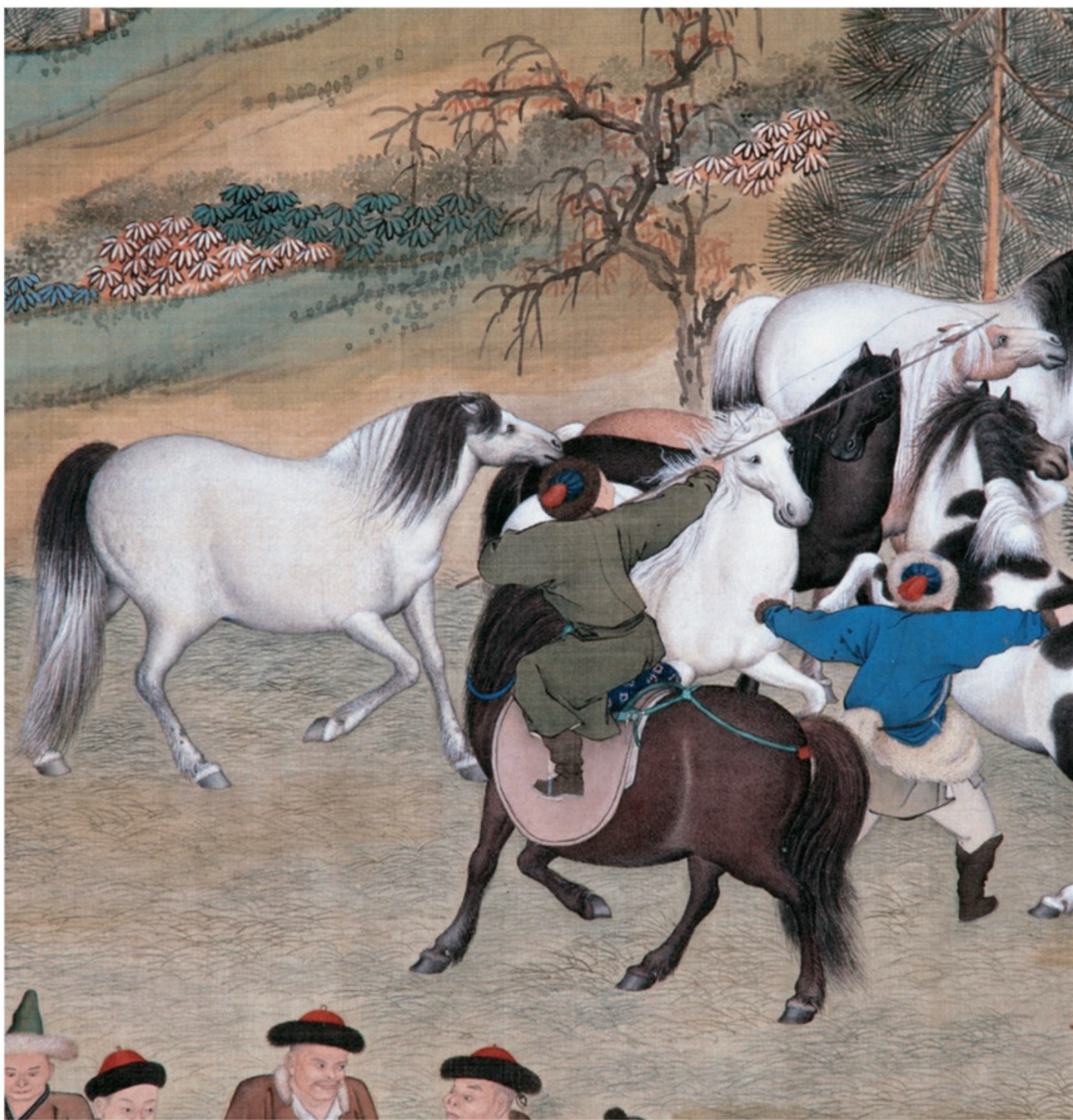
塞宴四事图局部之教馱

带着这次对蒙、回诸部共同参与的「塞 宴四事」的回忆，乾隆皇帝率领他的万众 人马朝着会归峪的方向前进。半个月后从 东崖口出围，于九月二十五日在张三营行 宫设宴诸蒙古后，结束了这次难忘的木兰 秋狩。