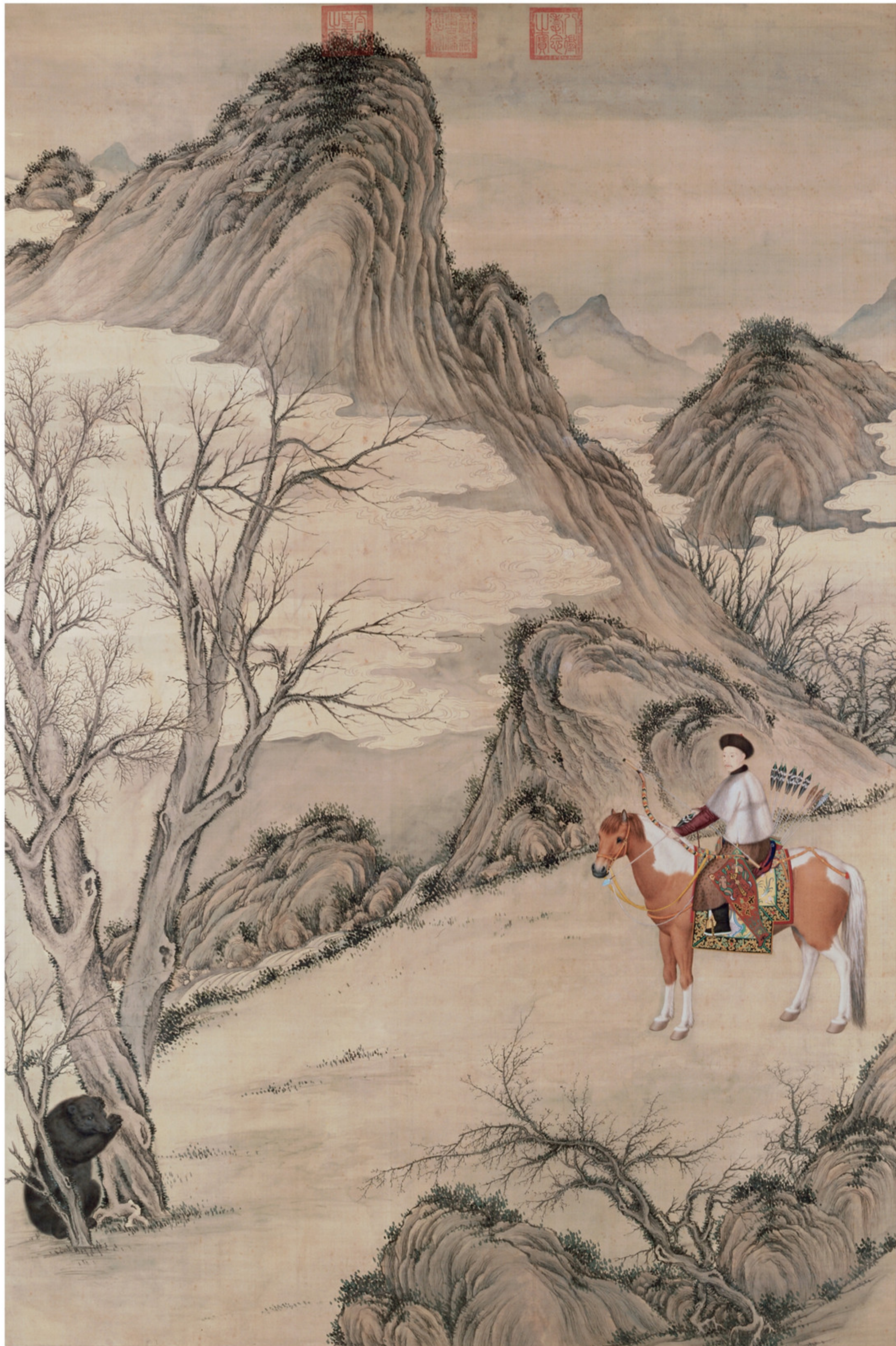
清人绘 弘历骑熊图像轴 绢本设色 纵二五九厘米 横一七一·六厘米 故宫博物院藏