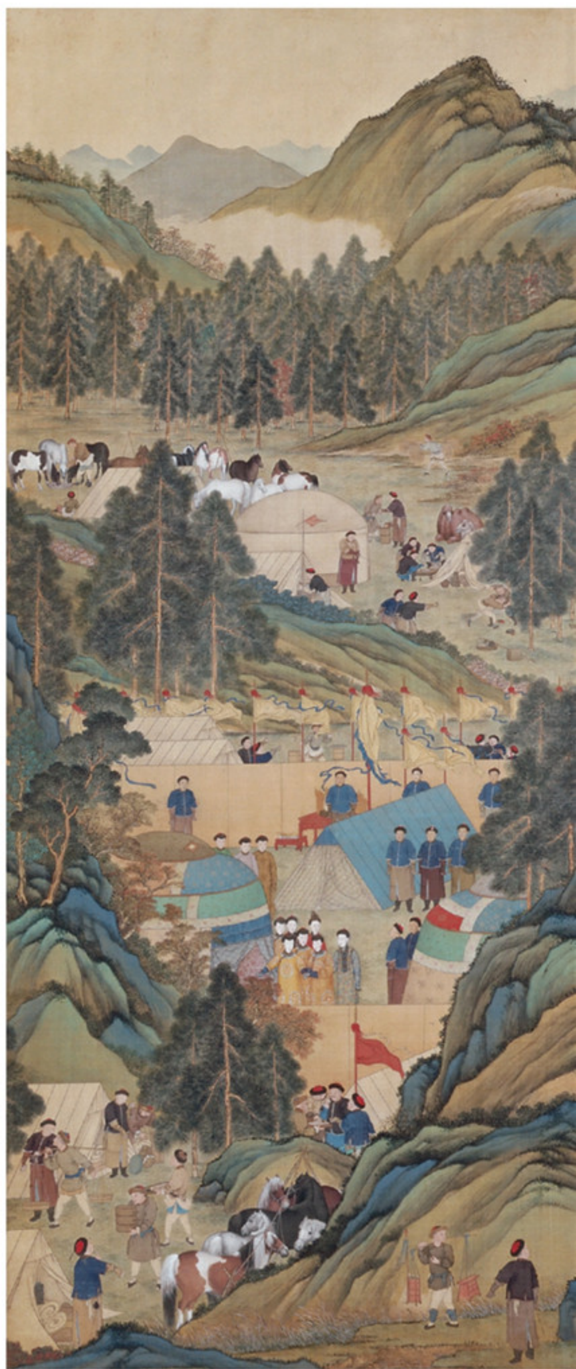
清 郎世宁等绘 塞宴四事图横幅 绢本设色 纵三二〇厘米 横五六〇厘米 故宫博物院藏

下面，我们以乾隆二十五年（一七六〇年）九月初九日举行的「塞宴四事」前后史实为据，参考保存在故宫博物院中郎世宁等人绘制的大型院本纪实绘画《塞宴四事图》，可以了解这种蒙古宴会当年在木兰围场的盛况。