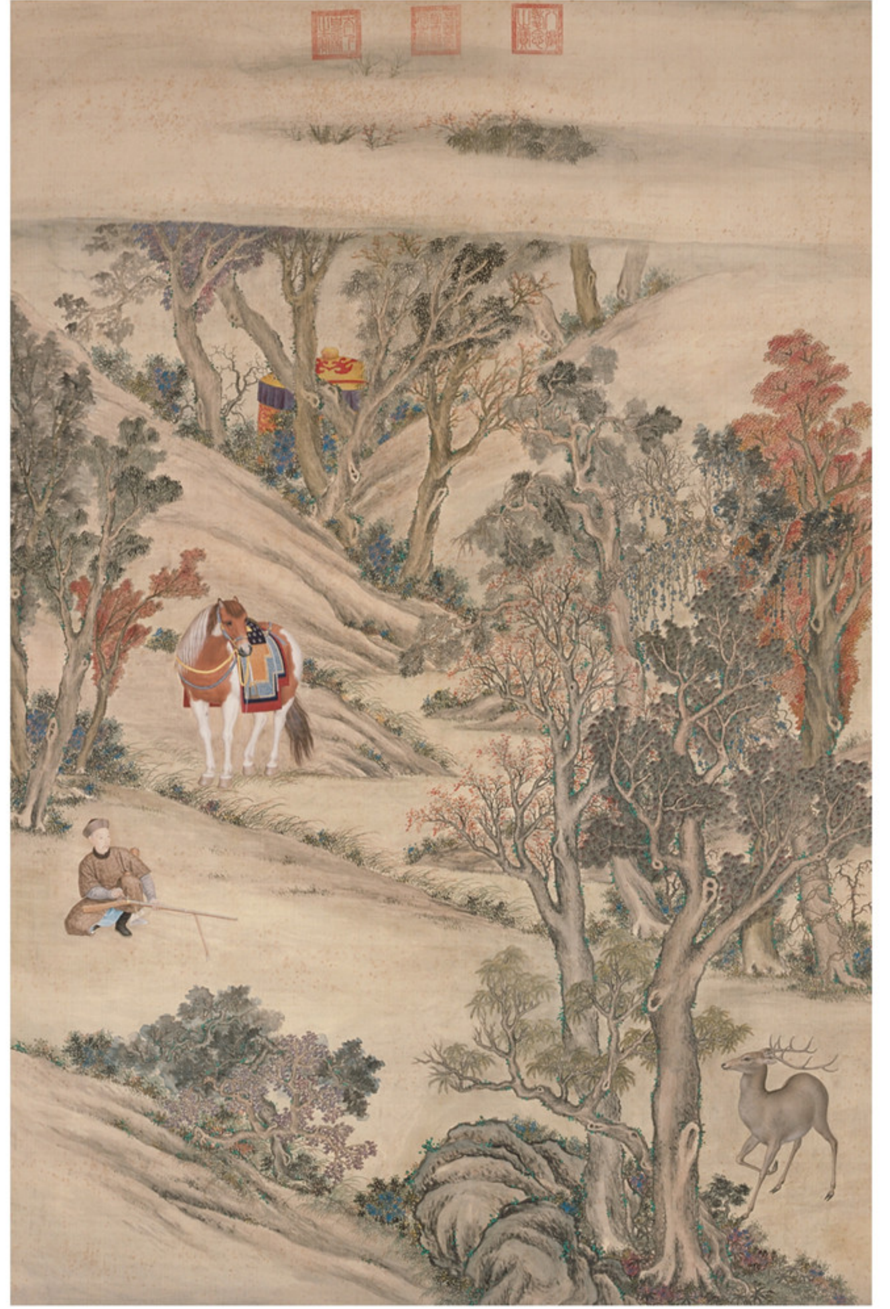
清人绘 弘历击鹿图轴 绢本设色 纵二五九厘米 横一七二厘米 故宫博物院藏