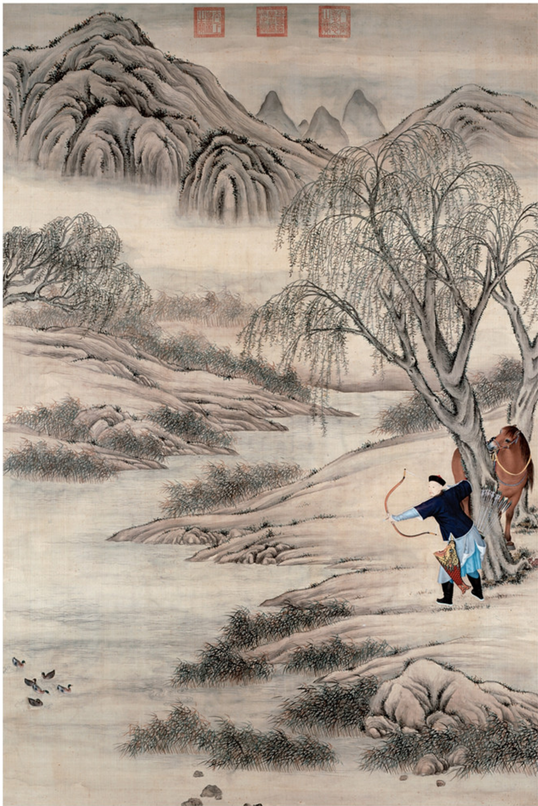
清人绘 弘历弋凫图轴 绢本设色 纵二五九厘米 横一七二厘米 故宫博物院藏