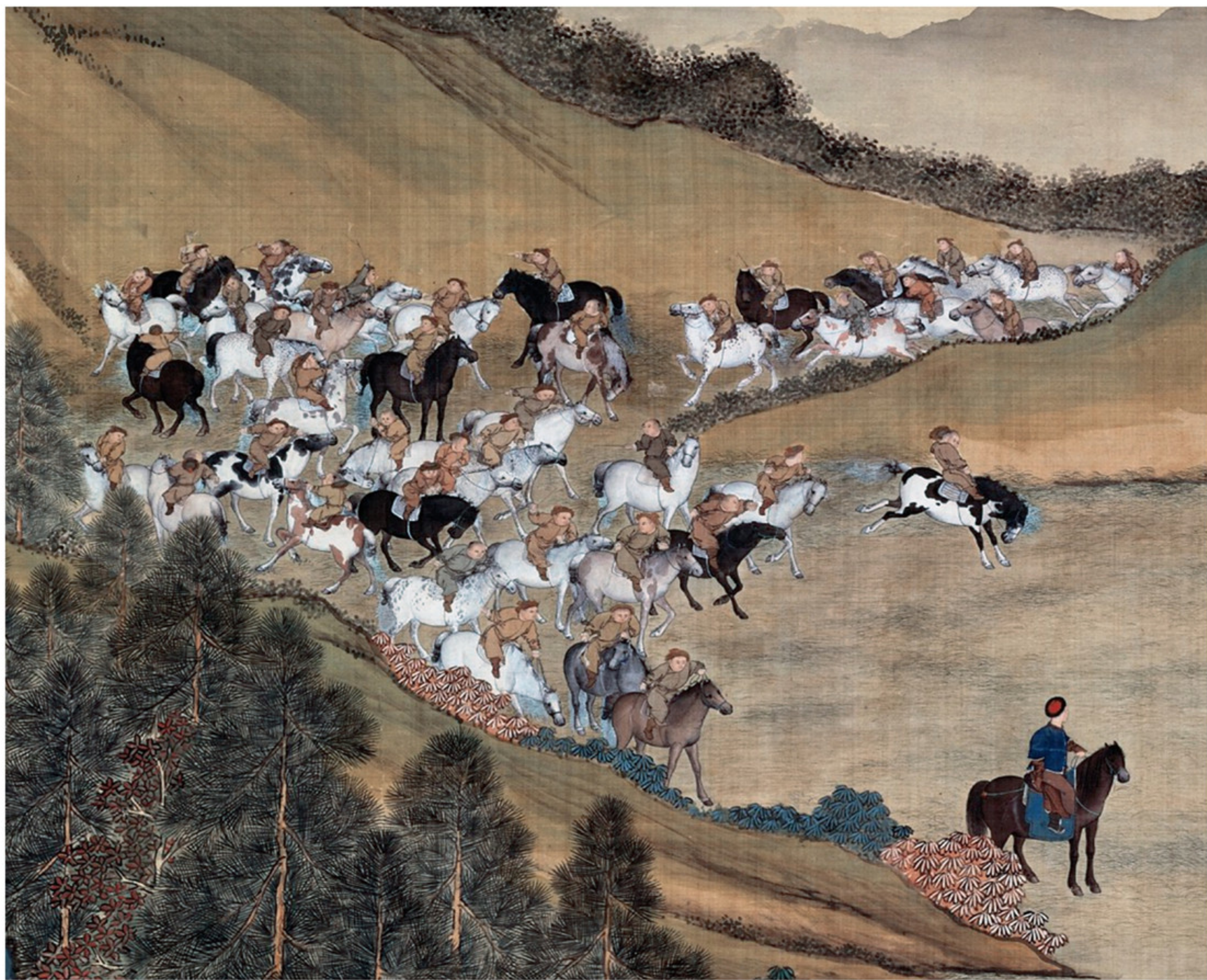
塞宴四事图局部之诈马