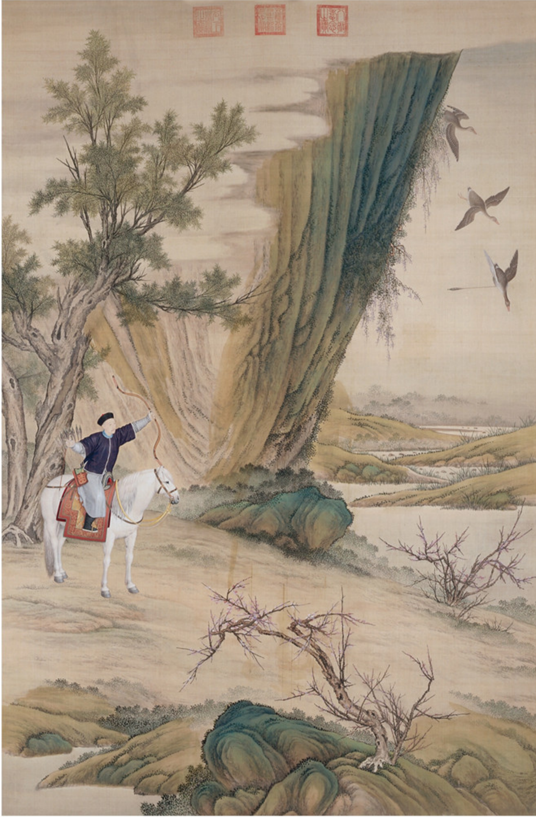
清人绘 弘历落雁图像轴 绢本设色 纵二五九厘米 横一七一·六厘米 故宫博物院藏