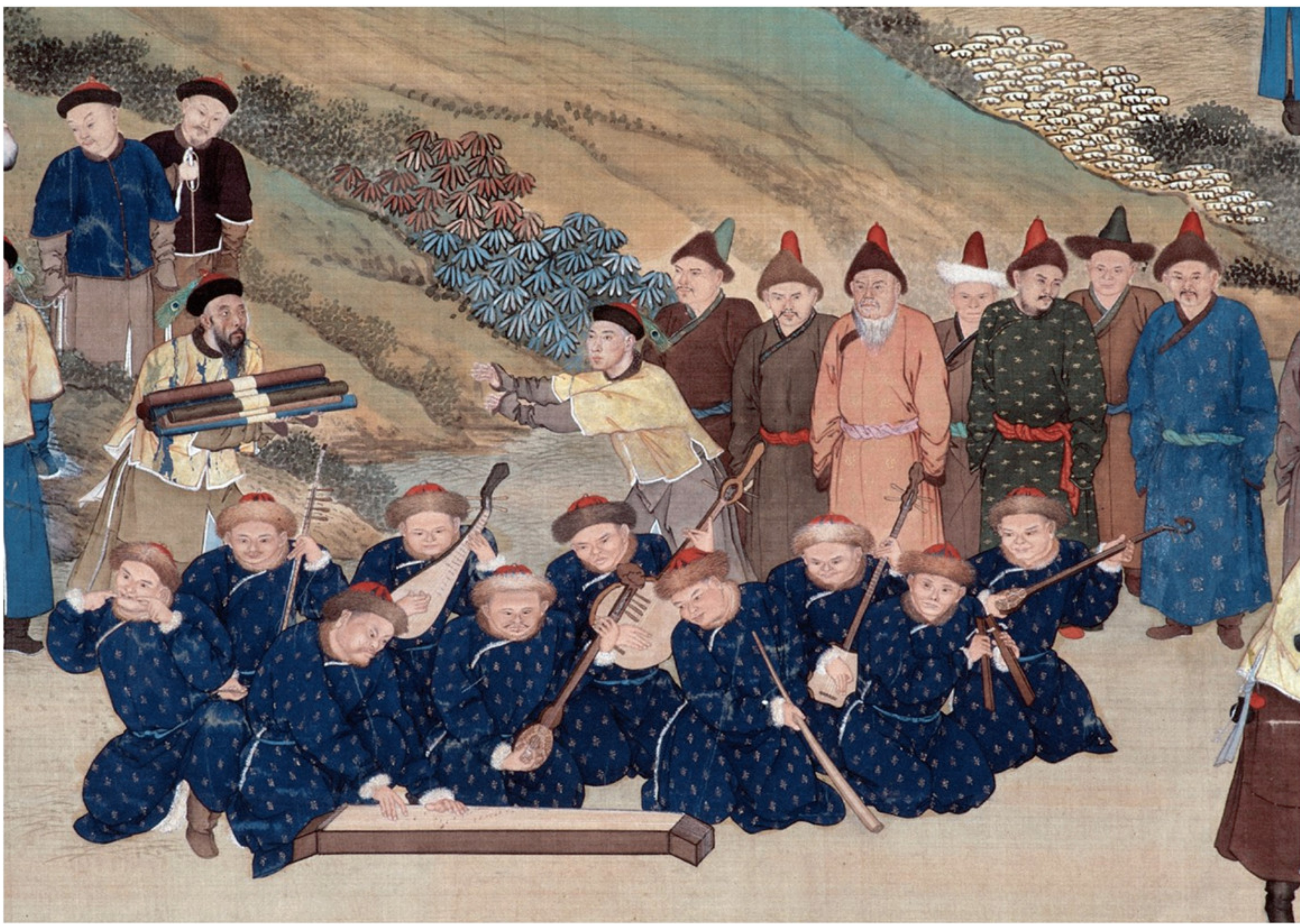
塞宴四事图局部之蒙古什榜人

重阳节这天，扎萨克蒙古先期准备「塞宴四事」所需，计有：蒙古包六座、白骆驼十八只、鞍马十八匹、驢马（无鞍辔马）一百六十二匹、牛十八头、羊一百六十二只、酒八十一坛、食品二十七席、布库（相扑者）二十人、什榜（蒙古乐）九十人、骑生驹（骑生驹手）二十人、生驹（三岁以下幼马）无定数、逞技马二百五十四匹。（《承德府志》）宴会开始前，武备院司事人员将蒙古王公进贡之蒙古包和帐房在御营门外札设好，马驼牛羊等牲畜列于道路左侧，等待皇帝观瞻。此时，皇帝从御营出，大驾行至帐殿。理藩院官员引导蒙古王公、台吉跪迎。由于西师底定，跪在两旁的除了先前于十九年（一七五四年）归附的杜尔伯特亲王策凌乌巴什及其他厄鲁特蒙古上层以外，还有首次入围的回部郡王霍集斯及诸伯克人等。