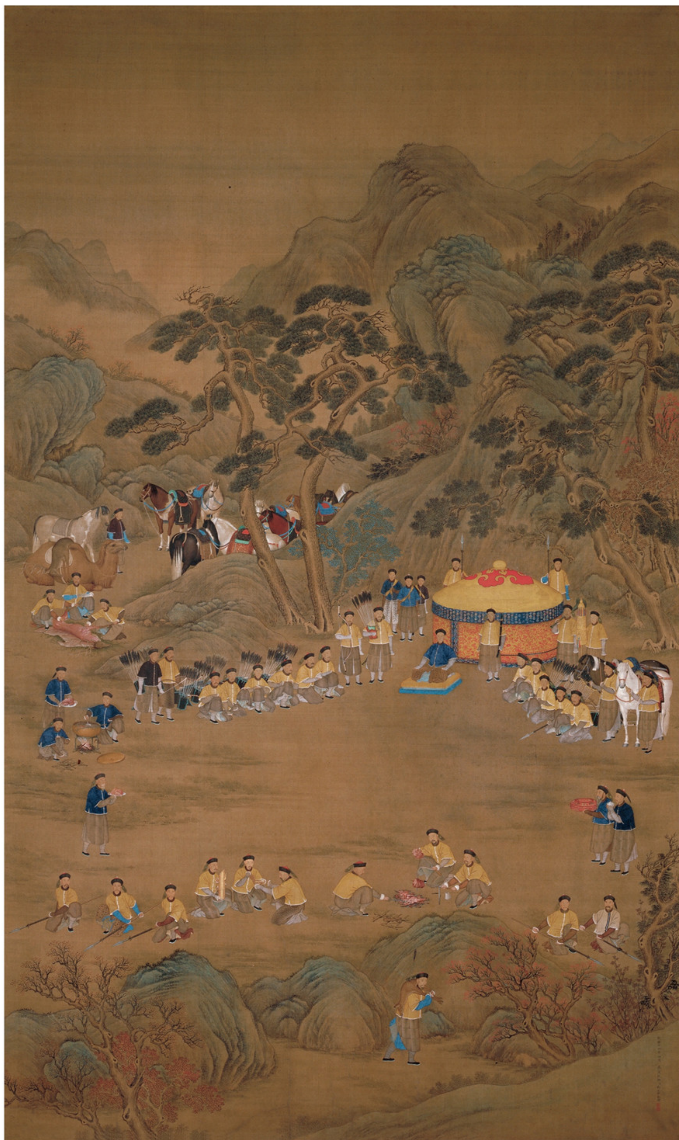
清 郎世宁 乾隆围猎聚餐图轴 绢本设色 纵三一七·五厘米 横一九〇厘米 故宫博物院藏