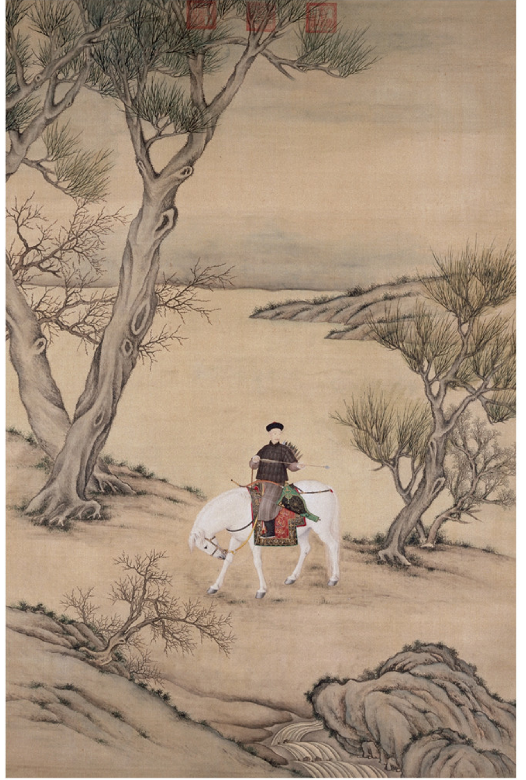
清人绘 弘历挟矢图像轴 绢本设色 纵二五九厘米 横一七二·二厘米 故宫博物院藏