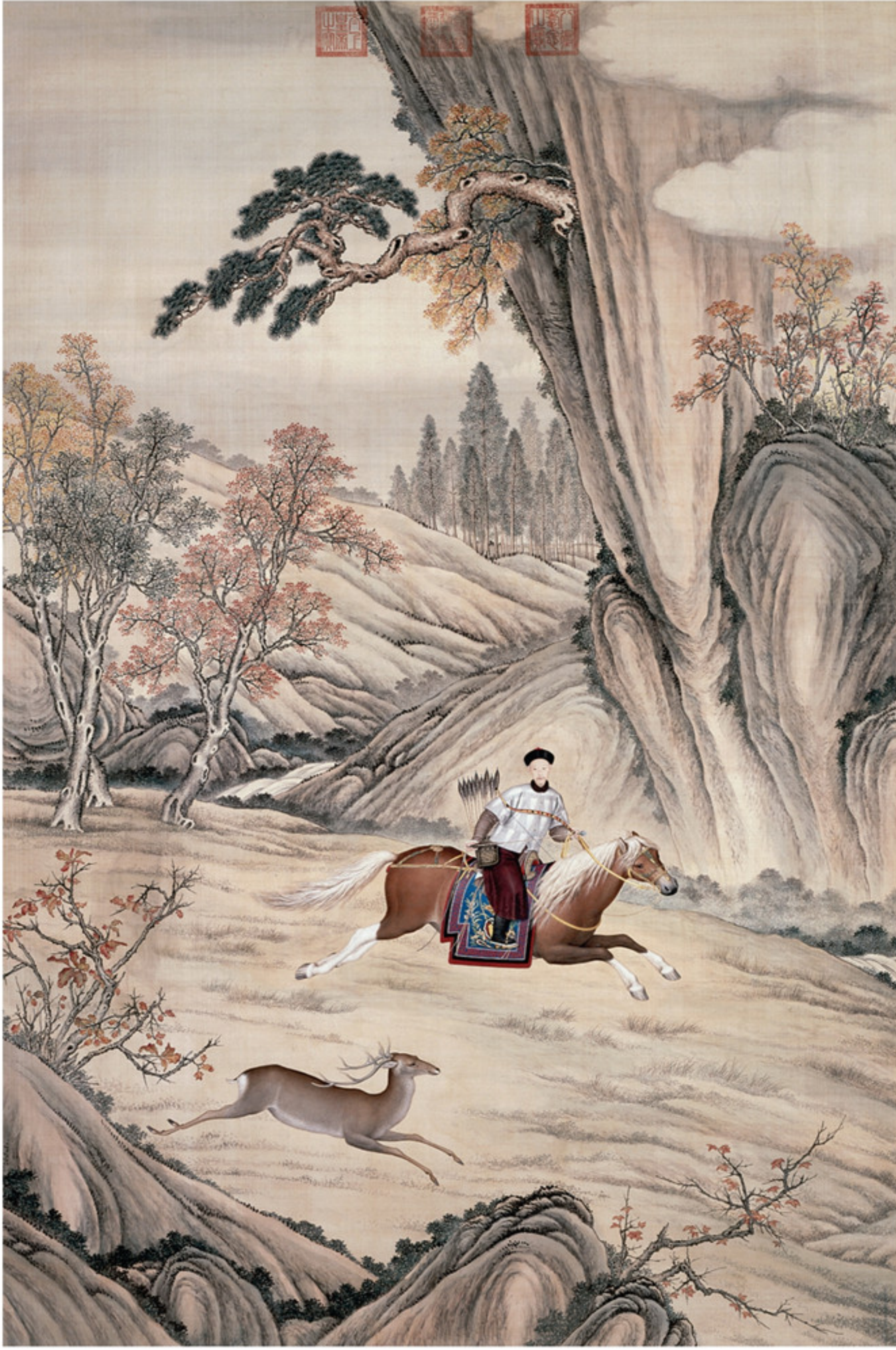
清人绘 弘历逐鹿图轴 绢本设色 纵二五九厘米 横一七一·八厘米 故宫博物院藏