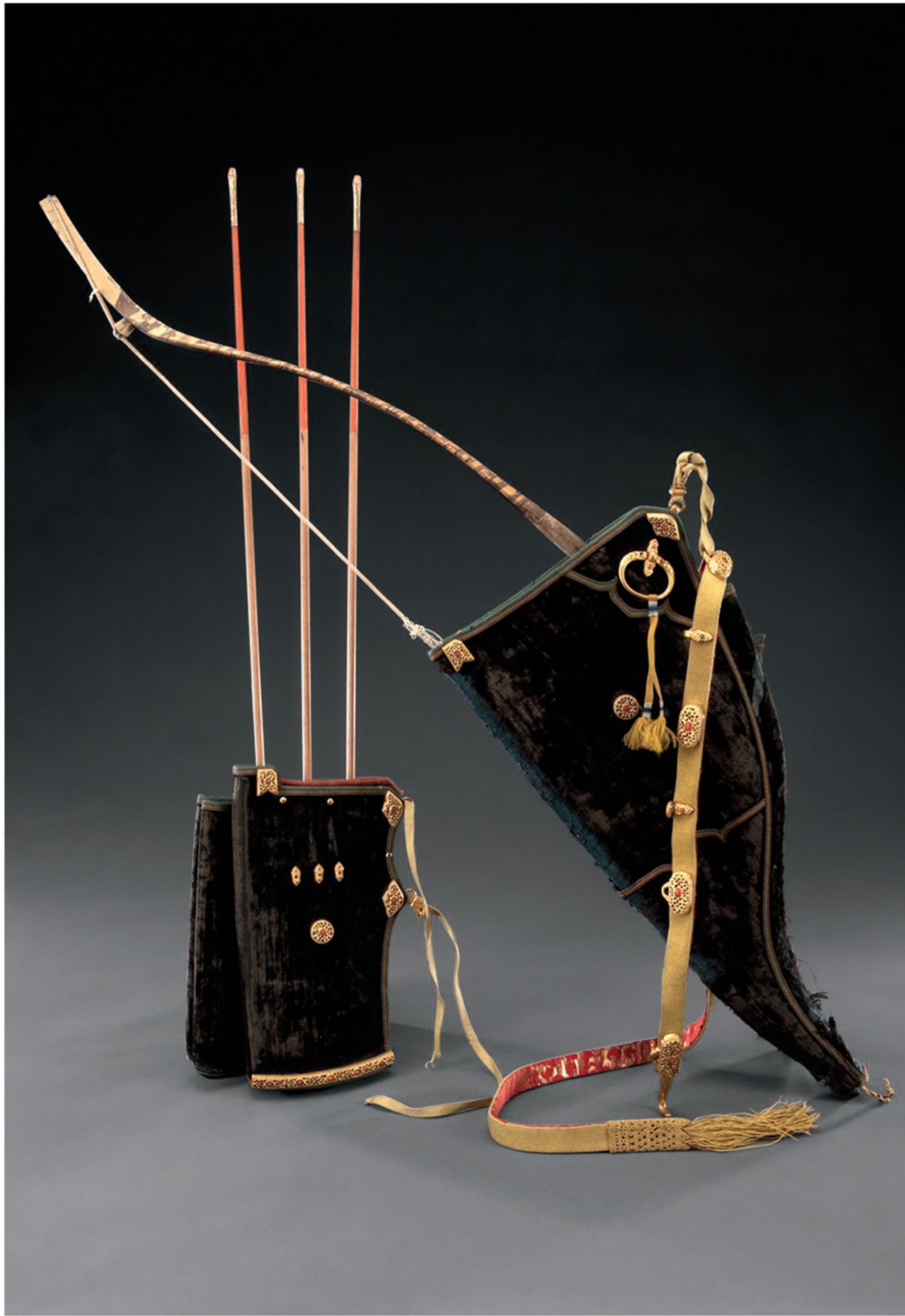
皇子用弓箭 故宫博物院藏