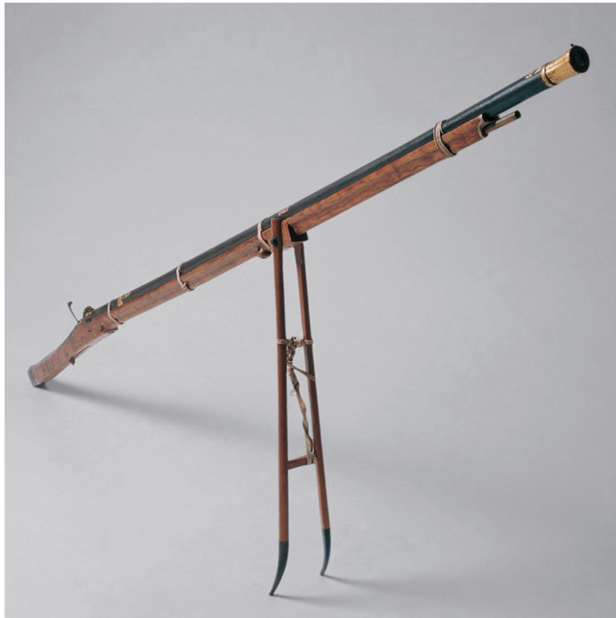
乾隆帝御用“奇准神枪” 故宫博物院藏