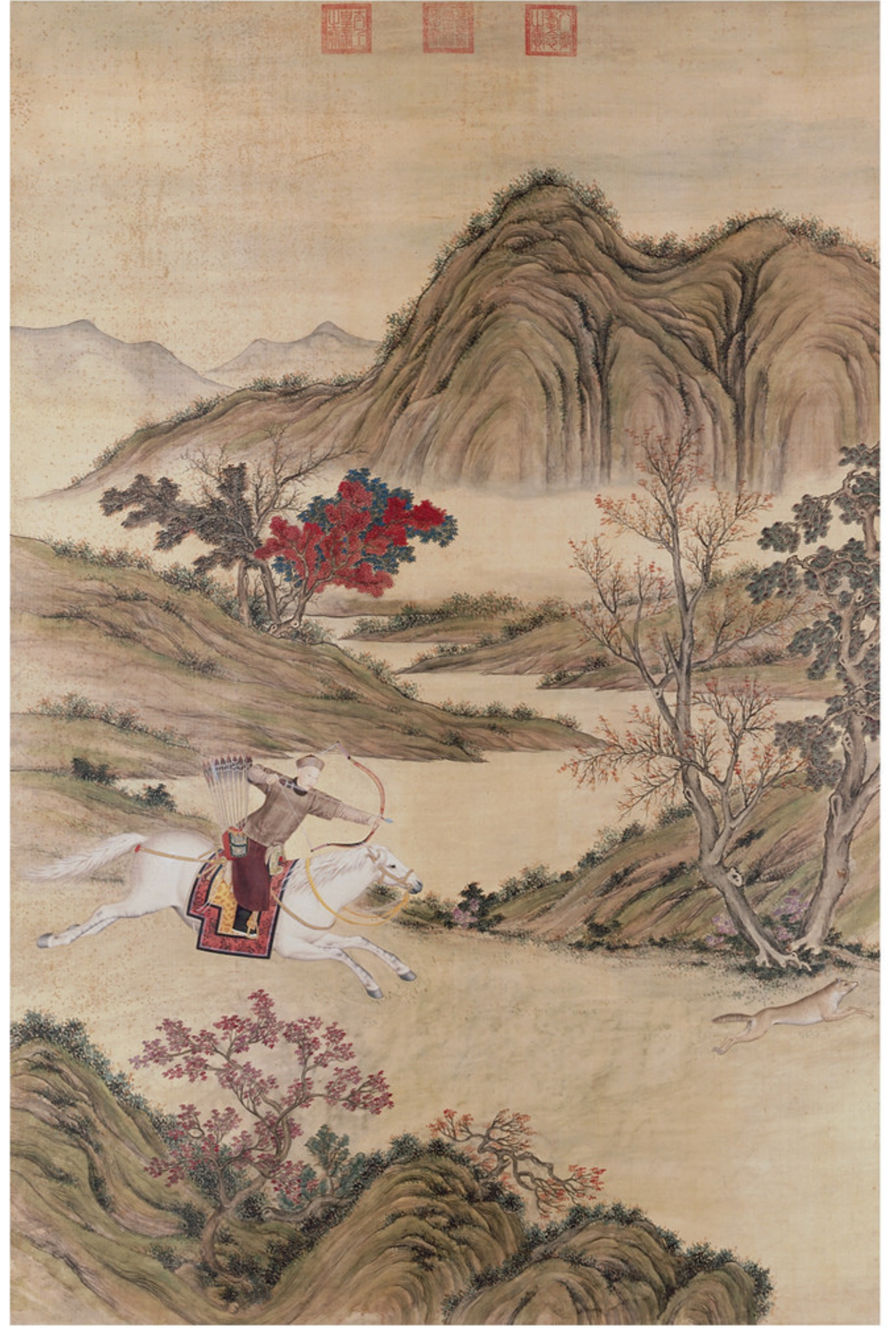
清人绘 弘历射狼图像轴 绢本设色 纵二五九厘米 横一七二厘米 故宫博物院藏