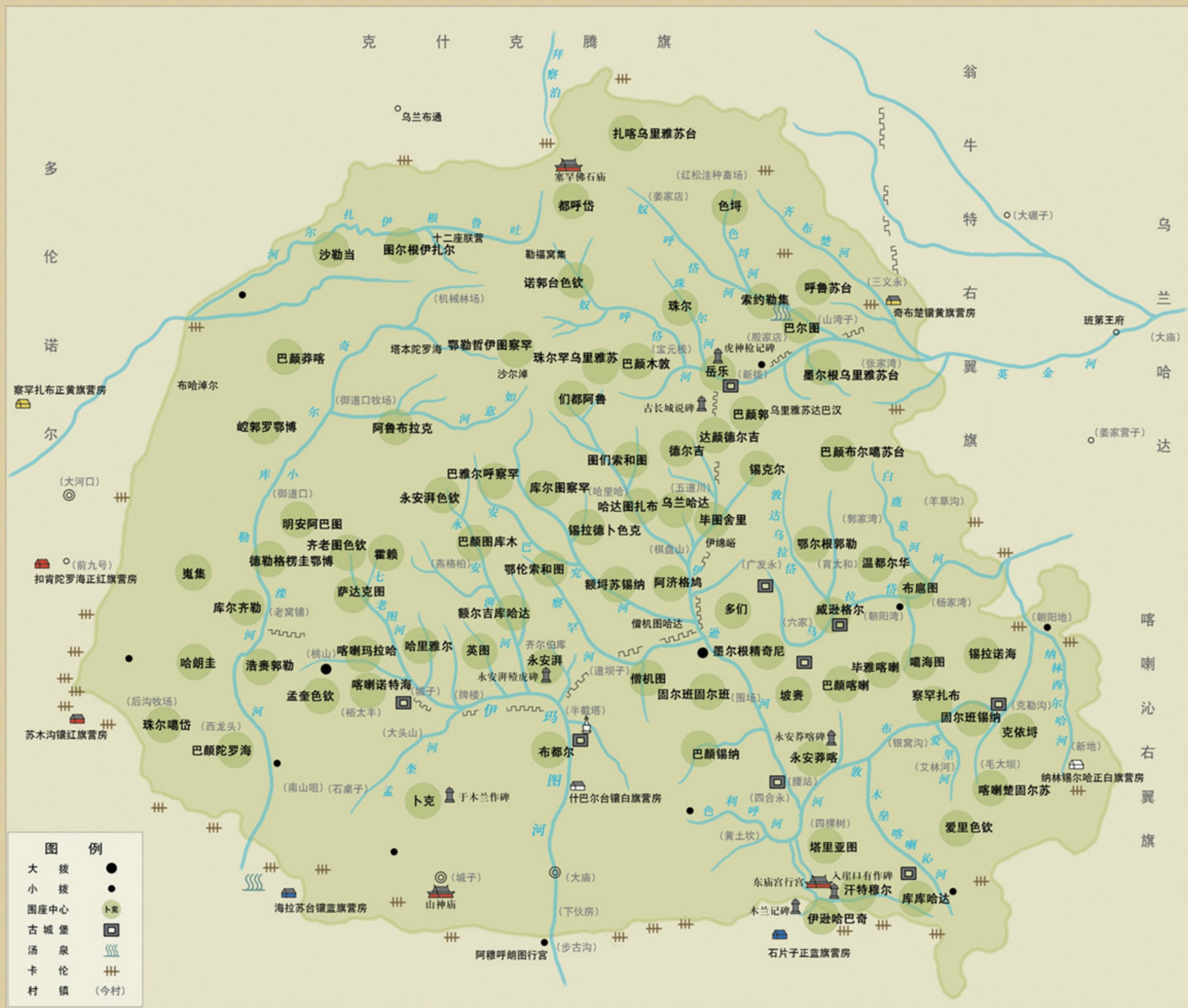
围场平面图 任超绘