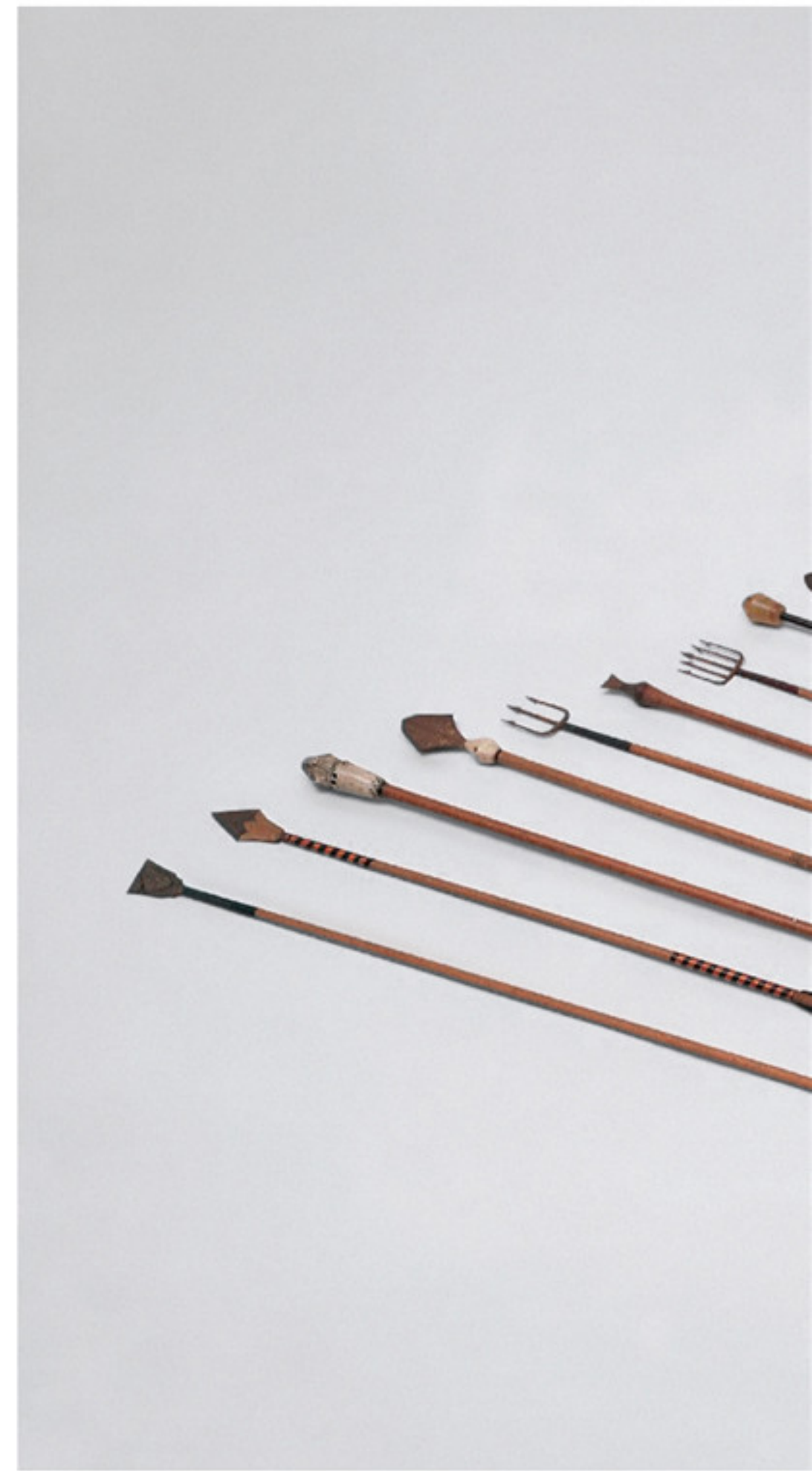
清帝使用的各类箭矢 故宫博物院藏