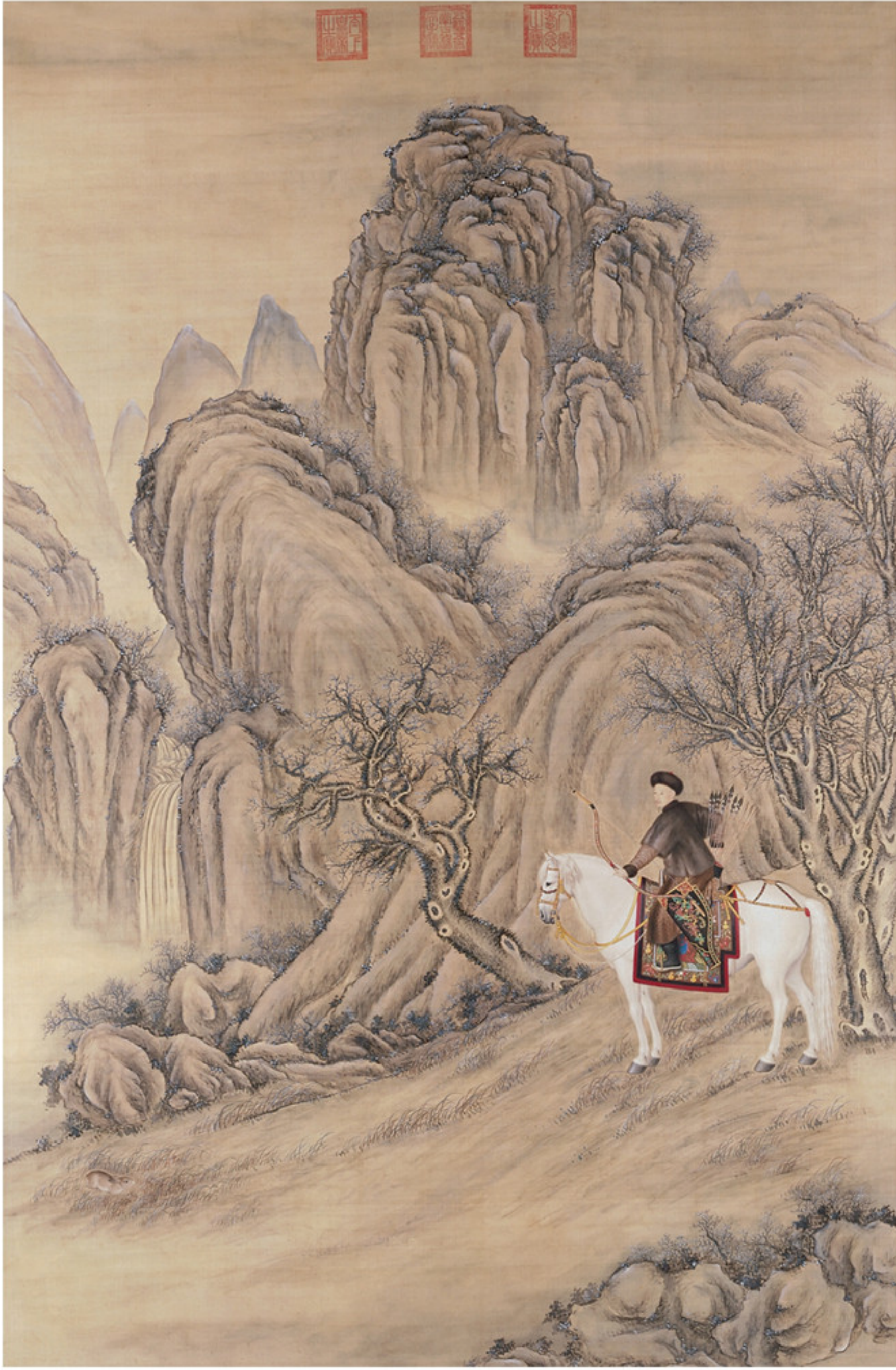
清人绘 弘历射兔图像轴 绢本设色 纵二五八厘米 横一七二厘米 故宫博物院藏