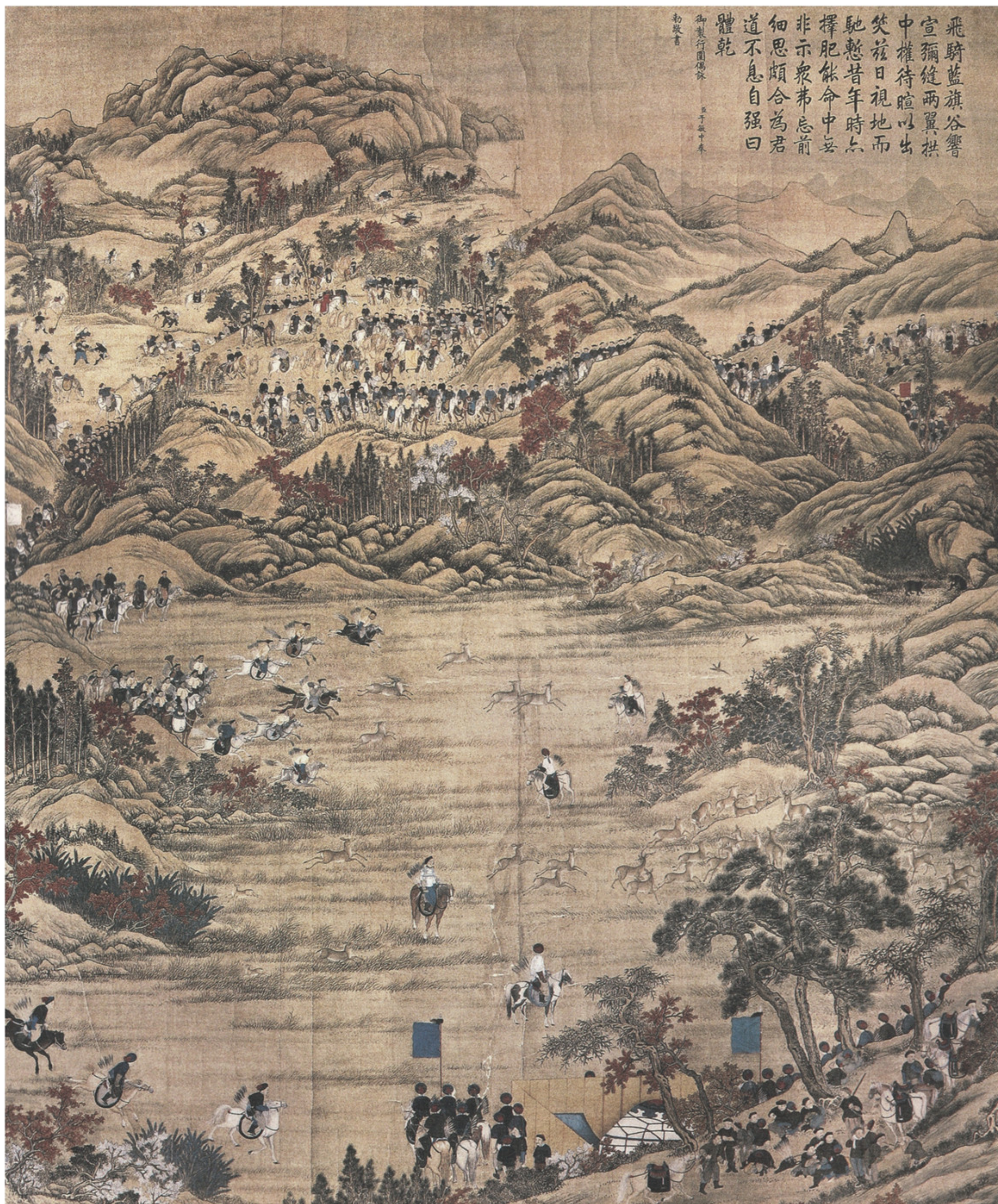
清人绘 高宗围猎图 选自《清帝与避暑山庄》