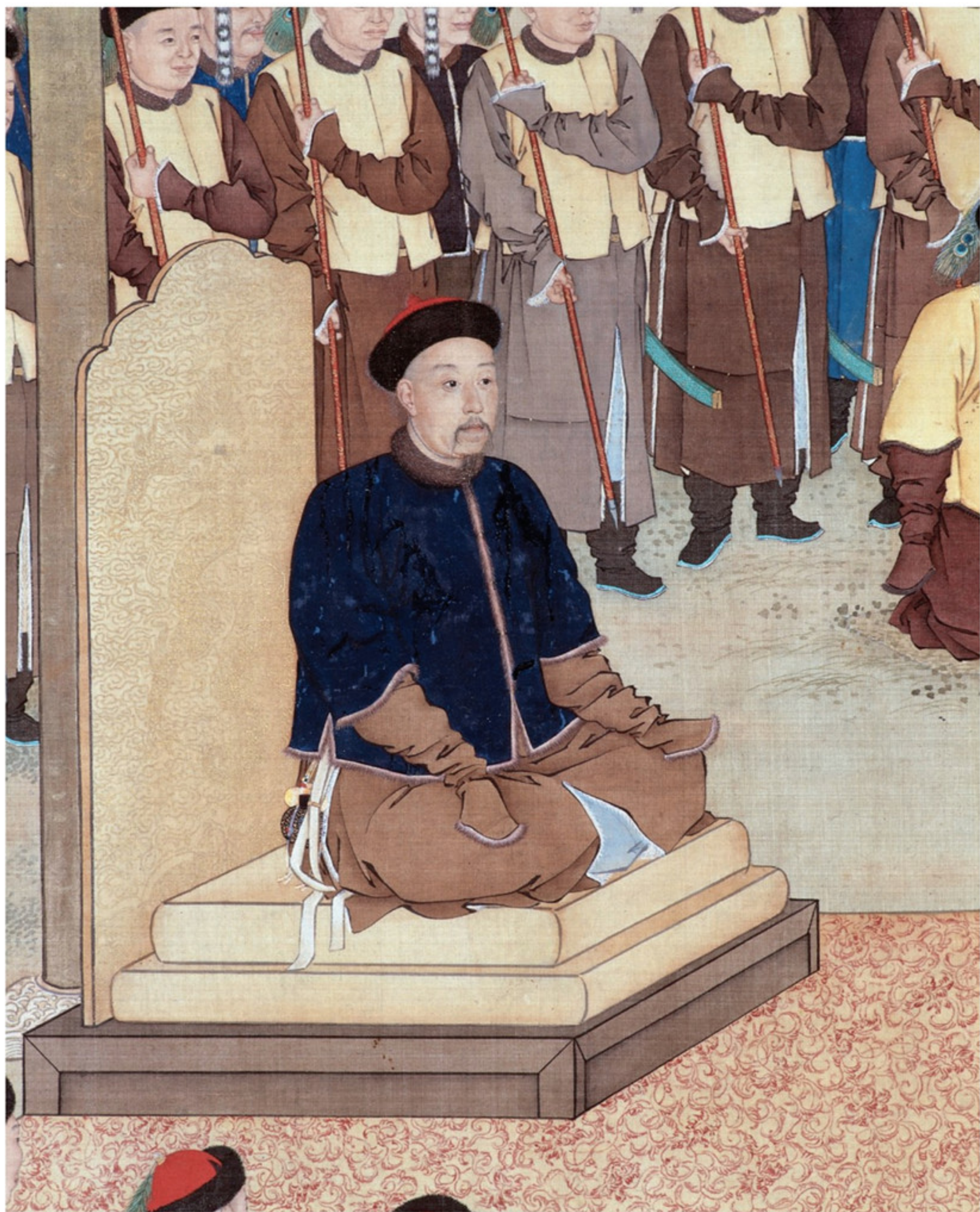
观赏「塞宴四事」的乾隆帝