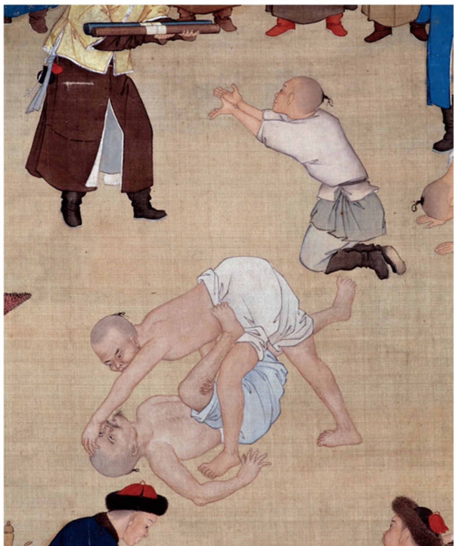
塞宴四事图局部之厄鲁特蒙古布库