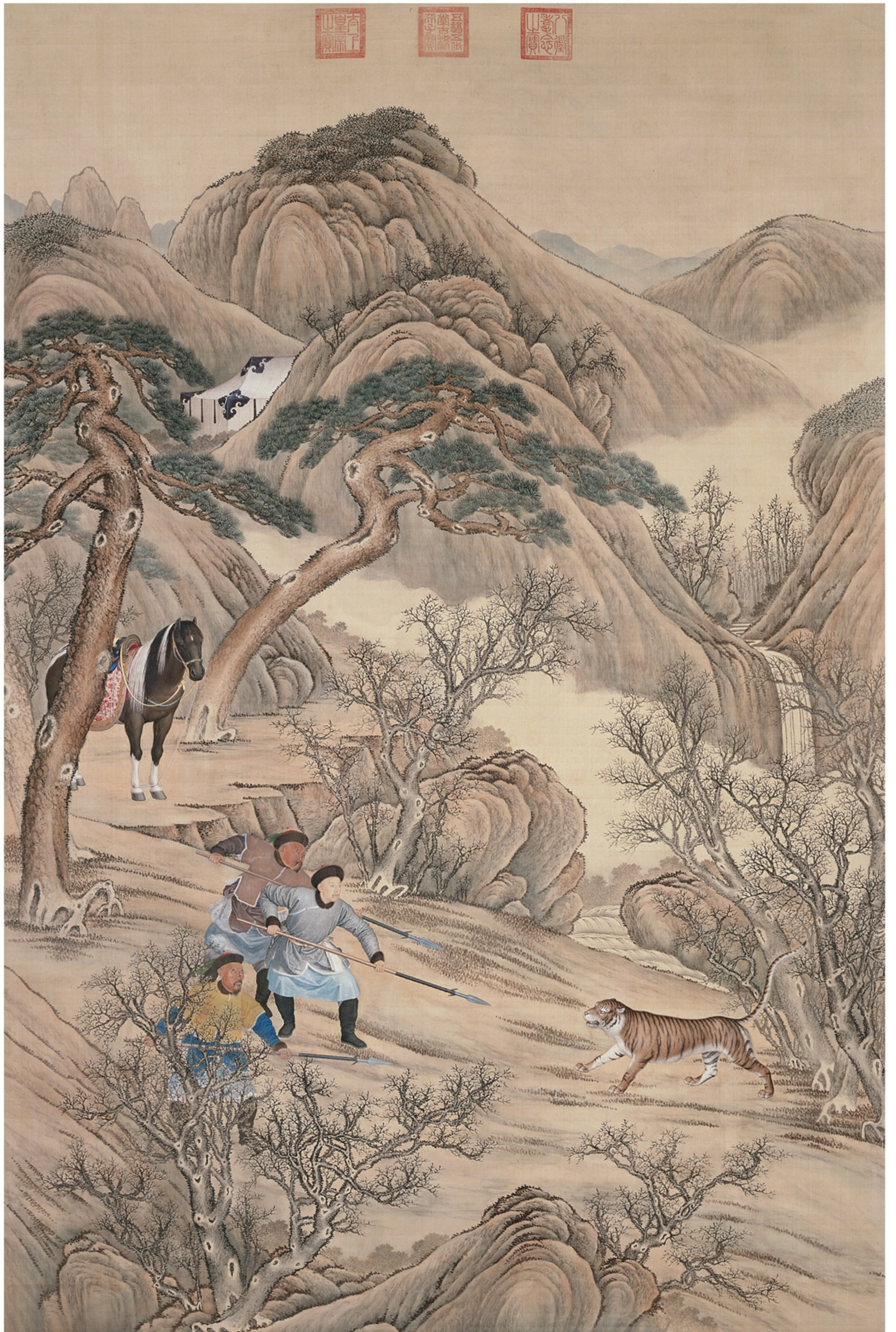
清人绘 弘历刺虎图像轴 绢本设色 纵二五八·五厘米 横一七一·九厘米 故宫博物院藏