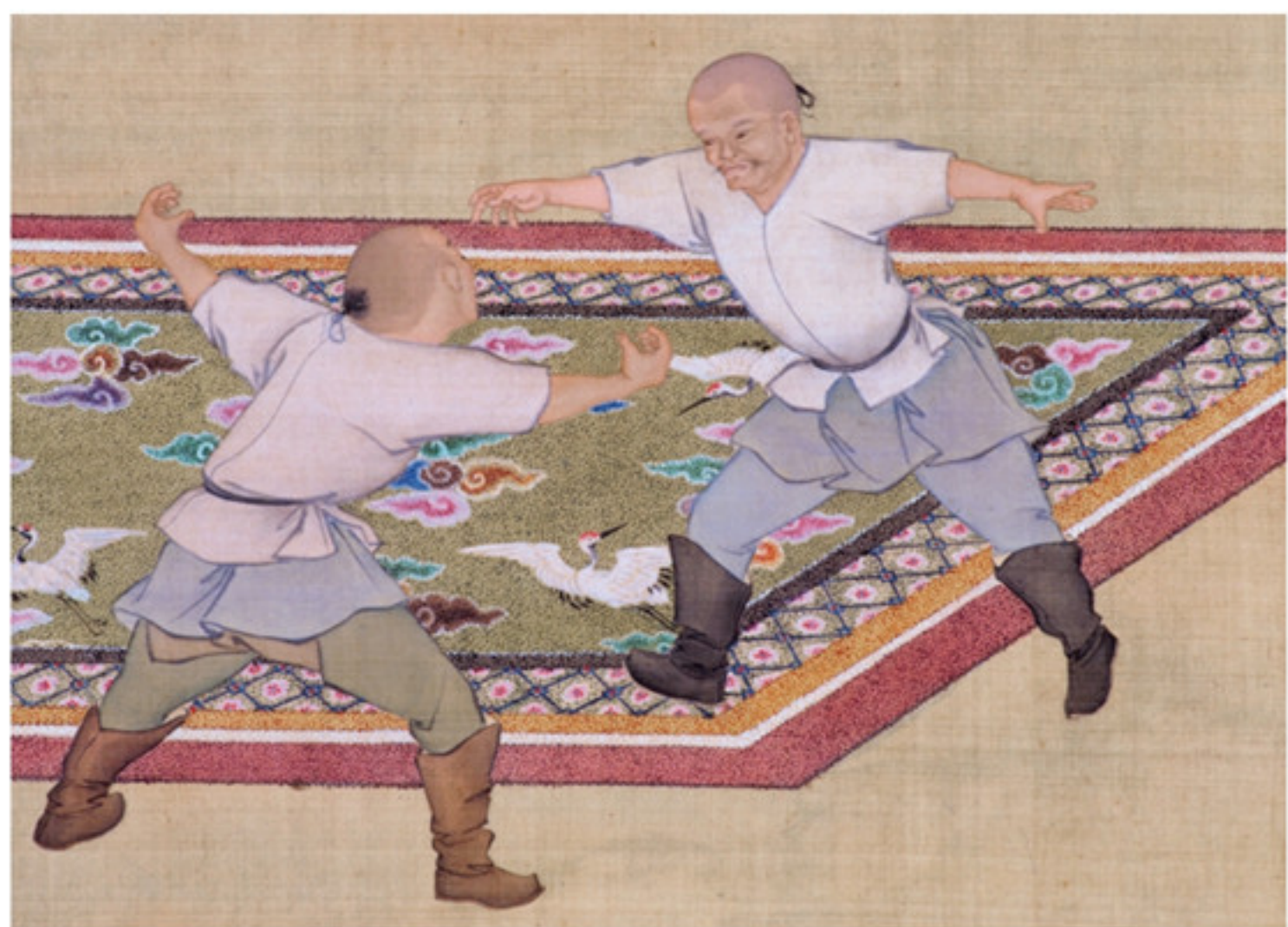
塞宴四事图局部之扎萨克蒙古布库

为胜；而厄鲁特蒙古布库则赤裸上身，不着靴，相角时对方扑地不致为胜，唯以扑地后「控首屈肩」不得脱为胜。胜者一般会被赐酒，要当下饮完。有时也会赏赐荷包、缎疋等物。在二十五年的蒙古宴会上，乾隆帝曾赏给一名得胜厄鲁特布库肥羊肉一盘，后者在皇帝面前举肉啣食，大口下咽的夸张场景令御前四座无不惊叹。皇帝引其至近前询问，他对皇帝说已经有十年没有这样吃过肉了，厄鲁特旧俗本就是这样的。