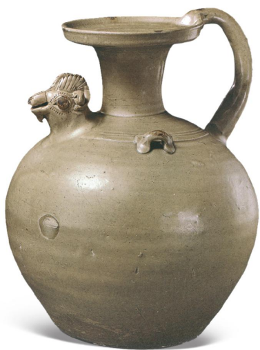
东晋 青釉羊头壶 高三·八厘米 故宫博物院藏

一般只有天子、诸侯才能施用，少牢稍逊，即用羊、豕各一，是诸侯、卿大夫祭祀宗庙时所用。《左传》也有记载：「祭以特羊，殷以少牢」，杜预注曰：「四时祀以一羊，三年盛祭以羊、豕。殷，盛也。」羊作祭品，为进献祖先，四时祀之圣物，祈求天下太平、永世安康，因而成为具有礼节意义的典型牺牲。《论语》有记曰：「子贡欲去告朔之饩羊，子曰：『赐也，尔爱其羊，我爱其礼。』」按古礼，周天子每月秋冬之交颁历书与诸侯，诸侯接受历书藏于祖庙，每逢初一便杀一只羊祭祀，然后到朝廷听政，曰「颁告朔」。后来，鲁国国君只是杀羊了事，既不亲临祖庙，也不听政，所以子贡惜羊无实枉杀，欲去之。