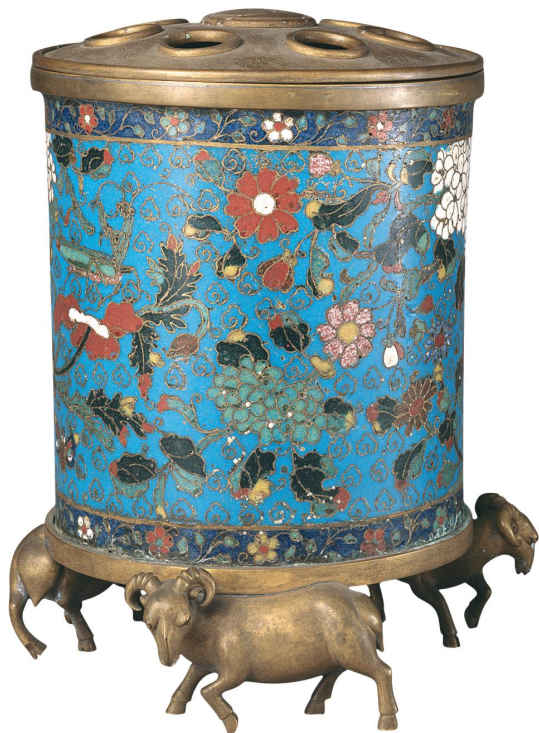
明 景泰款掐丝珐琅花蝶纹羊足花插 高二二·五厘米 故宫博物院藏