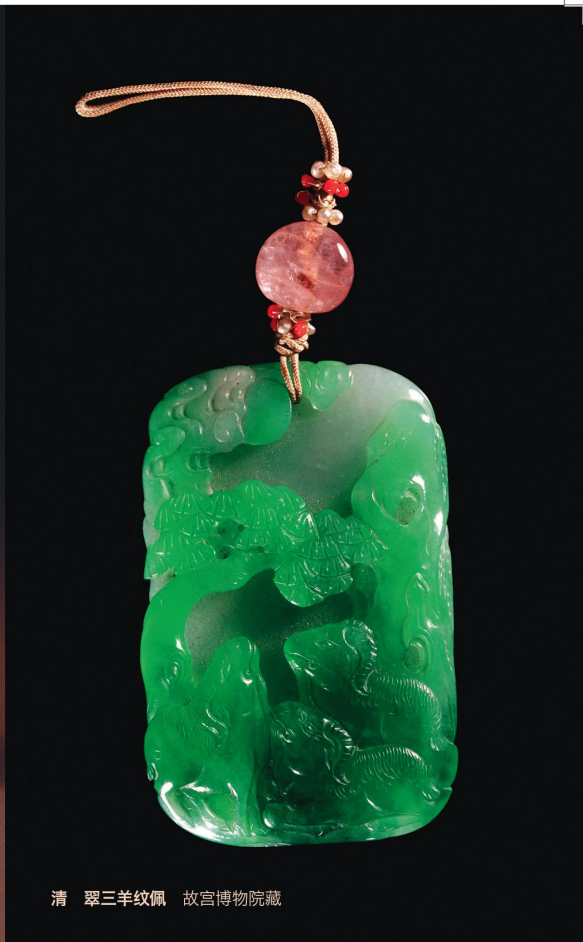
清 翠三羊纹佩 故宫博物院藏