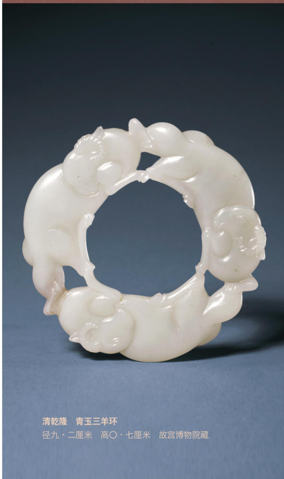
清乾隆 青玉三羊环 径九·二厘米 高〇·七厘米 故宫博物院藏