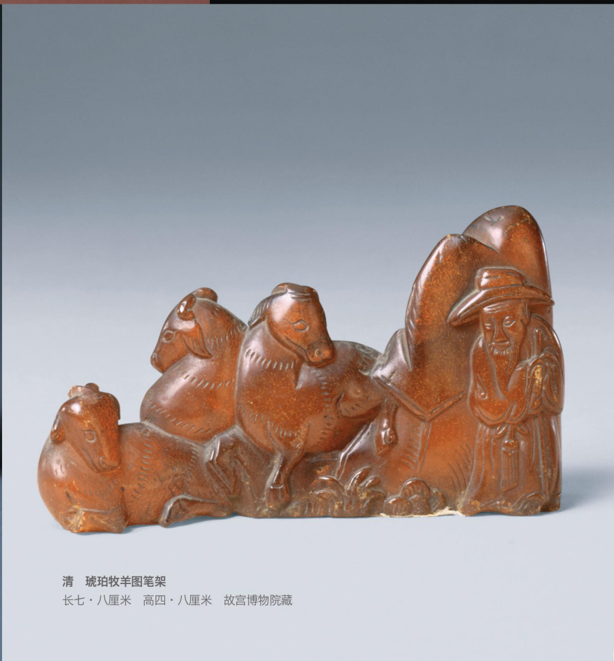
清 琥珀牧羊图笔架 长七·八厘米 高四·八厘米 故宫博物院藏