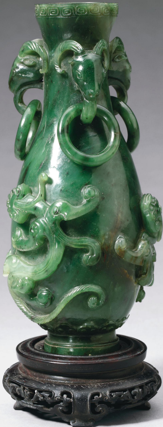
清 碧玉蟠螭纹三羊耳活环瓶 故宫博物院藏