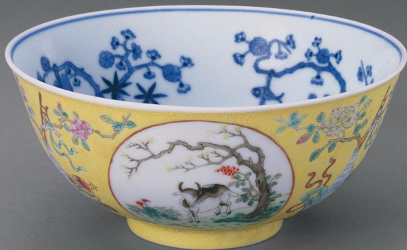
清 光绪款黄地开光粉彩三羊纹碗 口径一五厘米 高六·五厘米 故宫博物院藏