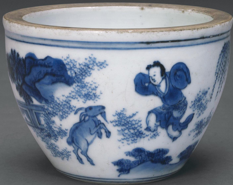
清 青花戏羊图缸 口径一二厘米 高八·一厘米 故宫博物院藏

的另一个来源起自仪式，有学者通过研究的甲骨文认为「美」字「疑象人饰羊首之形」，而戴羊角一般是在庆祝仪式中的盛装部分，也有氏族首领或是巫师戴羊角以示威仪。由此，「美」之来源也与道德准则和社会威望结合在一起。总之，羊的秉性逐渐被人格化，成为仁人君子标榜的对象。