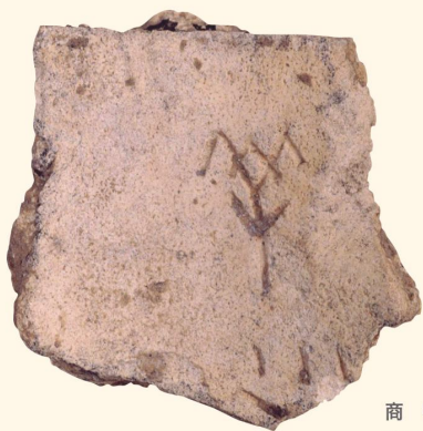
商 甲骨文“羊”卜辞 故宫博物院藏