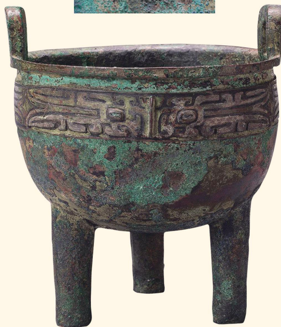
商 羊鼎 高一六·四厘米 故宫博物院藏