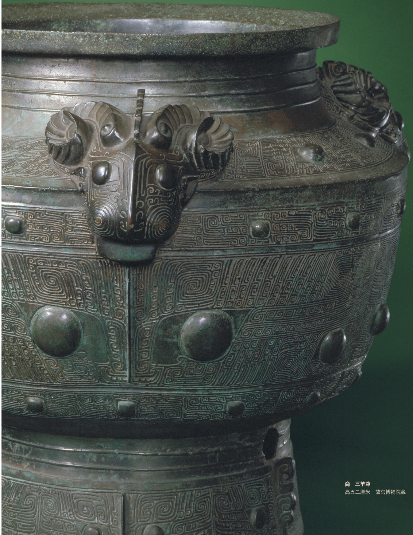
商 三羊尊 高五二厘米 故宫博物院藏