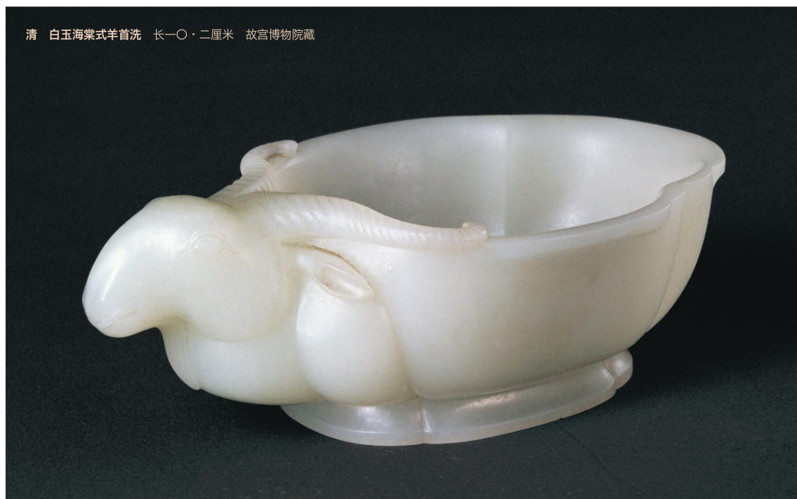
清 白玉海棠式羊首洗 长一〇·二厘米 故宫博物院藏