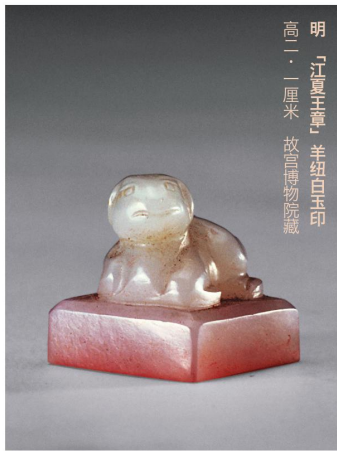
明「江夏王章」羊纽白玉印 高一·一厘米 故宫博物院藏

友抢到寓意勤俭持家。蒙古族新生儿要包进羊羔皮里，以求平安吉祥。羌族为孩子举行成年礼时，巫师用白色牡羊毛线作为赠礼围在冠礼人脖子上。哈萨克族流行羊头敬客的习俗，羊脸朝向客人的方向，以示欢迎。蒙古族人以烤全羊待客，将羊身上最鲜嫩的部分以小刀片下，献给尊贵的客人或老人。在这些习俗中，人们都把美好的愿望寄托在羊的身上，羊也成了祝福