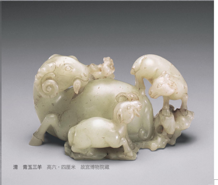
清 青玉三羊 高六·四厘米 故宫博物院藏