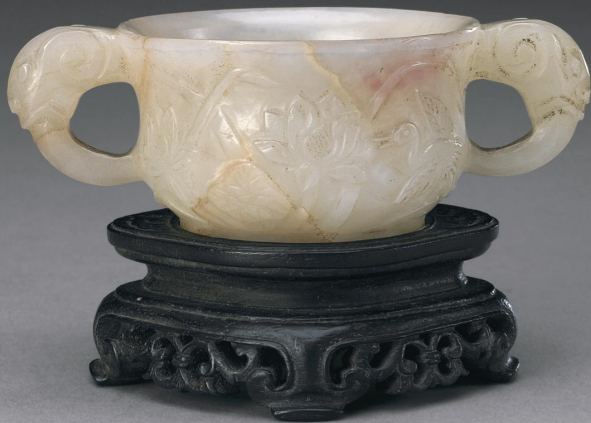
明 青玉羊耳莲荷纹杯 高三·四厘米 故宫博物院藏