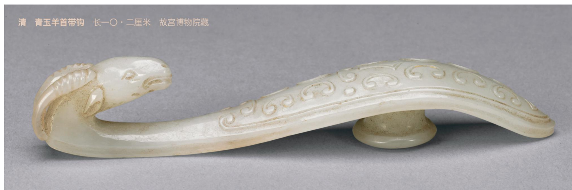
清 青玉羊首带钩 长一〇·二厘米 故宫博物院藏