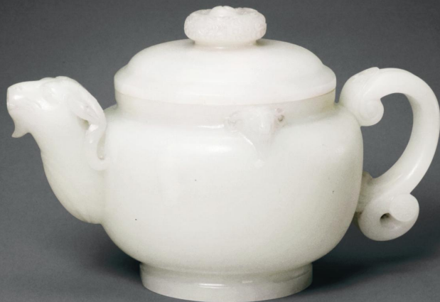
清 白玉三羊执壶 高一〇·二厘米 故宫博物院藏