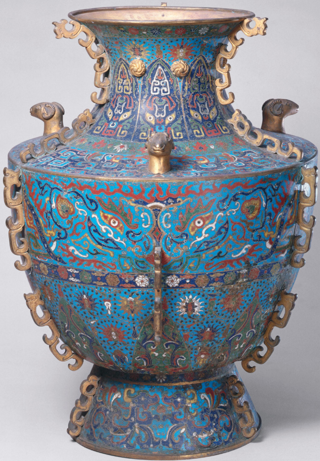
明 掐丝珐琅缠纹三羊尊 高八七厘米 故宫博物院藏