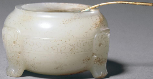
战国 白玉云纹三羊首足水丞 高二厘米 故宫博物院藏