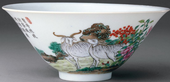
清 嘉庆款粉彩三羊纹碗 口径一三·六厘米 高六·一厘米 故宫博物院藏