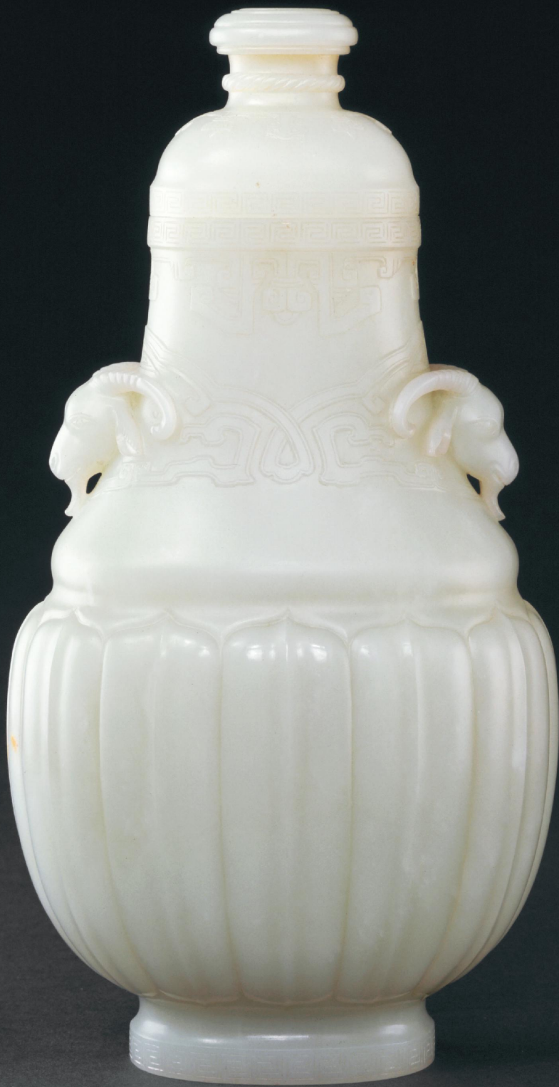
清 青玉羊耳莲瓣纹盖瓶 高一七·五厘米 故宫博物院藏