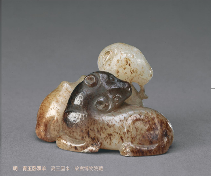
明 青玉卧双羊 高三厘米 故宫博物院藏