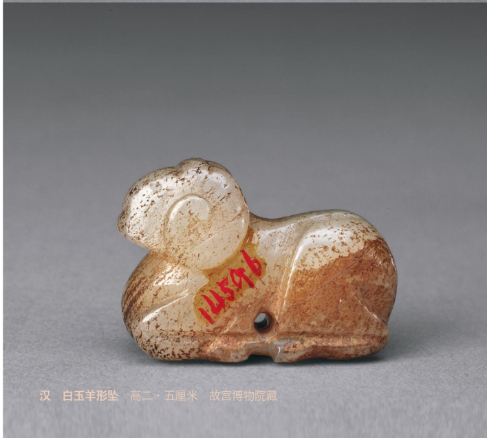
汉 白玉羊形坠 高二·五厘米 故宫博物院藏