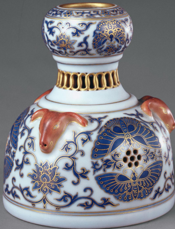
清 乾隆款青花描金团蝶纹三羊镂空花熏 高一四·三厘米 故宫博物院藏

且具有和而不同、群而不党的品性。孔颖达对《诗经·召南·羔羊》「德如羔羊」进行注疏时曾说：「《宗伯》注云：羔取其群而不失其类。《士相见》注云：羔取其群而不党。」群而不党，即是和谐相处而不结党营私，是儒家理想的社会交往状态——「君子矜而不争，群而不党」。羊虽群居，但鲜见争斗，因而成为合群的典型代表。