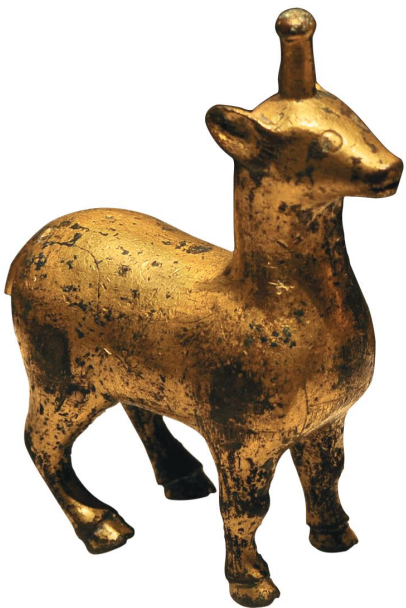
汉 铜鎏金獬豸 高五·五厘米 山西博物院藏

在古人心目中，羊具有通灵特性，羊是可以沟通天地鬼神的神判灵物。神话中有一独角神羊，名曰「獬豸」，可明辨事理、判断是非，是为代表正义的法兽。《神异经》有曰：「獬豸忠直，见人斗，则触不直；闻人论，则咋不正。一名任法兽。」《论衡》也记曰：「（獬豸）一角之羊也，性知有罪。皋陶治狱，其罪疑者，令羊触之，有罪则触，无罪则不触。故皋陶敬羊。」也就是说，遇到曲直难断的情况，皋陶便放出独角神羊獬豸，被其顶触的，一准是有罪之人。《后汉书·舆服志下》也有：「獬豸，神羊，能辨别曲直，楚王尝获之，故以为冠。」