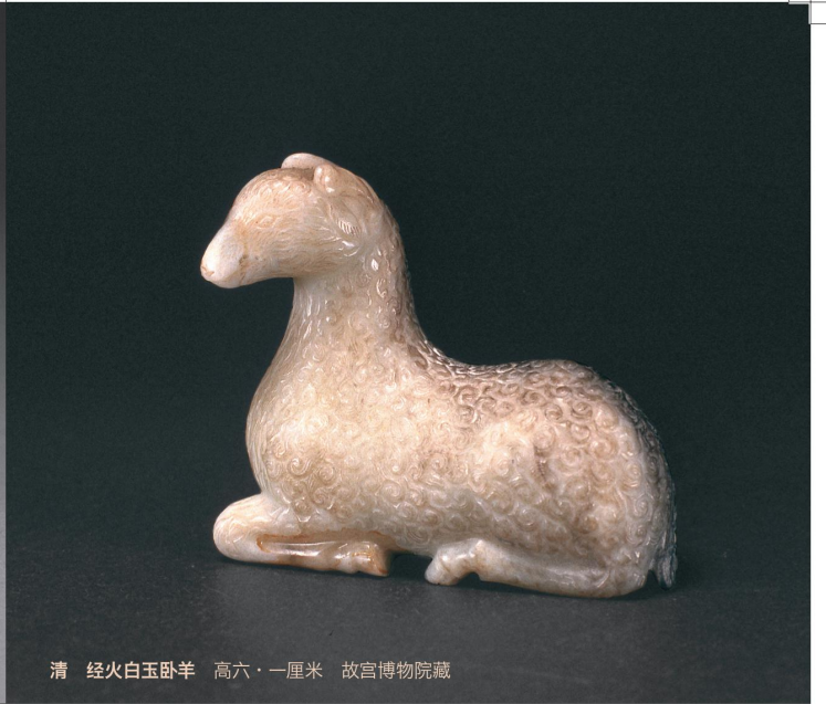
清 经火白玉卧羊 高六·一厘米 故宫博物院藏