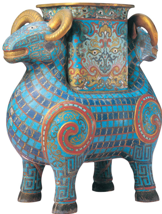
清 掐丝珐琅双羊尊 高三五·五厘米 故宫博物院藏