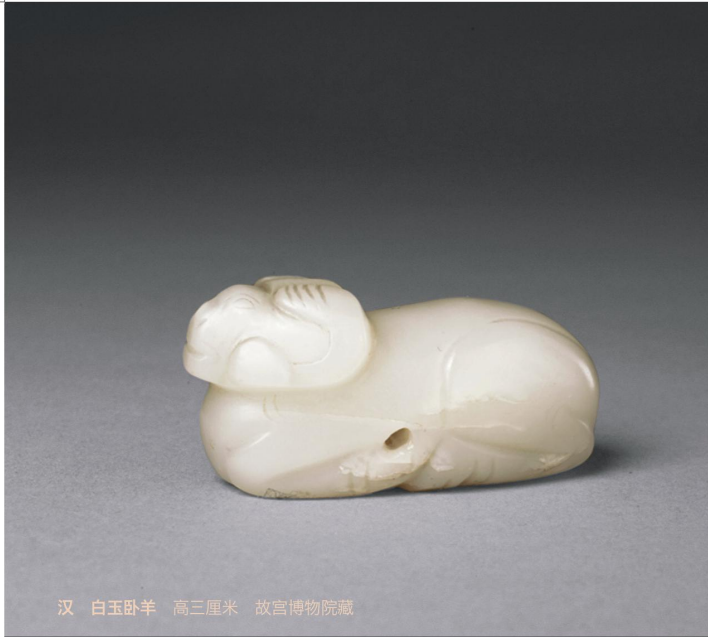
汉 白玉卧羊 高三厘米 故宫博物院藏