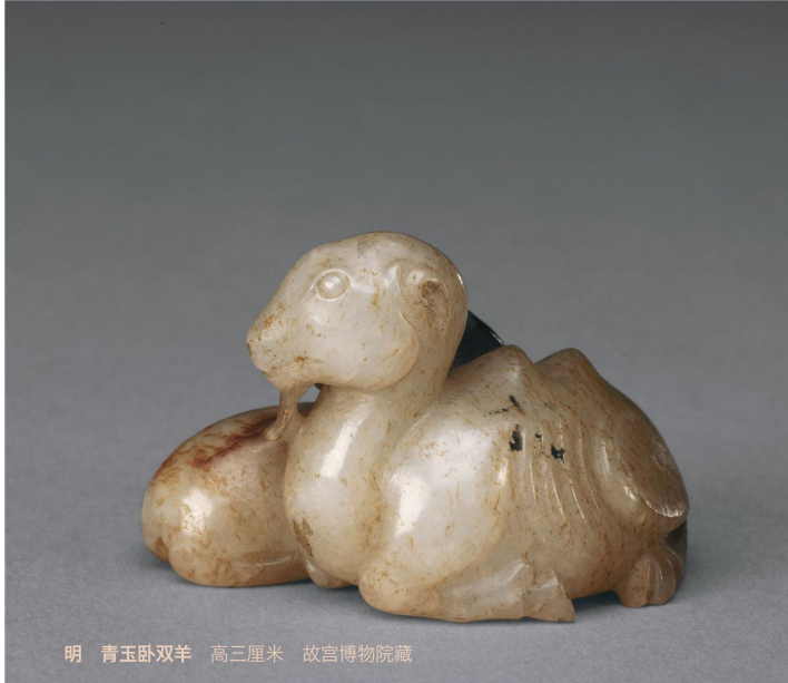
明 青玉卧双羊 高三厘米 故宫博物院藏