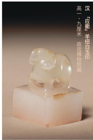
汉「应衡」羊纽白玉印 高一·九厘米 故宫博物院藏