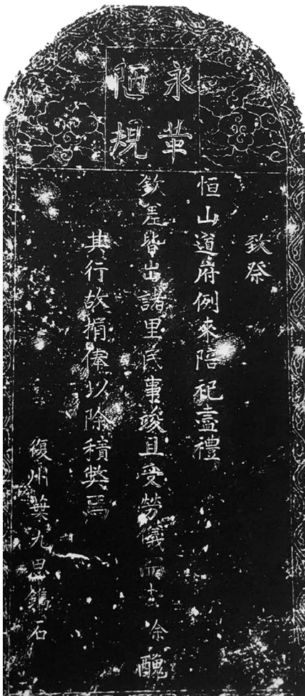
〔图二〕清康熙二十年永革陋规碑