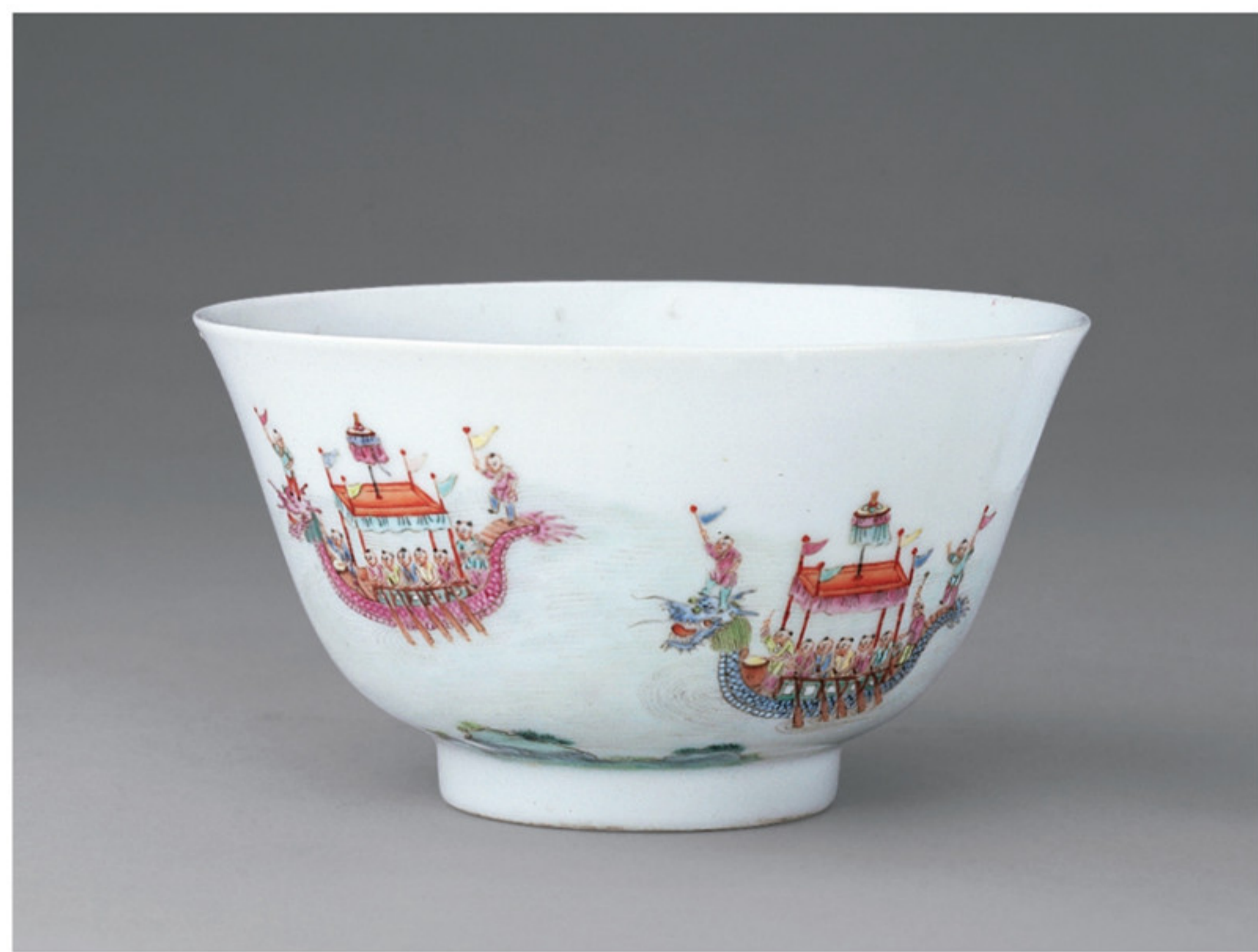
清道光「慎德堂」款粉彩婴戏龙舟碗 故宫博物院藏