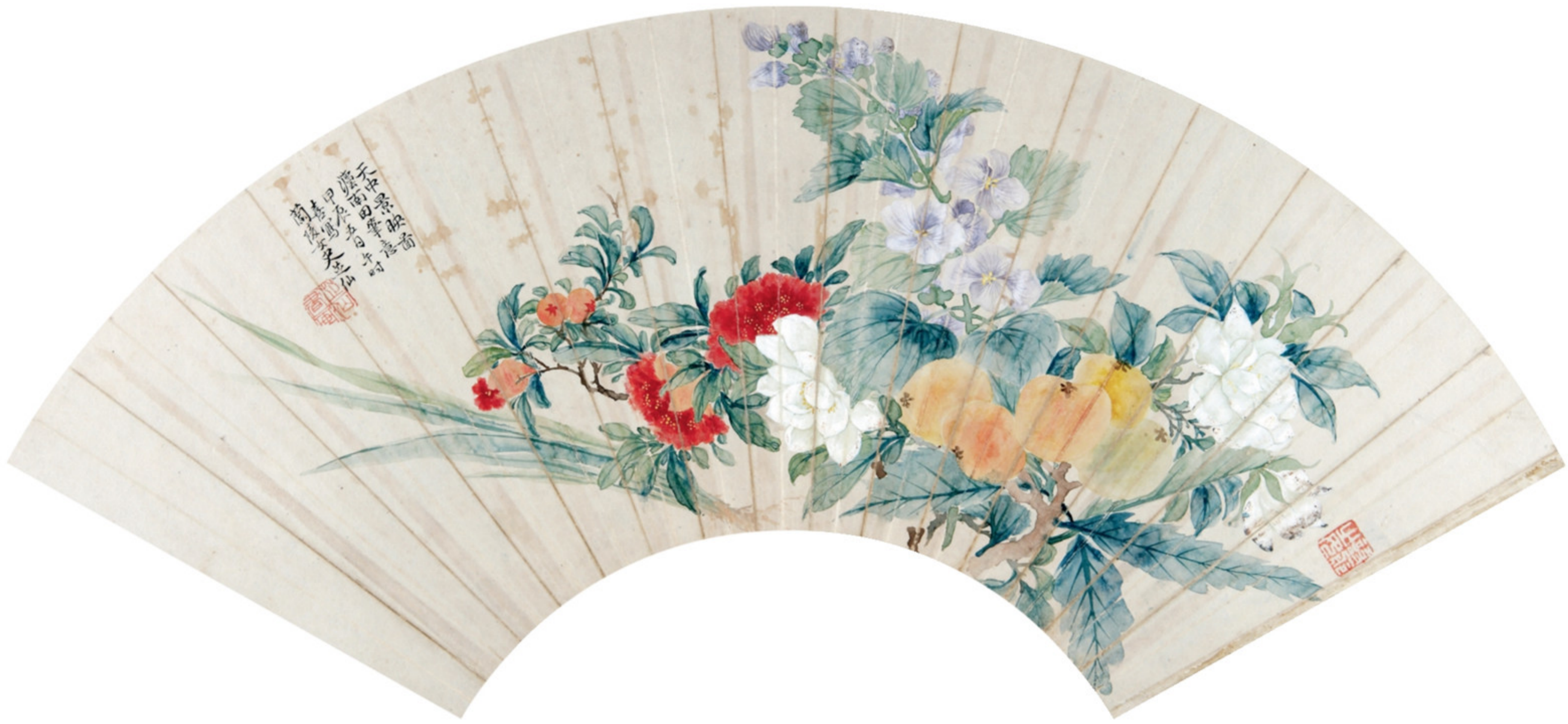
清 恽怀英 天中景映图扇页 纸本设色 纵一七·八厘米 横五二·五厘米 故宫博物院藏