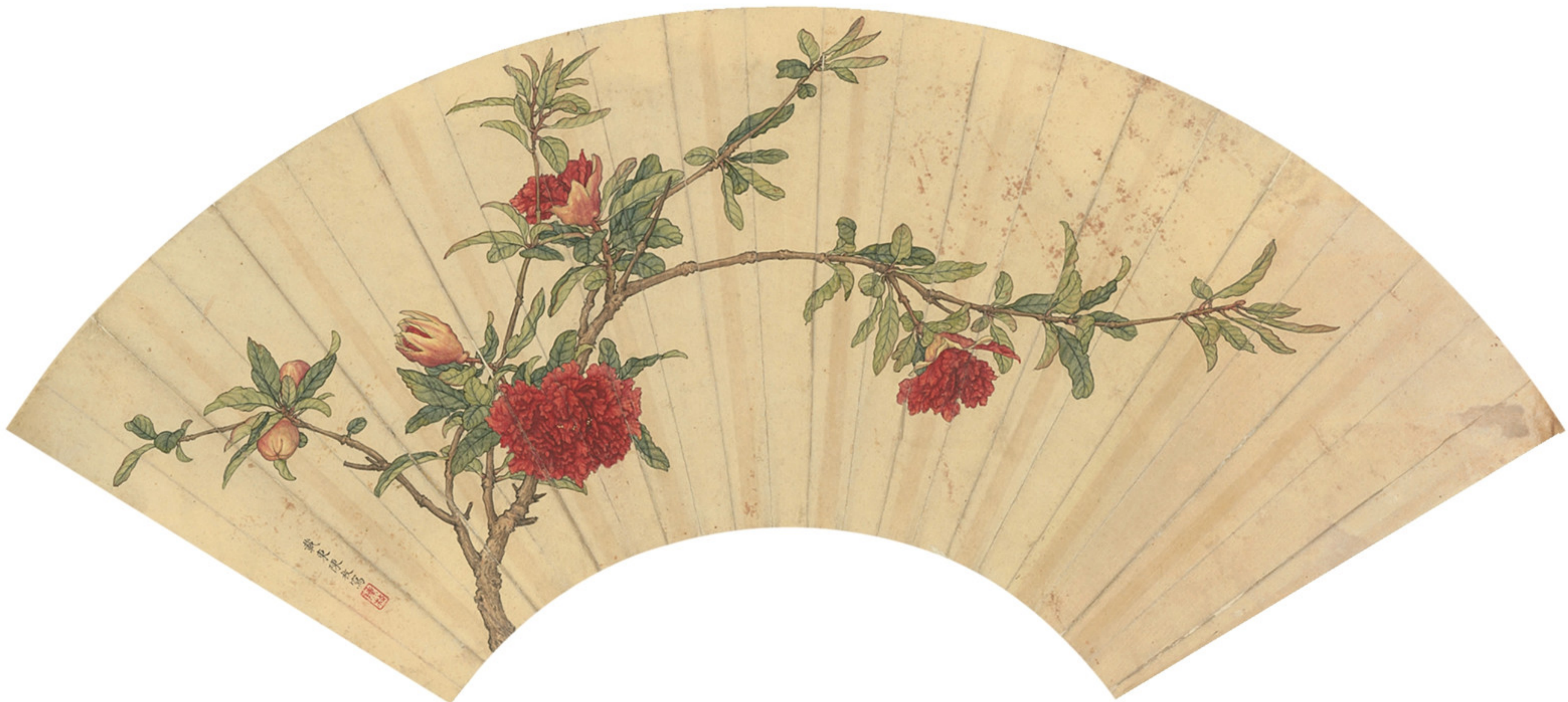
清 陈枚 榴花图扇页 纸本设色 纵一九·五厘米 横五七·五厘米 故宫博物院藏