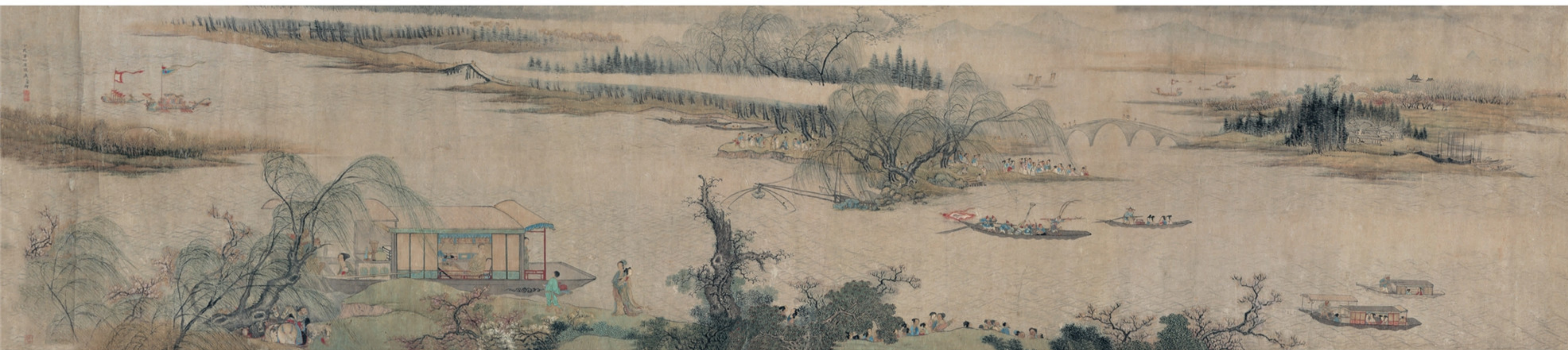
清 禹之鼎 吊屈原图像卷 故宫博物院藏