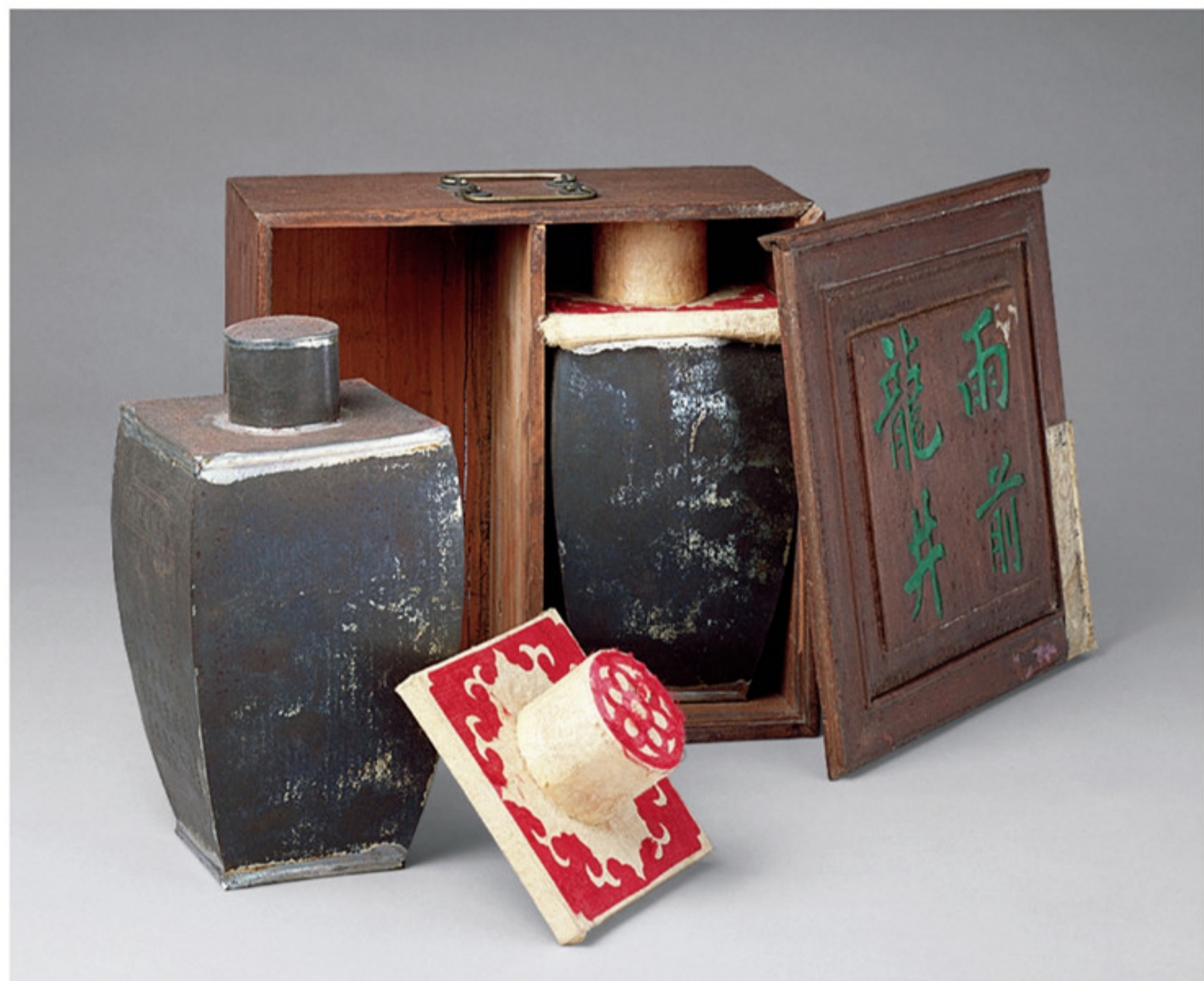
清 龙井茶 故宫博物院藏

茶是我国特有的植物饮品，具有食用、药用价值，《神农本草经》中便有「神农尝百草，日遇七十二毒，得茶而解之」的记载。端午节时值仲夏，气温逐升，湿气增强，蚊虫多扰，疾病多发，这时候自然少不了祛晦安神、防暑解渴的茶。在端午节期间皇帝常将茶叶作为礼物馈赠给家人和大臣。如乾隆五十一年（一七八六年）端午节，乾隆帝赐妃嫔等位、十公主，大普洱茶六个，女儿茶三十个。嘉庆二十五年（一八二〇年）的端午节，嘉庆帝进皇太后、诚禧皇贵妃等位大普洱茶八个，女儿茶五十个；赏王子大臣翰林等普洱茶三瓶，花茶五瓶；禄喜等普洱茶二十四瓶；如喜、陆福寿、长寿、寿喜、倪四官普洱茶十一瓶。从上到下，无一遗漏。