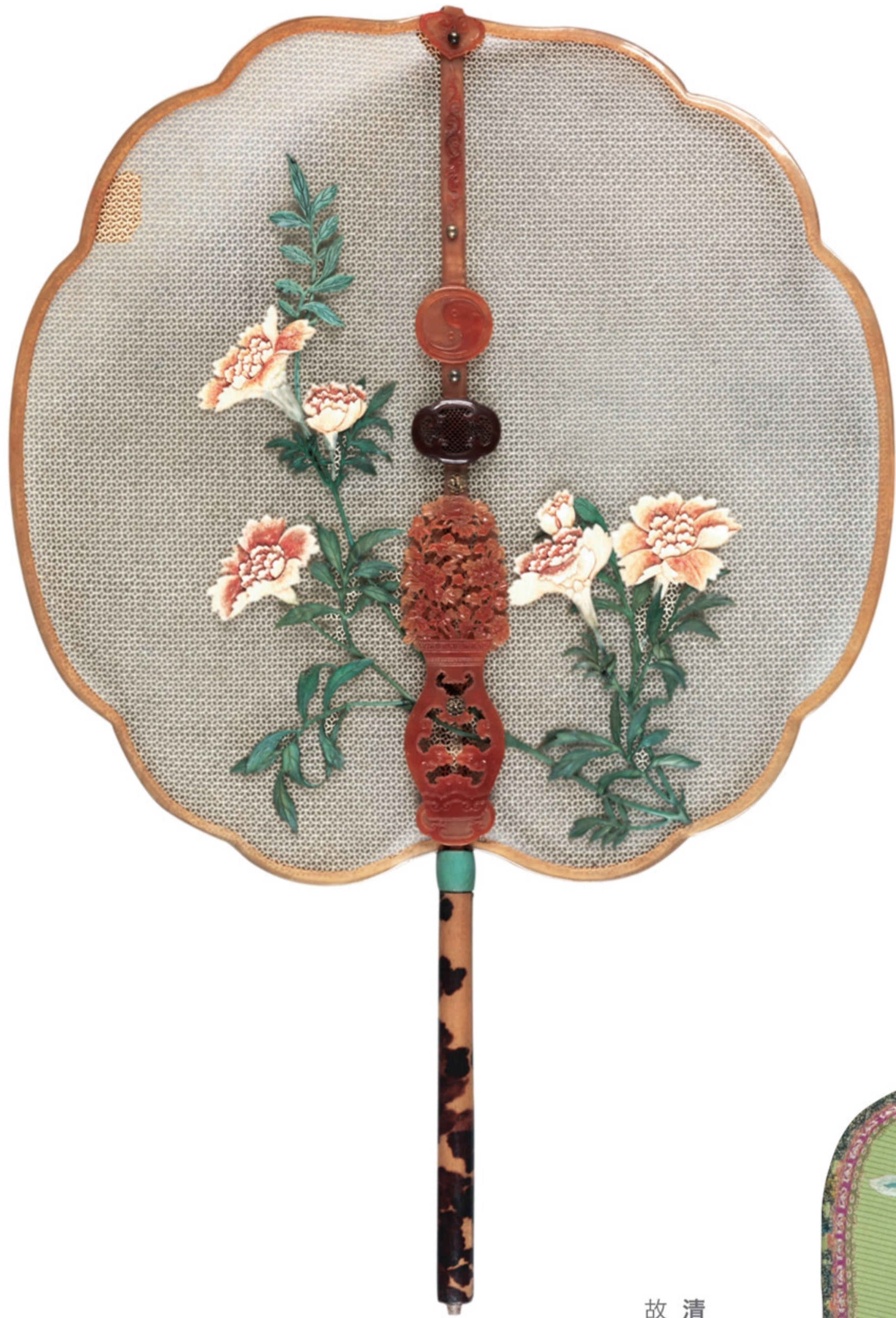
清 象牙雕锦地纹嵌象牙雕石榴花团扇 故宫博物院藏