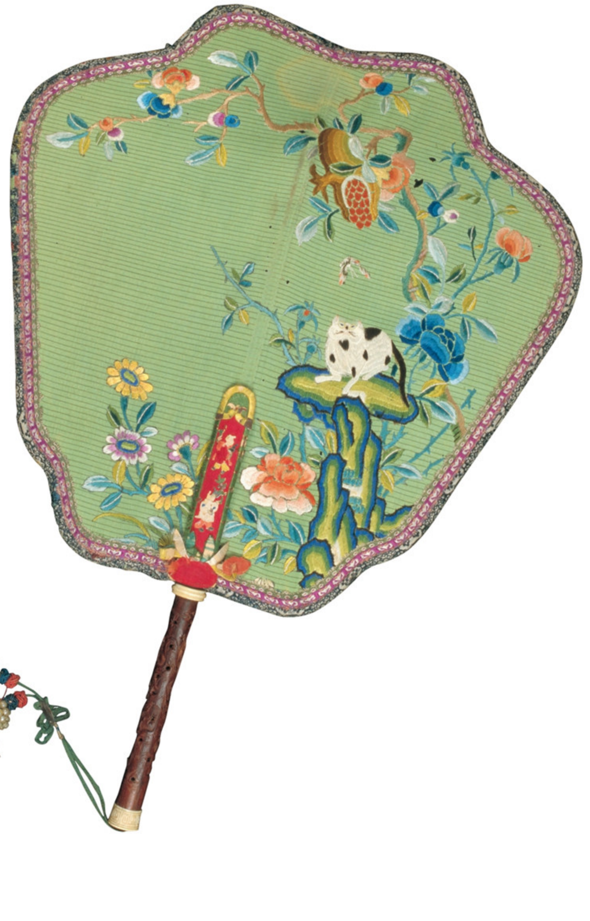
清 罗面绣猫蝶石榴红木刻花柄团扇及局部 故宫博物院藏